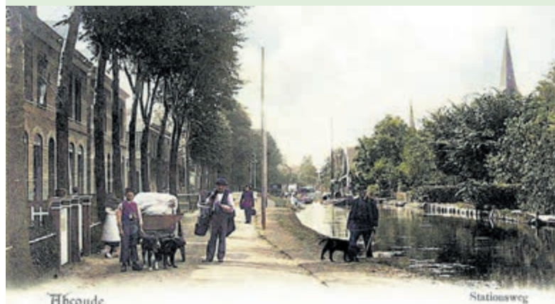
Hondenkar Stationsweg Abcoude 1900.