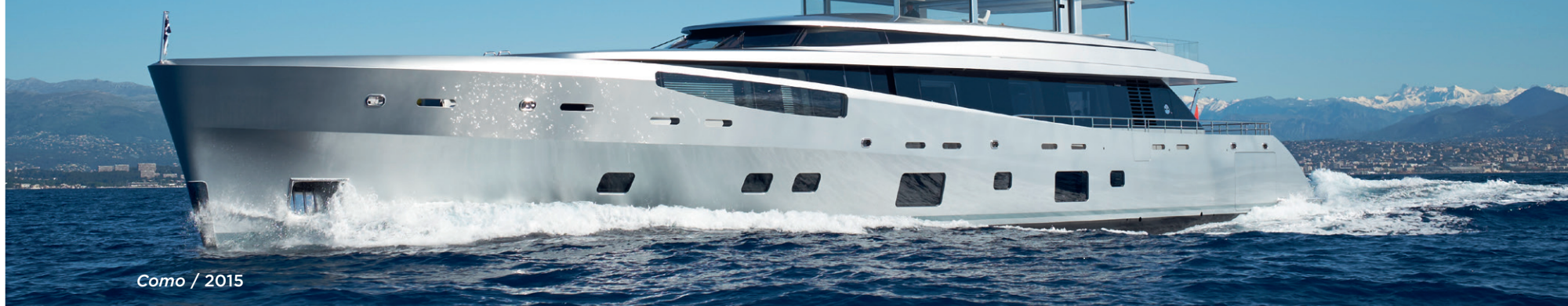
Como / 2015