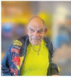
Sportliefhebber in hart en nieren met voorliefde voor Ajax en zijn KDO

Verdrietig en geschokt zijn wij door het plotseling overlijden van mijn broer en zwager