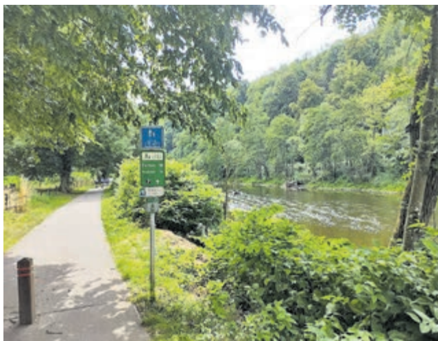
Een van de RAVel-paden in de Belgische Ardennen.