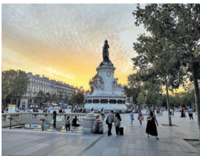
Place de la République bij zonsondergang in Parijs.