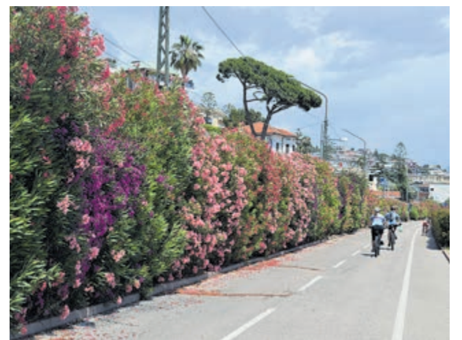
Bloemenpracht op fietspad langs zee in Sanremo.