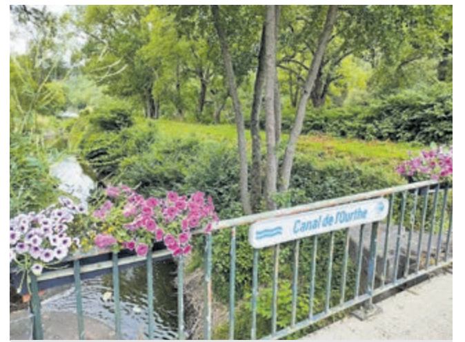
RAVel fiets pad langs de Ourthe en het Ourthekanaal nabij Esneux.