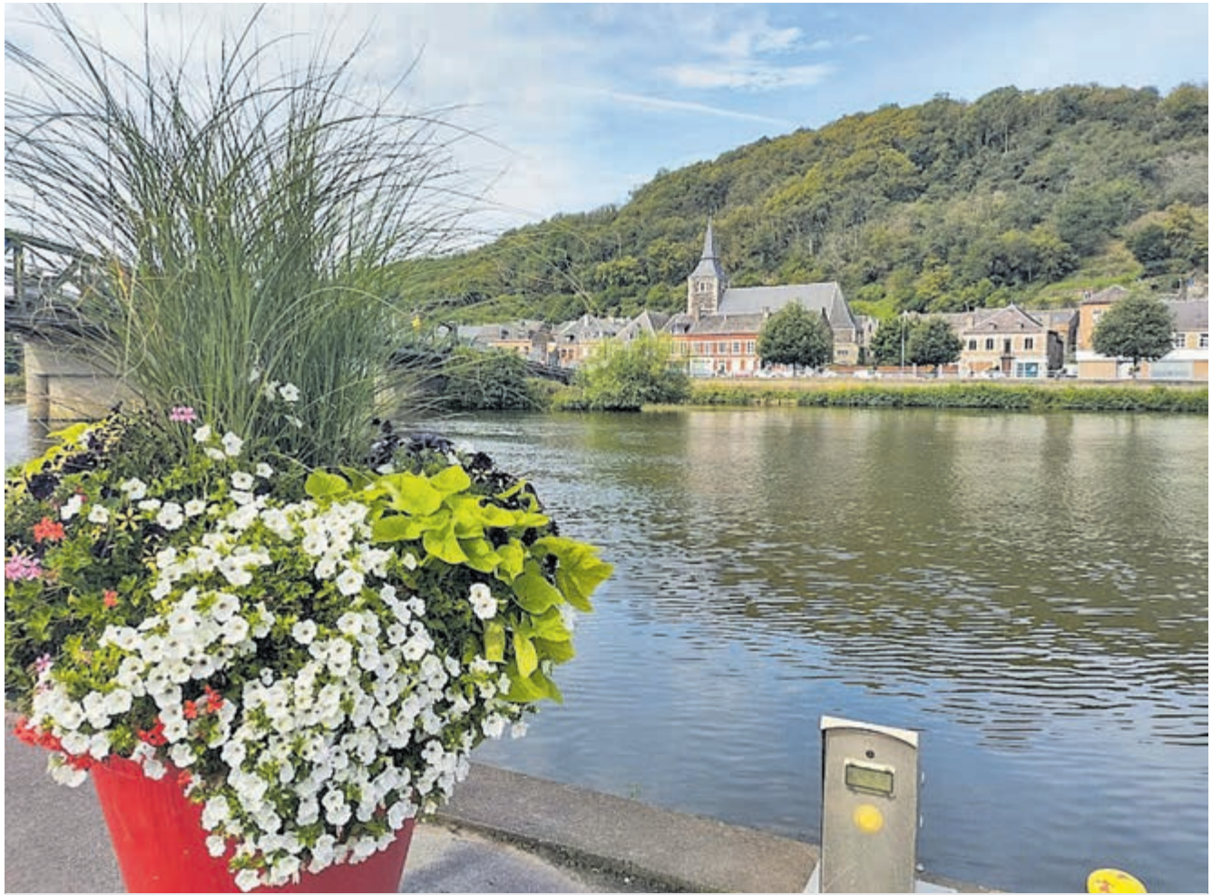
Fietsen langs de fraaie Maas in de Franse Ardennen.

Een wereldstad met de fiets ontdekken is natuurlijk ook erg bijzonder. Eerlijkheid gebiedt te zeggen dat steden natuurlijk vreselijk druk qua verkeer zijn en deze fietstochten minder geschikt zijn om met een jong gezin te doen: voor kinderen kan dit hachelijke situaties opleveren. Houd hier rekening mee. Het mooie is dat bijvoorbeeld steden als Parijs (Velib) en Milaan (BikeMi) een witte fietsenplan hebben. Overall in de stad staan fietsenrekken, waarbij je een fiets kunt huren met een kort abonnement via de QR-code en app en elders in de stad kunt terugplaatsen in zo'n rek. Deze stadsfietsen zijn vrij robuust en oorspronkelijk bedoeld om van snel A naar B te gaan in de stad. Daarnaast zijn elektrische steps via zo'n soort systeem beschikbaar. Meer informatie (in het Engels) over Velib in Parijs op: www.velib-metropole.fr/en en BikeMi in Milaan op: www.bikemi.com/en . Nog een tip voor Milaan: houd er rekening mee dat in Milaan een aantal straten in het centrum nog met grote stenen kasseien is aangelegd. Niet altijd comfortabel om over heen te fietsen. Veel plezier!