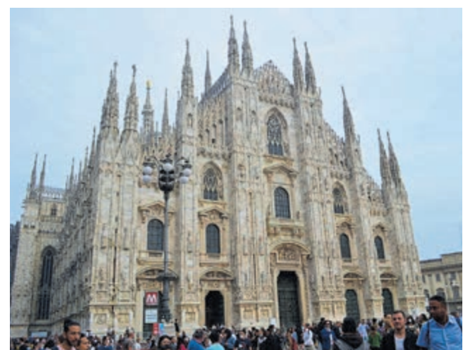
Dom van Milaan.