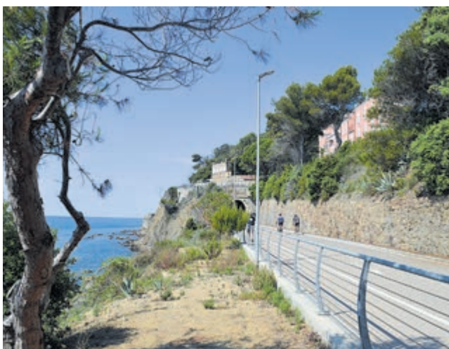
Fietspad langs Liguurse kust in Italië.