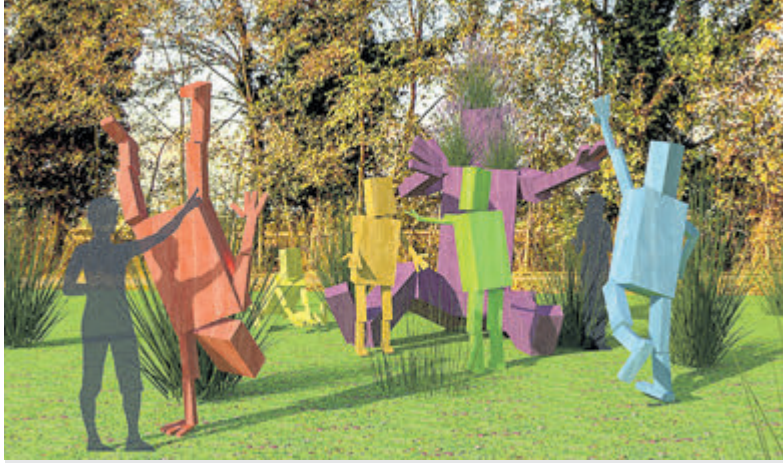
De leden van 'Familie de Scheg', die straks bij MFA De Scheg komen te staan.