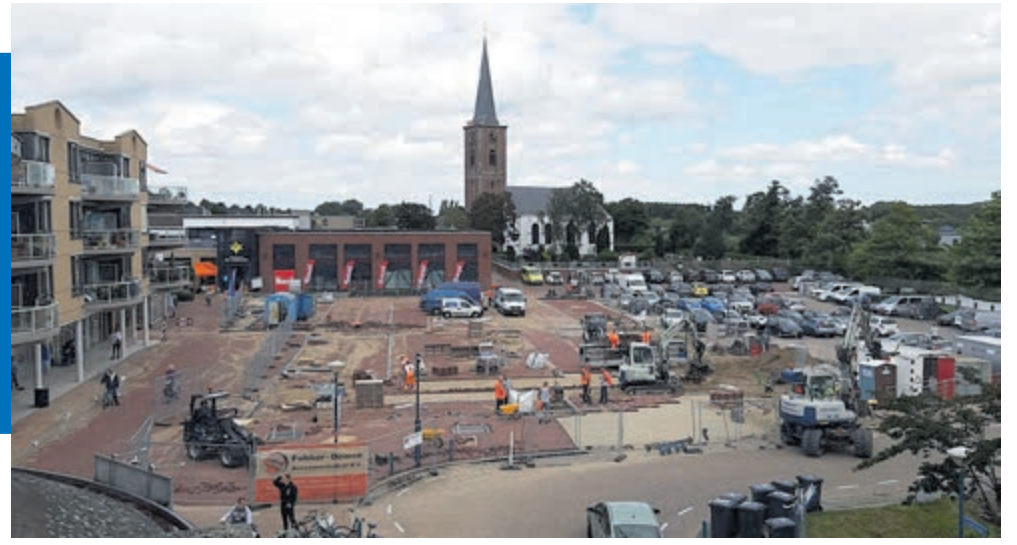
Werk in uitvoering (foto d.d. 28 juli)

op 22 juni 2020. De werkzaamheden waren eerder in juli 2019 gepland. Omdat uit bodemonderzoek bleek dat er sprake was van vervuiling, is de start uitgesteld. Om de overlast voor winkeliers, bewoners en winkelend zoveel mogelijk te beperken, is vastgehouden aan de rustige zomerperiode. Bovendien worden de werkzaamheden in deelgebieden aangepakt. In mei is de uitbreiding van het terrein voor lang