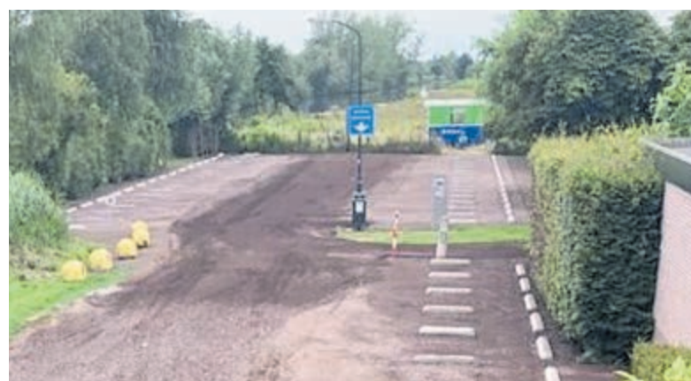
Het opgeknapte parkeerterrein aan Achterbos is van parkeervakken voorzien.

wordt nu gekeken hoe deze zo goed mogelijk kunnen worden verwerkt. Het college neemt hierover waarschijnlijk in augustus een verkeersbesluit en zal dit dan ook publiceren.