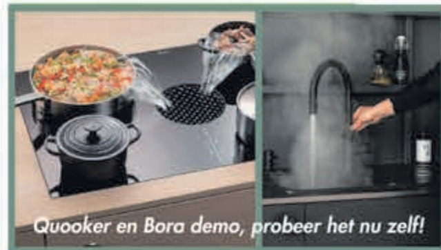
Quooker en Bora demo, probeer het nu zelf!