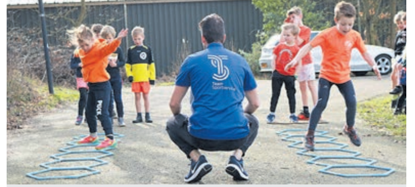
Team Sportservice helpt gemeenten met het organiseren van buitenspeeldagen.

De gezamenlijke inzet van politie en gemeente past binnen de voortdurende samenwerking om de gemeente Uithoorn veilig en leefbaar te houden. Gerichte controles zoals deze zullen ook in de toekomst worden uitgevoerd.