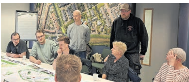
De input van eerdere participatie, onder andere van (oud)skaters en BMX'ers, is meegenomen in het ontwerp.

Uithoorn Bruna Amstelplein 81 Gemeentehuis Uithoorn Laan van Meerwijk 16 Read Shop Zijdelwaardplein 58c Jumbo Zijdelwaardplein 60