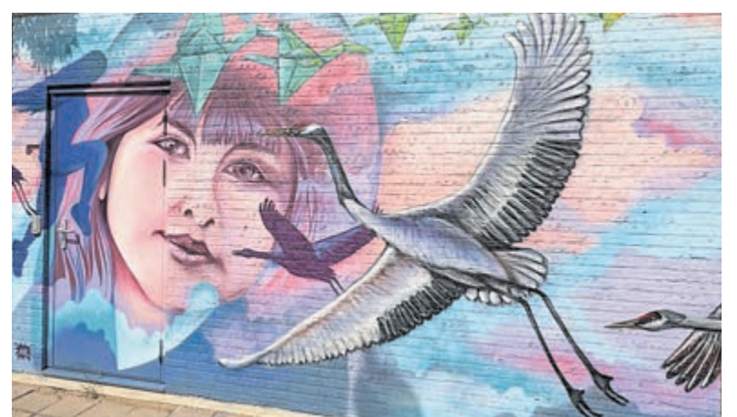
Het kunstwerk bij rotonde Uithoorn draagt herinnering en hoop.