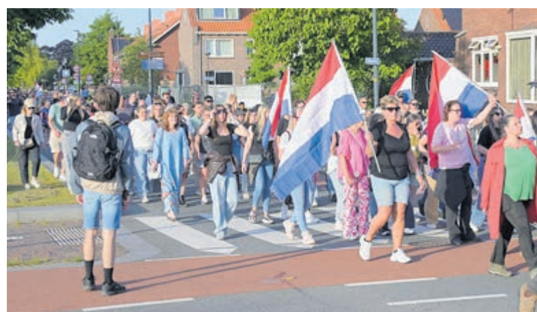
Met de vlag in protest.

Twee personen aangehouden Volgens berichtgeving zijn later op de avond twee personen aangehouden in verband met verstoring van de openbare orde, waaronder het gooien van een voorwerp richting de tegendemonstranten. Beide personen zijn inmiddels weer vrijgelaten. Rond 22.00 uur keerde de rust terug in de omgeving van het Amstelplein en het gemeentehuis. De demonstraties volgden op het besluit van de gemeente om een omgevingsvergunning te verlenen voor een opvanglocatie aan de Wiegerbruinlaan. Het COA mag daar een AZC realiseren voor bijna 250 asielzoekers, met een maximale exploitatieduur van vijftien jaar.