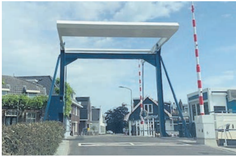
De Heulbrug is weer open voor weg- en vaarverkeer.

Kennismaken met of informatie over bridgen in De Kwakel: bvkbestuur1@gmail.com . Het nieuwe seizoen start donderdag 10 september, na de Kwakelse kermis.