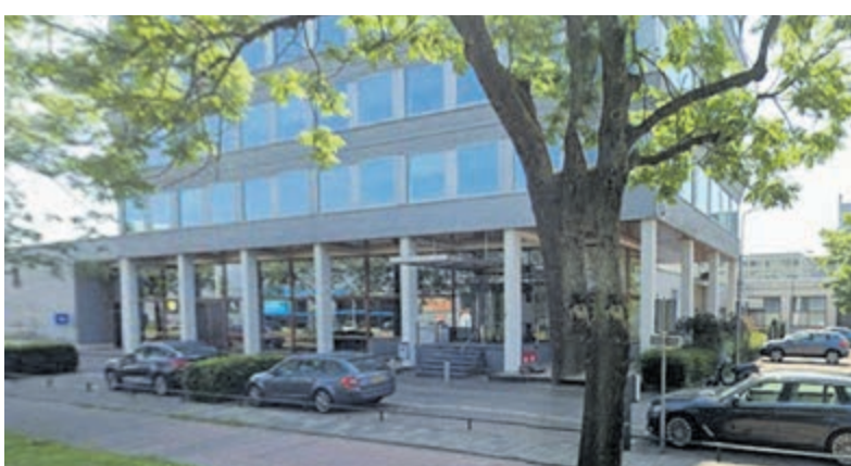
Het pand aan de Wiegerbruinlaan.