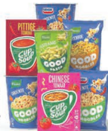
Alle Knorr Cup-a-Soup, Good Noodles, Good Pasta of Good Potatoes M.u.v. Cup a Soup 10-pack en Good Noodles 5-pack