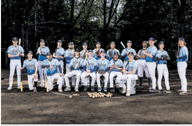
Thamen komt na verlenging tekort tegen RCH-Pinguïns.