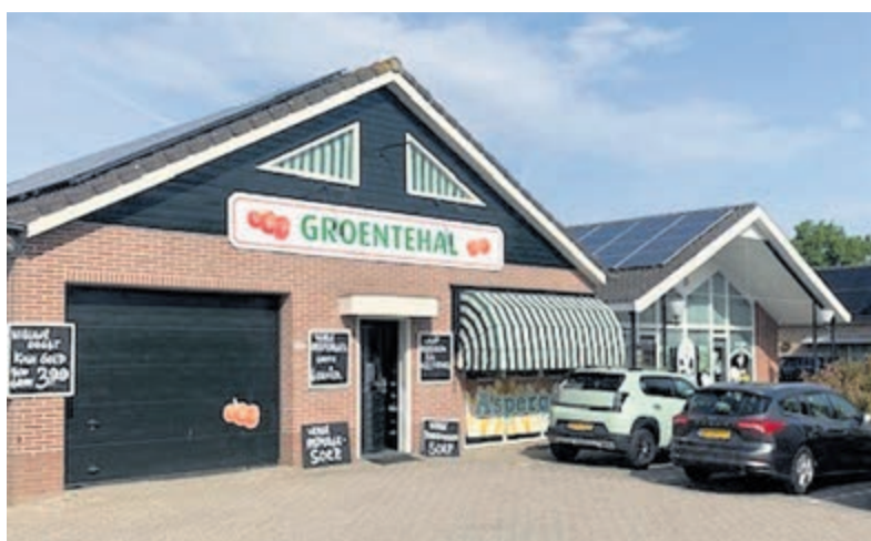
De Groentehal en poelier De Haan aan Demmerik zijn nu optimaal bereikbaar.

Hoewel de overlast volgens de gemeente noodzakelijk was om de brug voor de komende jaren veilig en toekomstbestendig te maken, laat de periode zien hoe kwetsbaar lokale ondernemers zijn bij langdurige afsluitingen. De heropening van de Heulbrug betekent daarom meer dan alleen een betere bereikbaarheid: het markeert voor de ondernemers aan Demmerik vooral het begin van herstel en hernieuwde bedrijvigheid.