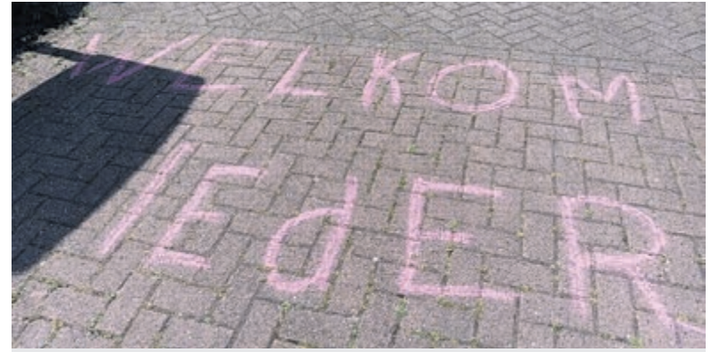
De kleurrijke stoepkrijtactie van het VluchtelingenWerk Uithoorn werd voortijdig beëindigd door ingrijpen van de gemeente.

Na het officiële programma volgde een fotomoment met zowel actieve leden als oudgedienden. De reünie werd voortgezet in informele sfeer, waar ervaringen en herinneringen werden uitgewisseld. De dag werd afgesloten met een gezamenlijke barbecue.