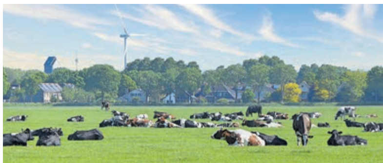
Uitstel voor stikstofzones.

Het uitstel betekent volgens de provincie niet dat de ambities worden afgezwakt. De stikstofuitstoot moet nog steeds fors omlaag om kwetsbare natuur te beschermen. Utrecht blijft daarom inzetten op een combinatie van natuurherstel en een toekomstbestendige landbouwsector. "Alleen het tempo wordt aangepast", laat de provincie weten.