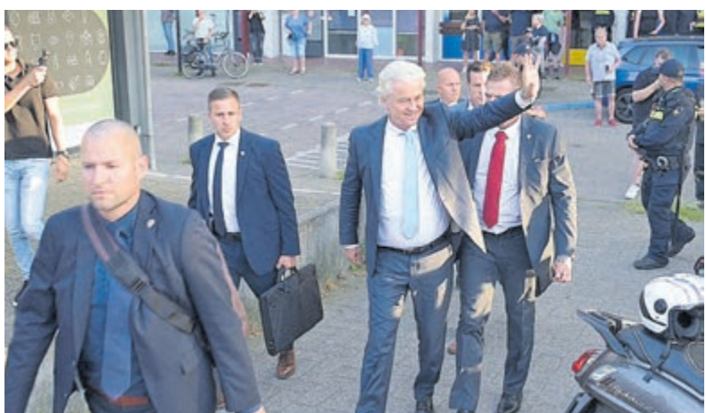
Geert Wilders, die zichtbaar opgewekt arriveerde om de demonstranten toe te spreken.