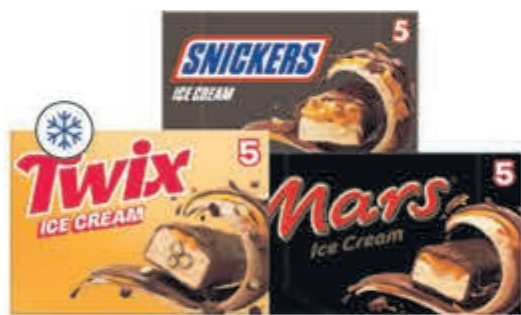
Alle Mars, Snickers of Twix ijsrepen

OPEN NU DE JUMBO APP EN PAK JOUW AANBIEDINGEN VAN DEZE WEEK UIT