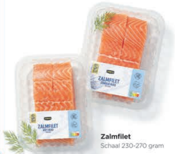
Zalmfilet Schaal 230-270 gram