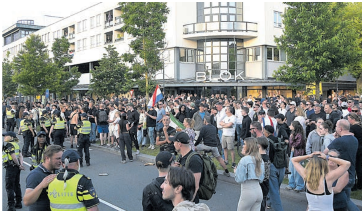
De politie was grootschalig aanwezig om de demonstratie in goede banen te leiden.