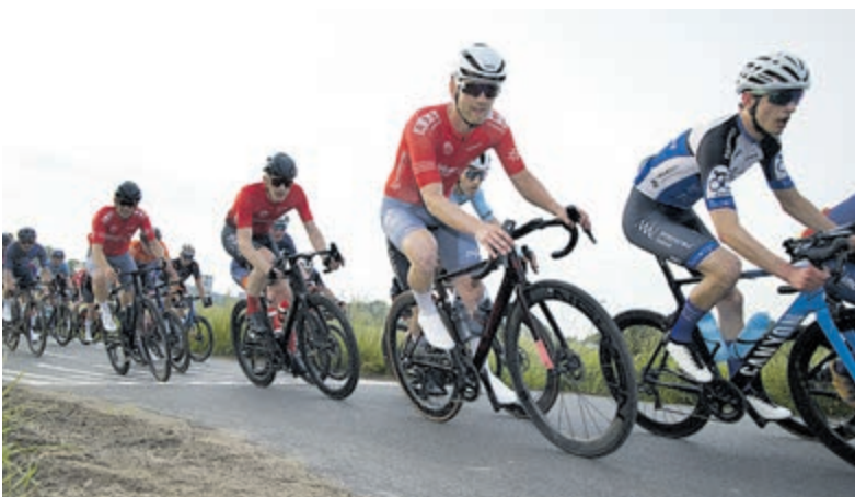
Concentratie bij het nemen van de bocht op de Nesserlaan.