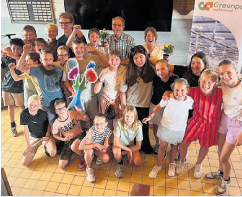
RKBS De Zon uit De Kwakel winnaar van de regionale Tuinbouw Battle 2026.