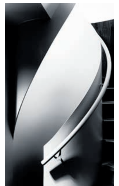
Donker licht.

bovendien opvallen tussen de circa 1.300 inzendingen. De reguliere kringavonden dragen bij aan de ontwikkeling van de fotografen. Door het tonen en bespreken van foto's en het geven van opbouwende feedback wordt het niveau verhoogd. Daarnaast werkt het gezamenlijke bekijken van werk inspirerend. Meer informatie over de fotokring en de ingezonden foto's is te vinden op www.fotokringuithoorn.nl .