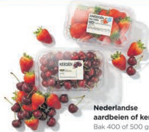
Nederlandse aardbeien of kersen Bak 400 of 500 gram