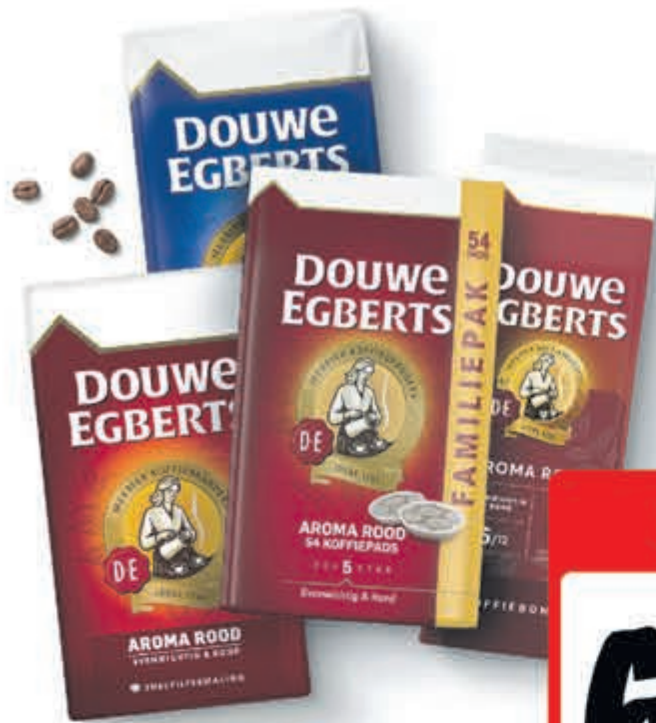
Douwe Egberts Aroma Rood of Decafé Alle pakken snelfiltermaling of bonen à 500 gram, zakken à 54 pads of oploskoffie potten à 200 gram