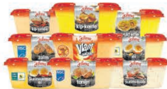
Johma salades Alle bakjes à 175 gram