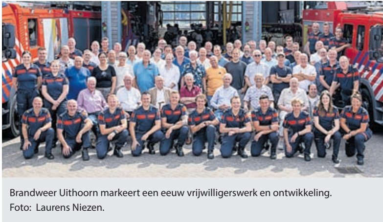
Brandweer Uithoorn markeert een eeuw vrijwilligerswerk en ontwikkeling.