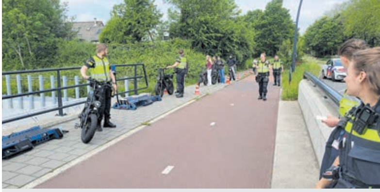
Gemeente Uithoorn en de politie hebben recent gezamenlijk een gerichte controle uitgevoerd op fatbikes.