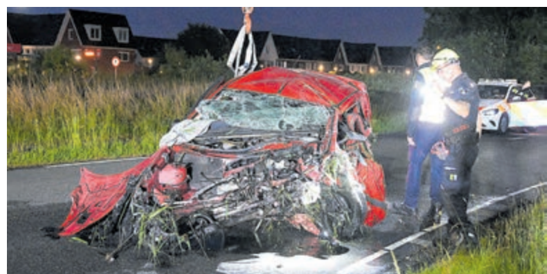
Het zwaargehavende voertuig na takeling uit het water.