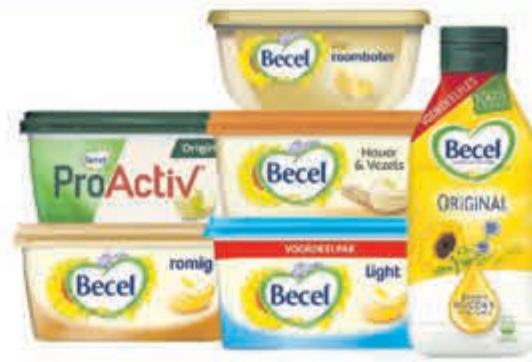
Becel Alle kuipen à 400-550 gram of flessen à 750 ml