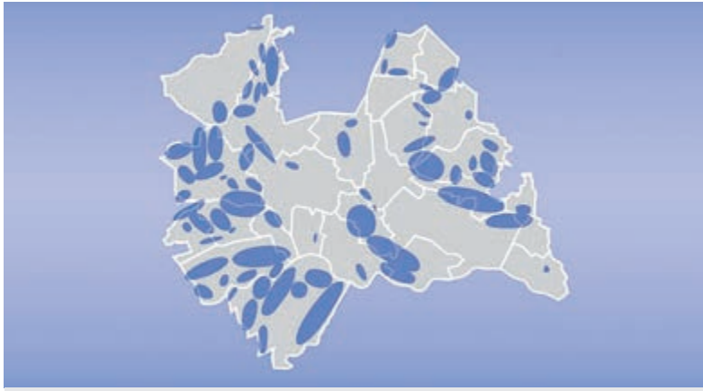
Potentiële onderzoeksgebieden windenergie Provincie Utrecht.