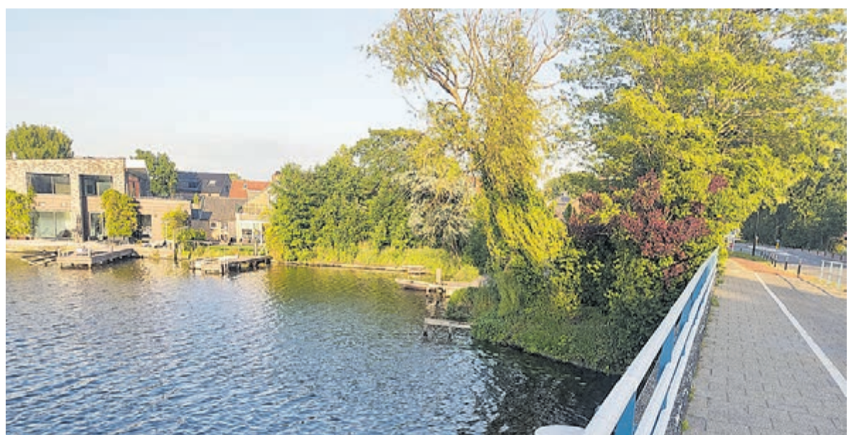
Op de foto rechts zou in plaatst van de bomen een hoog appartementencomplex moeten verschijnen