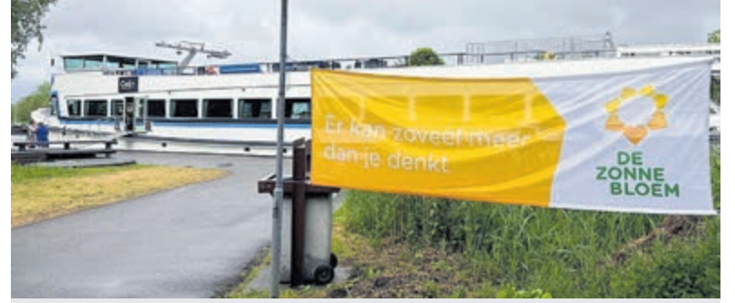
Met de Nirvana het water op.