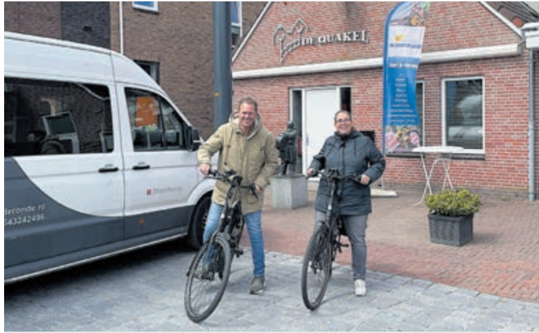
Vanuit De Kwakel werd de 45 km-tocht richting Alphen aan de Rijn gereden.