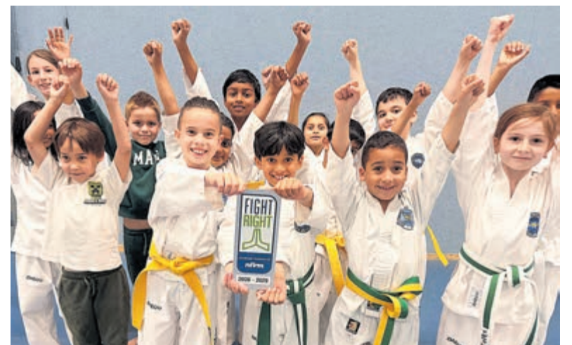
Sportschool Chung Do Kwan heeft opnieuw het officiële Fight Right Keurmerk ontvangen.

Dat de aanpak van Chung Do Kwan aanslaat, blijkt volgens de school ook uit eerdere erkenningen. De vereniging werd vijf keer uitgeroepen tot Vereniging van het Jaar, won de provinciale titel van Noord-Holland bij de Rabobank Clubkas Campagne en bracht tijdens het WK in Italië in oktober 2025 meerdere wereldkampioenen voort binnen de speciale sectie. "Het voortdurend blijven verbeteren en kritisch blijven kijken naar je organisatie zorgt ervoor, dat de kwaliteit ieder jaar weer omhoog kan", besluit Chung.