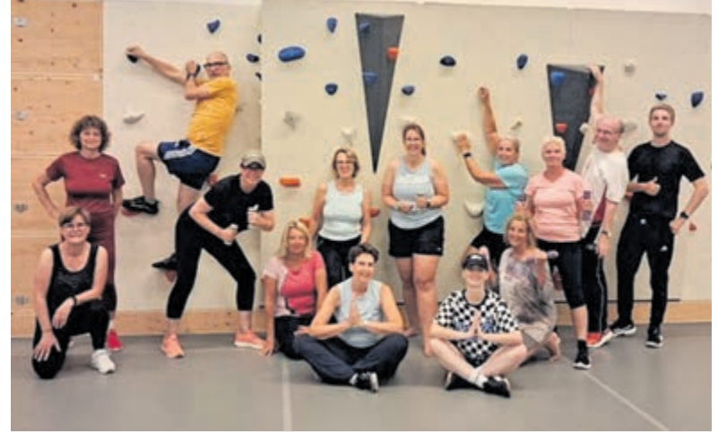
Bestuur en leden verwelkomen graag leden en oud-leden.