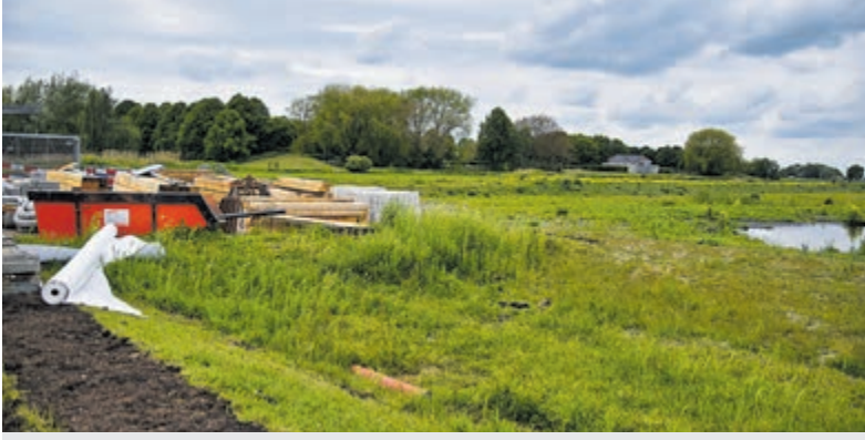
Vuilstort in de natuur.