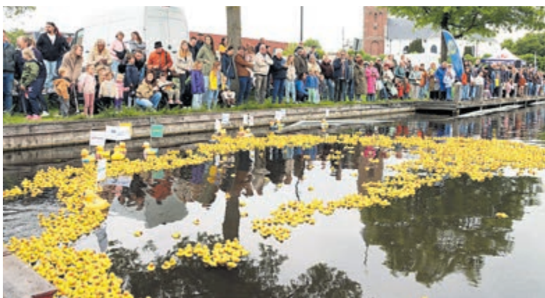
Duizenden badeendjes trotseren wolken en stroming voor Stichting Leergeld.