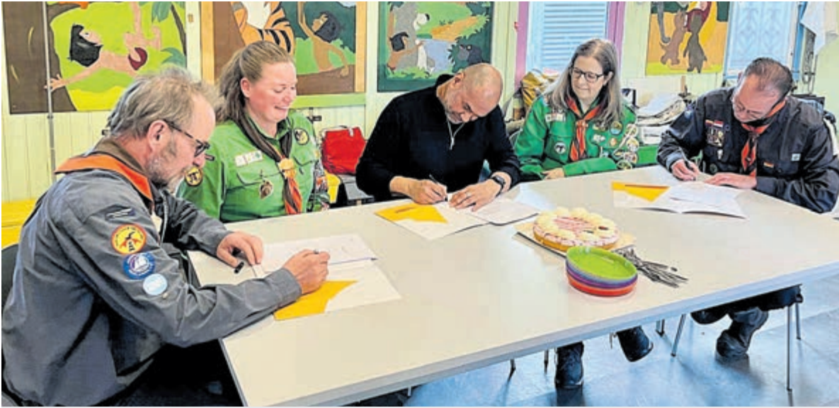
Gemeente Uithoorn en Scouting Admiralengroep Uithoorn tekenen de samenwerkingsovereenkomst en afsprakenbrief.