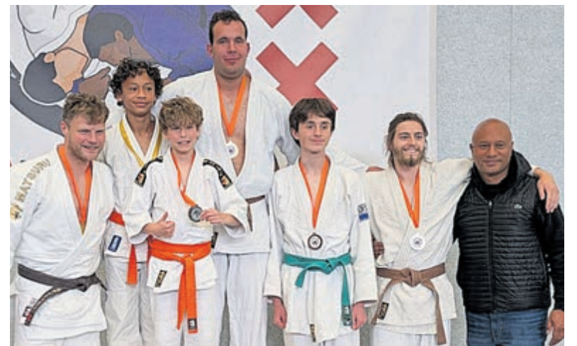
Met meerdere eerste, tweede en derde plaatsen kan judoschool Blaauw terugkijken op een geslaagde dag in Amsterdam.