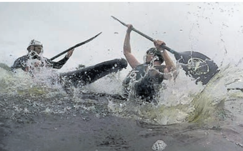
Spektakel op het water.

De vijf thuisheren van Michiel de Ruyter zorgden intussen voor indrukwekkende prestaties. Vooral de beginners deden het verrassend goed met een vierde plek op hun allereerste toernooi. Ook MDR 3 kwam heel dichtbij het brons, maar verloor uiteindelijk van de Black Merlies uit Singapore. In de hoofdklasse bleek MDR Legends de grote verrassing te zijn. Het team voloudigdienden verloor de halve finale maar zette vervolgens een zinderende strijd neer om de derde plek. Viking Venlo – vorig jaar nog kampioen – werd met 4-3 verslagen. Minstens zo spannend was de finale tussen Liblar (Keulen) en de Belgische heren. Het publiek kreeg een doelpuntenfestijn te zien, waarbij Liblar uiteindelijk aan het langste eind trok met 5-4.