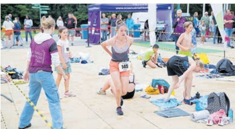
Scholieren Zwemloop Challenge uitdaging voor Uithoornse scholieren.

ook dit jaar zaterdag 13 juni weer laten zien wat ze kunnen rondom Zwembad de Waterlelie. Bij de Zwemloop Challenge, georganiseerd