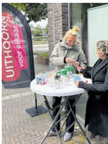
Inloop 'Gewaardeerd & Gezien' brengt inwoners samen in Uithoorn.

Uithoorn - Bij Winkelcentrum Zijdelwaard vond afgelopen week een ontmoeting plaats rond de inloop Gewaardeerd & Gezien. Medewerkers en deelnemers van de wijkpost gingen daar in gesprek met voorbijgangers om aandacht te vragen voor deze laagdrempelige ontmoetingsplek. Met koffie en informatiemateriaal werden inwoners uitgenodigd om kennis te maken met het initiatief. De inloop is bedoeld voor inwoners die behoefte hebben aan contact. Daarbij richt de voorziening zich onder meer op mensen met een mentale kwetsbaarheid, maar ook op inwoners die zich eenzaam voelen of moeite hebben om nieuwe contacten te leggen. De toegang is gratis en de sfeer informeel.