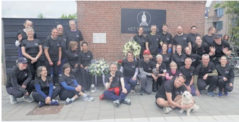
Het vreugdevuur naar Uithoorn.

Uithoorn - Bij Legmeervogels in Uithoorn was Ria Storm de laatste keer derde geworden met klaverjassen en had dus de slag te pakken; ze was dit keer de beste van iedereen met 7.271 punten. Kees Kooijman eindigde tweede met 6.927 punten en de derde plaats was met 6.736 punten voor Ineke Plasmeijer. De poedelprijs was deze keer voor Marco Huel met 5.109 punten. Aanstaande vrijdag 22 mei is de volgende klaverjasavond, inschrijven vanaf 19.30 en om 20.00 wordt gestart. Het eerste kopje koffie of thee is gratis en de auto mag bij de kantine worden geparkeerd. Komende 5 juni wordt er niet gekeerd in verband met de aankomst van de Avondvierdaagse-wandelaars in de kantine op de laatste avond van het evenement.