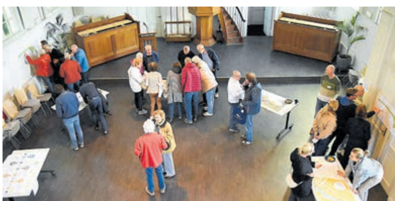
Aanwezigen namen uitgebreid de tijd om de plannen te bestuderen.

Ook konden aanwezigen aangeven of zij op de hoogte willen blijven van de verdere ontwikkelingen. Volgens de organisatie worden alle reacties meegenomen in de verdere evaluatie van de avond en bij de uitwerking van de plannen. De bijeenkomst bood inwoners niet alleen de kans om de ontwerpen van dichtbij te bekijken, maar ook om actief mee te denken over de toekomst van het gebied rond de Wilhelminakade en de Thamerkerk. Verschillende aanwezigen namen uitgebreid de tijd om de tekeningen en plannen te bestuderen en met elkaar van gedachten te wisselen over de mogelijkheden voor het gebied.