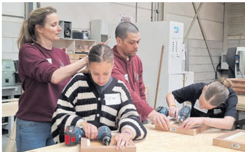
Meiden aan de slag bij technische bedrijven tijdens Girls'Day.