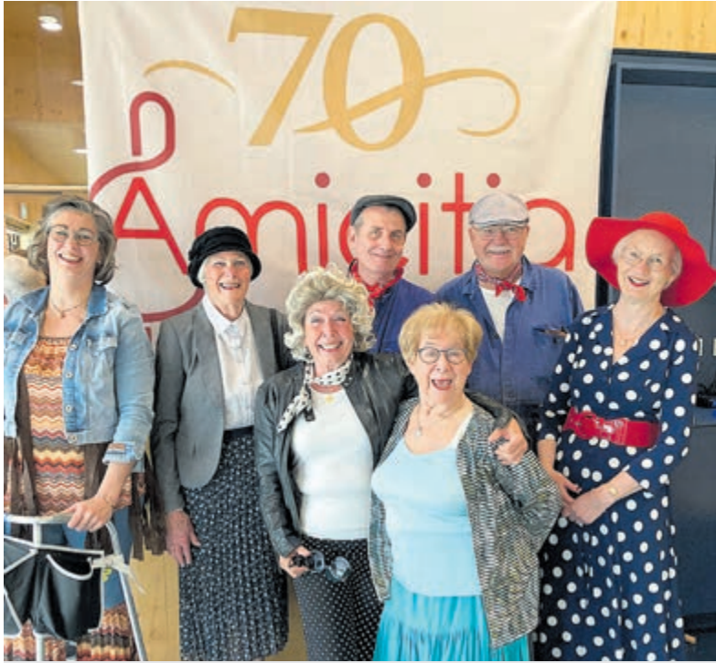
De enthousiaste jubileumcommissie in verzochte kledij.