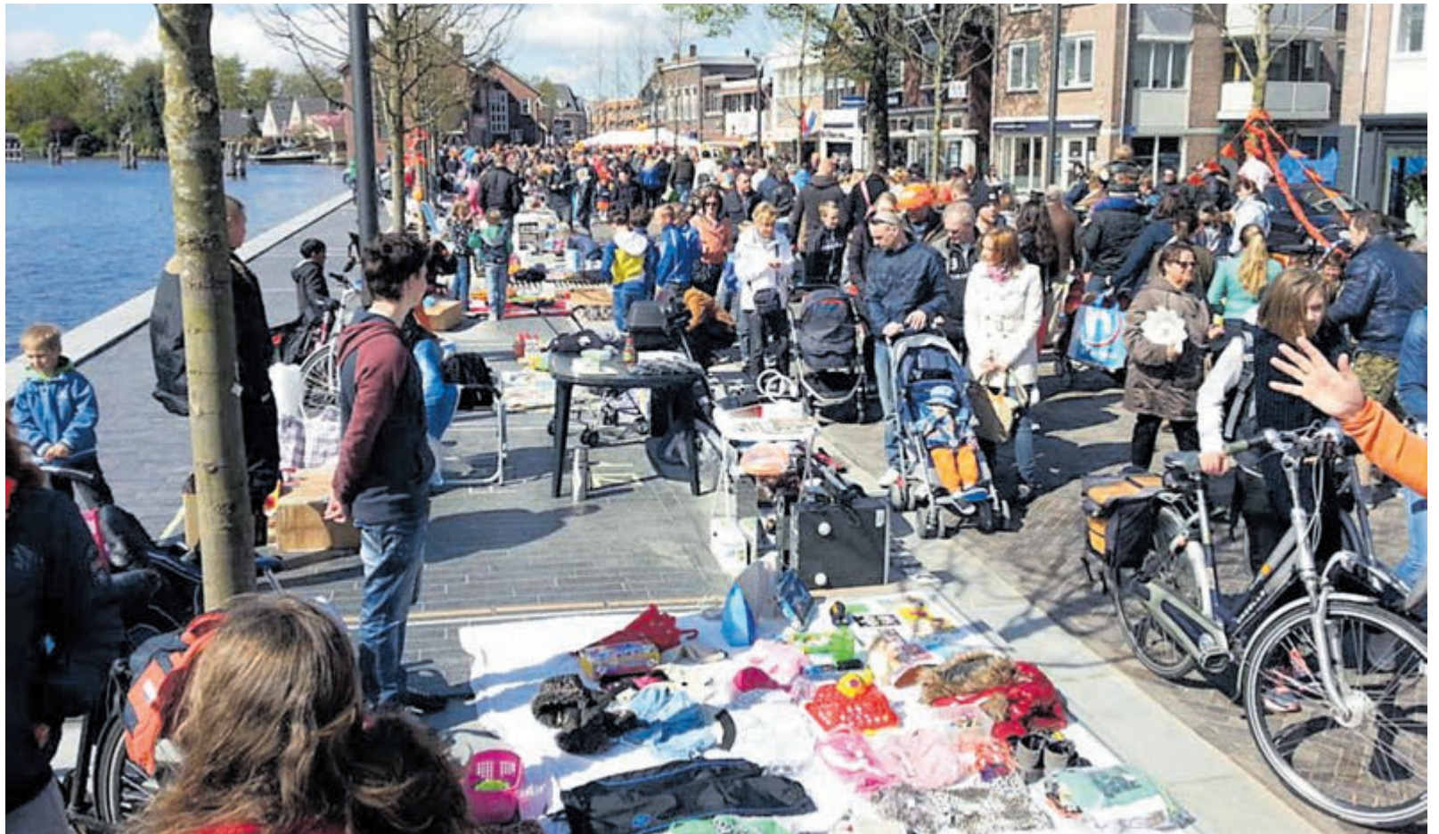
Koningsdag in hartje Uithoorn.

Ontdek hoe de wereld rookvrij wordt op rookvrij.nl