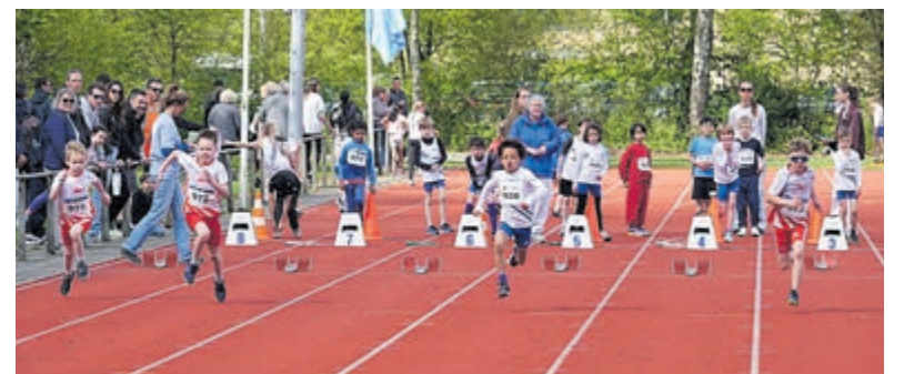
Veel persoonlijke records voor jonge AKU-atleten.