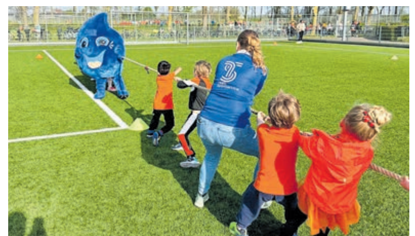
Leerlingen van bijna alle basisscholen deden mee aan een feestelijke en sportieve ochtend.

Met de Koningsspelen werd daarbij niet alleen het belang van bewegen benadrukt, maar ook dat van samen plezier maken, elkaar ontmoeten en werken aan een gezonde toekomst voor alle kinderen.