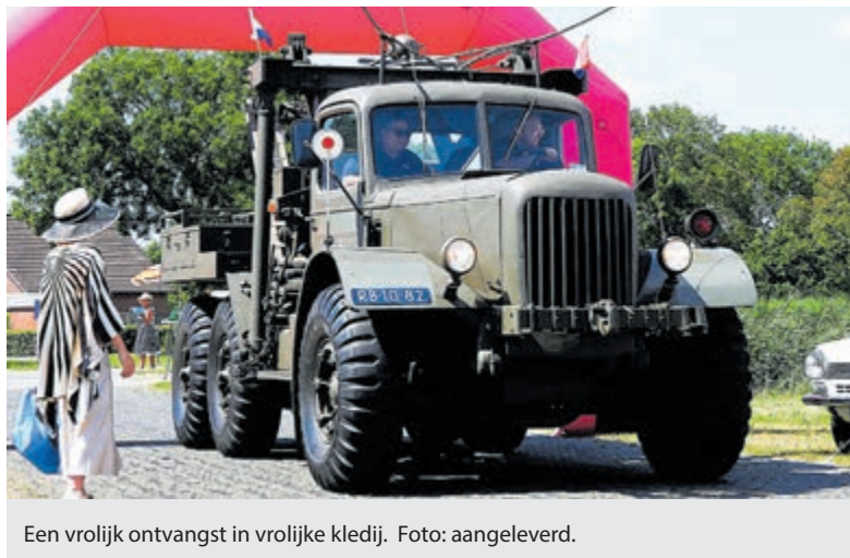
Een vrolijk ontvangst in vrolijke kledij.

wagens, motorfietsen en brommers, variërend van 25 tot meer dan 100 jaar oud. Ze worden traditiegetrouw ontvangen door gastvrouwen in feestelijke jurken een detail dat inmiddels net zo karakteristiek is als de voertuigen zelf. Met het uitgebreid food-court, muziek, countryline dance demo's en diverse kraampjes wordt het opnieuw een échte familiemiddag.