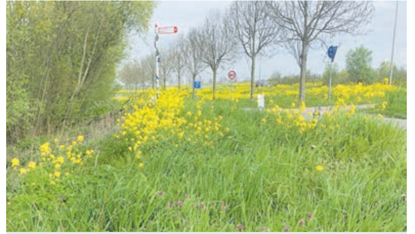
Waar de lente het asfalt verslaat.

Mijdrecht krijgt 28 juni nog een keer de kans om het verleden te zien, horen en ruiken, rollend, glimmend en liefdevol onderhouden. Wie het nog nooit meemaakte, moet dit moment aangrijpen. En wie er al vaker was, weet: sommige tradities zijn te mooi om te laten verdwijnen.