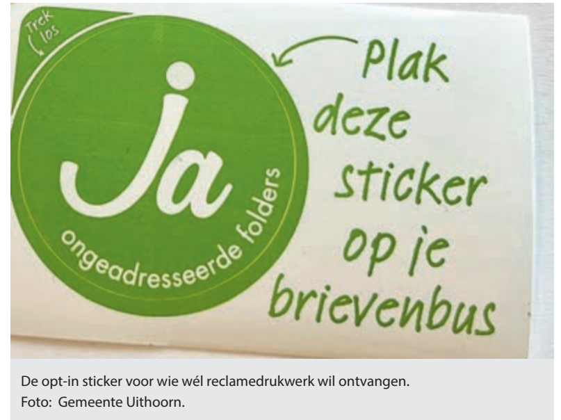
De opt-in sticker voor wie wél reclaimedrukwerk wil ontvangen.

welkom om hun gelezen boeken of gelegde puzzels een tweede leven te geven en zelf weer nieuwe te ontdekken. De boekenruilbeurs sluit mooi aan bij de Wereldboekendag, die een dag eerder plaatsvindt. Dit internationale initiatief werd in 1995 door Unesco in het leven geroepen om lezen te promoten. Bezoekers mogen een of maximaal acht boeken meenemen om te ruilen. Dankzij gulle gevers is er al een mooie voorraad om uit te kiezen. Naast het ruilen is er ook ruimte om andere lezers en puzzelaars te ontmoeten.