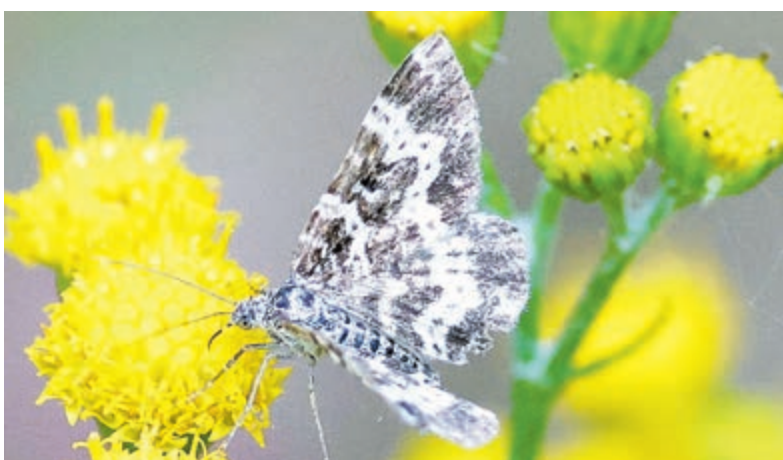
Ontdek nachtvlieders.

laten ervaren hoeveel biodiversiteit zich letterlijk op een paar vierkante meter afspeelt. Geen verre natuurgebieden, geen ingewikkelde excursies, maar gewoon: de eigen achtertuin. De kern van het project is een eenvoudige, maar effectieve ledemmer, die enkele nachten per deelnemer in de tuin staat. Het zachte licht trekt nachtvlieders aan, die de volgende ochtend kunnen worden gefotografeerd en weer vrijgelaten.