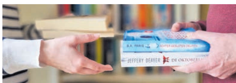
Boeken en puzzelruilbeurs in De Kuyper.

boeken- en puzzelruilbeurs georganiseerd. Tussen 16.0 en 17.30 uur zijn boekenliefhebbers en puzzelaars