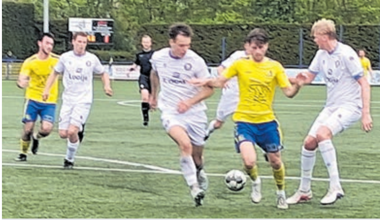
Legmeervogels laat zege glippen.