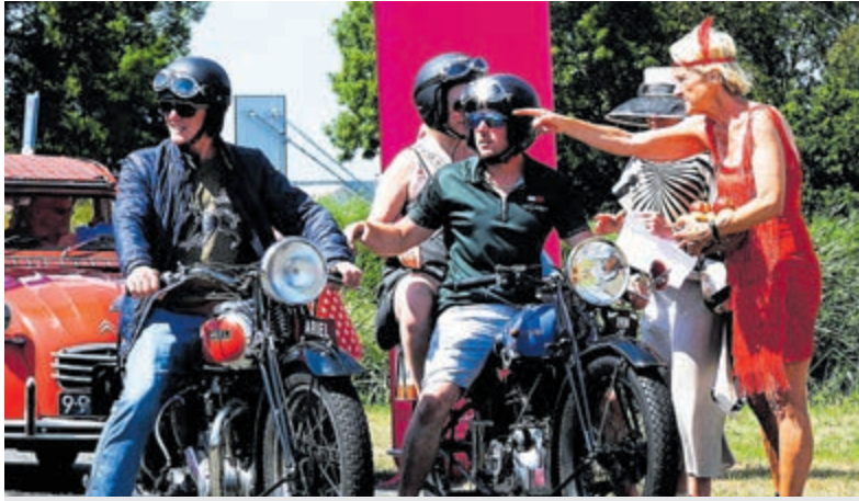
Klassieke motoren en auto's wordt de weg gewezen.