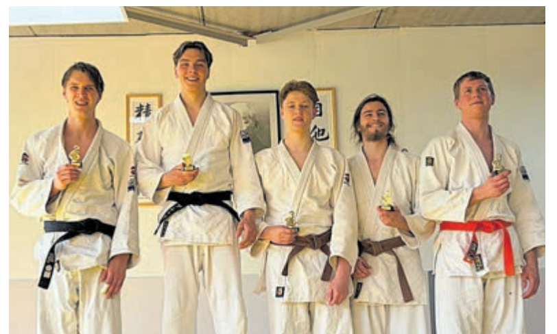
De clubkampioenen gehuldigd.