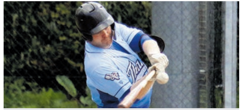
De honkballers van Thamen Uithoorn zijn het seizoen in de eerste klasse wisselend begonnen.