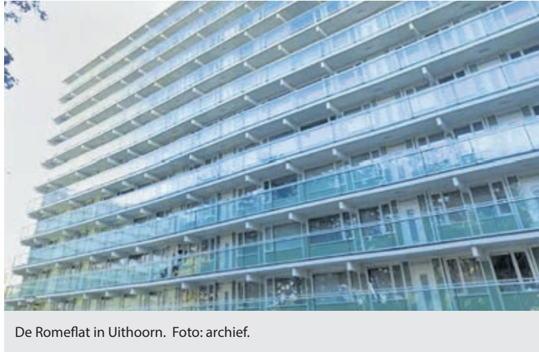
De Romeflat in Uithoorn.