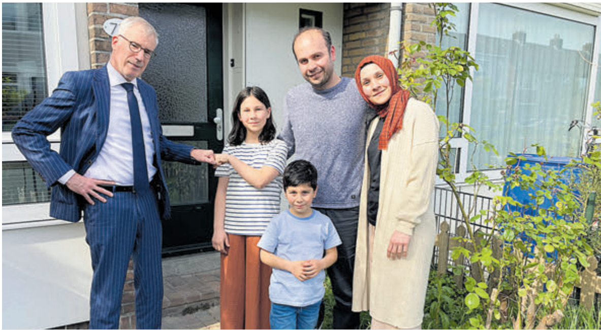
Burgemeester Heiligeers bokst de familie moed in op hun tijdelijke woonadres.