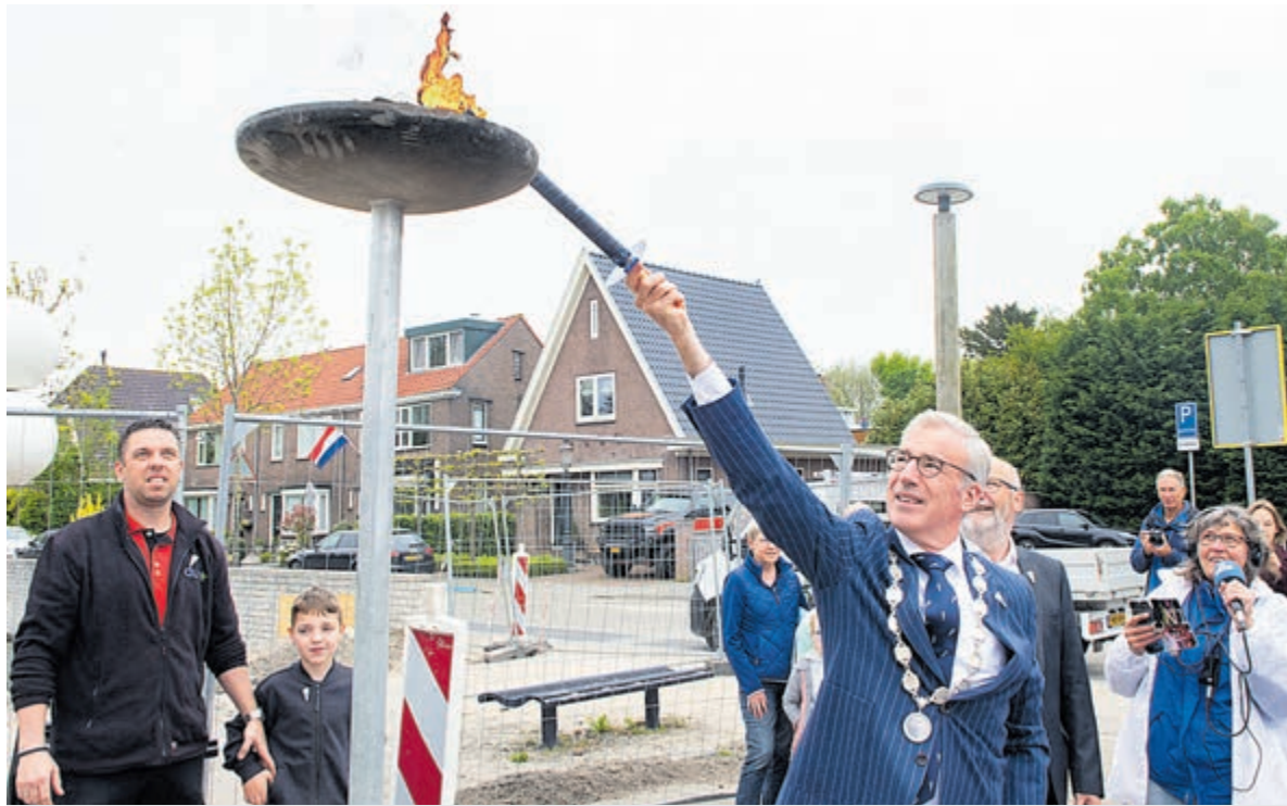
Ontsteking van het bevrijdingsvuur voor gemeentehuis Uithoorn