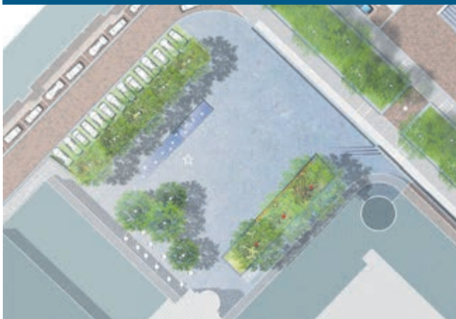
Een van de basisontwerpen voor het Amstelplein

Datum: maandag 6 mei 2024 Tijdstip: 19.30 tot 22.00 uur Locatie: gemeentehuis Uithoorn Meer informatie: www.uithoorndenktmee.nl