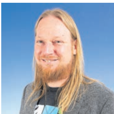
Albers (Groen Uithoorn): Dit is de laatste keer!