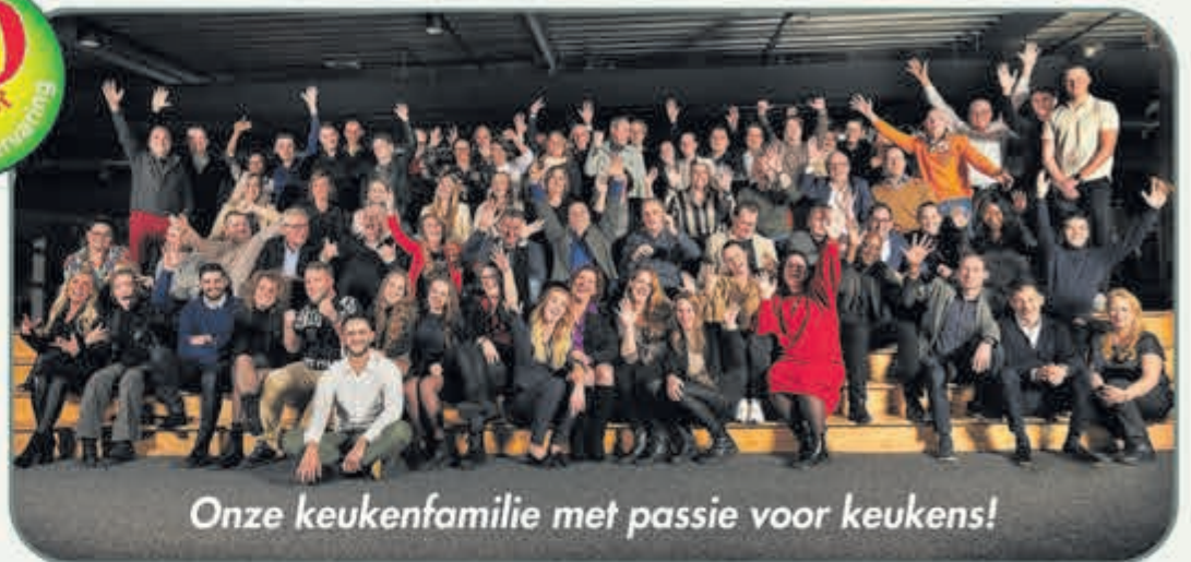
Onze keukenfamilie met passie voor keukens!

Bij Keukenwarenhuis.nl is op uw gemak zelf oriënteren nog mogelijk! Alle keukens in de showroom staan compleet en netto geprijsd, zodat u zelf vrijblijvend kunt beslissen of u een ontwerp wilt laten maken of, indien u zover bent, een complete offerte!