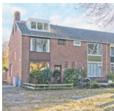
Nicolaas Beetslaan 104 Uithoorn