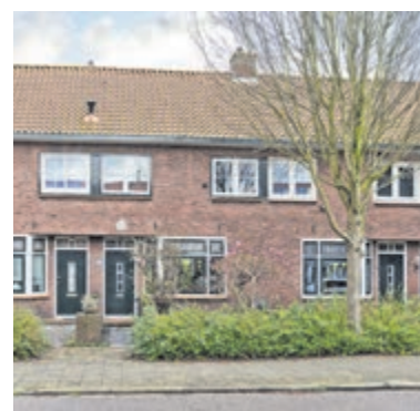
Sportlaan 72 Aalsmeer