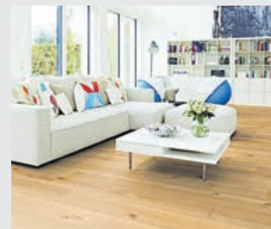
Vloeren & Traprenovatie