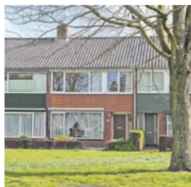
Willem-Alexanderstraat 55 Aalsmeer