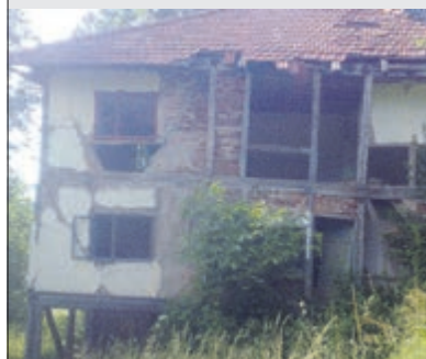
Hergebruik van oud eikenhout! Van oud gebouw naar origineel meubel naar eigen ontwerp!!