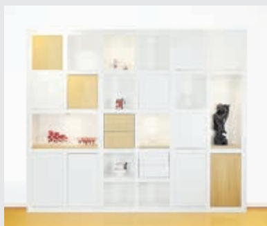
Meubelen op maat in alle vormen, kleuren en maten!