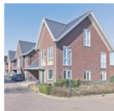
Linksbuitenstraat 39 Kudelstaart