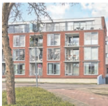
Gerberastraat 35 Aalsmeer