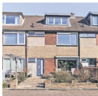
Mendelstraat 96 Aalsmeer