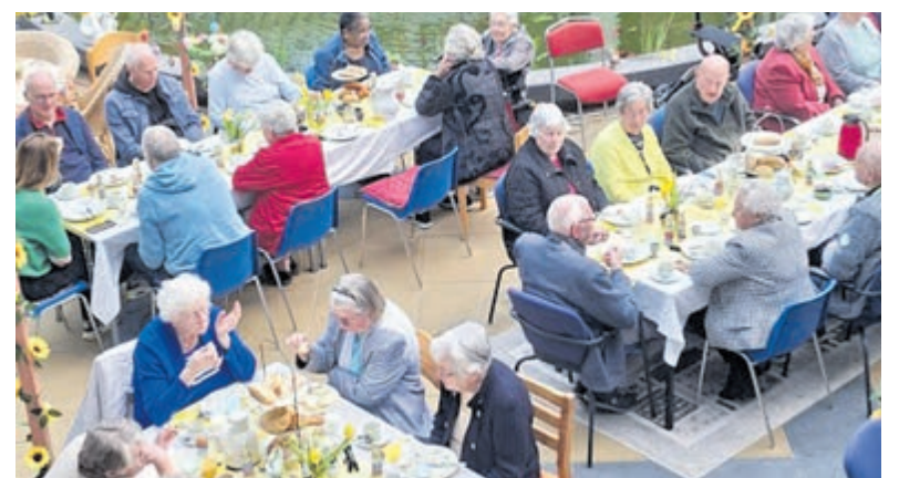
De bewoners van wooncomplex De Wildenborch genoten 1 april opnieuw van een rijk gevulde en feestelijke paasbrunch.

De brunch smaakte duidelijk naar meer, want onder de aanwezigheid werd alweer nieuwsgierig gevraagd naar het volgende evenement. De bewonerscommissie laat weten, dat er opnieuw mooie activiteiten in het verschiet liggen.