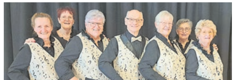
Recreatief sjoelen wegens succes verlengd.

die op maandagmiddag van 13.30 uur tot 16.00 uur, met uitzondering van de feestdagen, een steentje willen gooien. Er zijn voldoende sjoelbakken aanwezig. Aanmelden is niet nodig. De inloop is vanaf 13.00 uur en de kosten zijn 5 euro per persoon per keer.