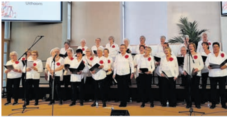
Meezingkoor Uithoorn heeft ruimte voor enthousiaste zangers en zangeressen.

Ontdek hoe de wereld rookvrij wordt op rookvrij.nl