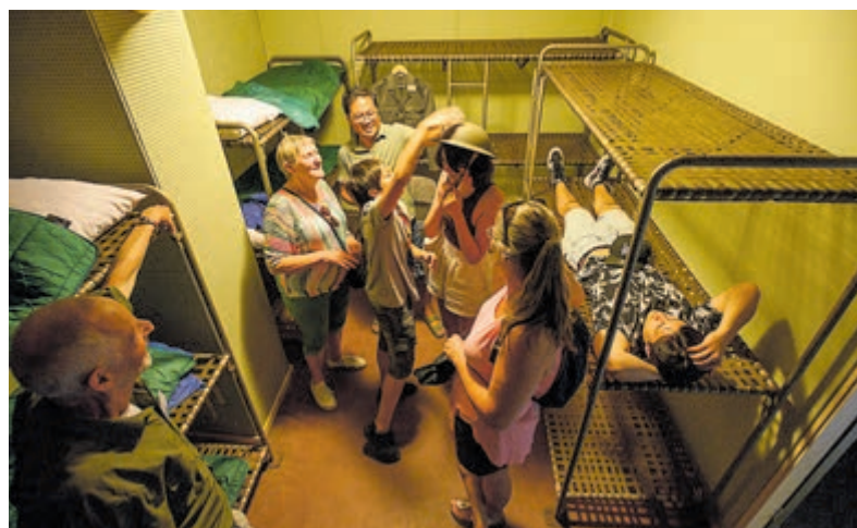
Bij Roeleveld & Bos in Mijdrecht werd direct flink gesleuteld.

Zondag 12 april start onze allereerste rondleiding van het jaar door Fort Waver-Amstel. Een authentiek fort waar de tijd heeft stil gestaan. Veel elementen van vroeger zijn bewaard gebleven. In het gebouw zie je oude wasruimten, elektrakasten en een oude keuken. Ook het waterreservoir, waterpomp en de sanitaire voorzieningen liggen er nog precies zo bij als vroeger. Geen ticket voor deze rondleiding kunnen bemachtigen? Geïnteresseerden zijn zondag 12 april van 10.00 tot 17.00 uur toch welkom om een rondje buitenom de kazerne van Fort Waver-Amstel te wandelen. Aan de hand van de informatieborden maak je kennis met het verhaal van het fort. Meer informatie: www.nm.nl/fortenvechtplassen .