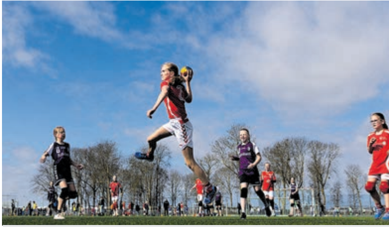
De handballers in actie.