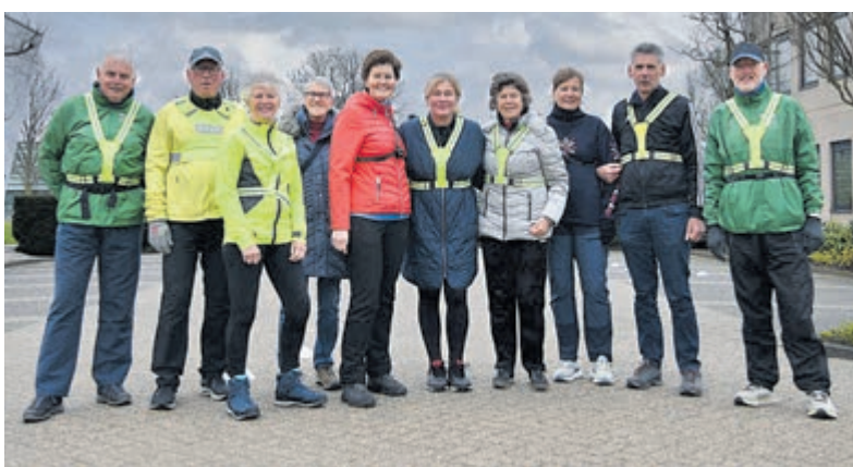
Aan het einde van de avond poseerden zowel de wandelaars als de hardlopers trots en met plezier voor een groepsfoto.