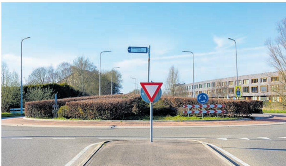
Rotonde bij het Gezondheidscentrum aan de Maximalaan-Faunalaan.

Zo kunnen we de werkzaamheden goed voorbereiden en de natuur zo veel mogelijk beschermen.