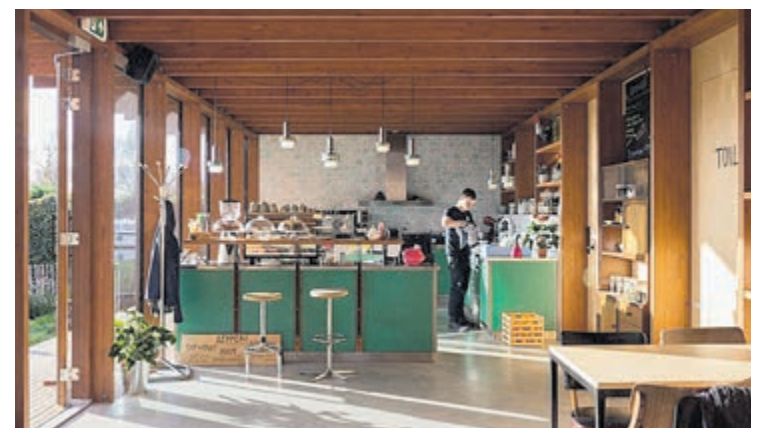
IVN-wandeling zondag 12 april vanaf Koffiehuis De Goede Morgen.