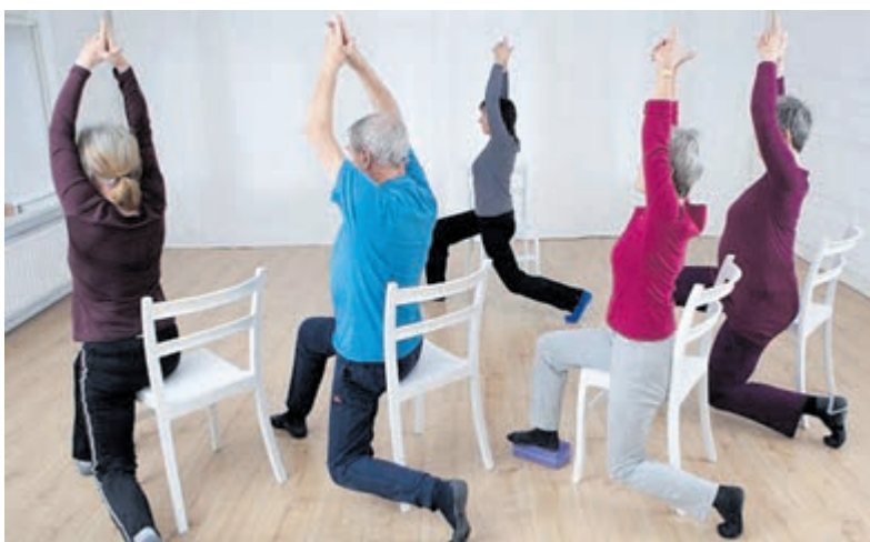
Stoelyoga bij 'Uithoorn voor Elkaar'.

Het is belangrijk om zelf zo lekker mogelijk in je vel te blijven zitten, zodat je de zorg voor je naaste