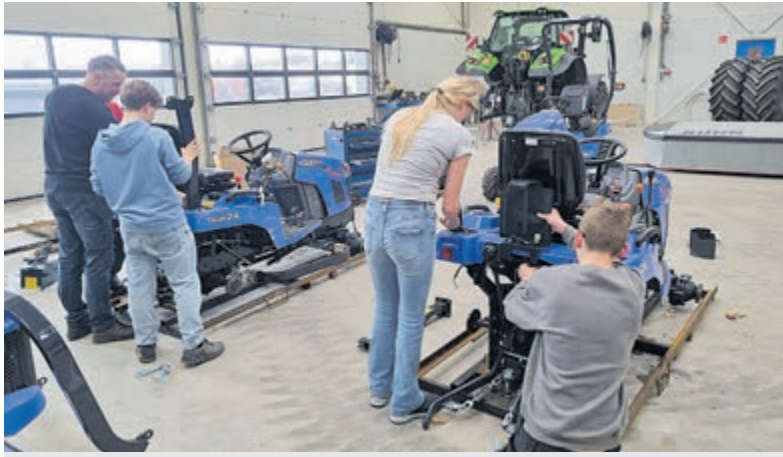
Bij Roeleveld & Bos in Mijdrecht werd direct flink gesleuteld.