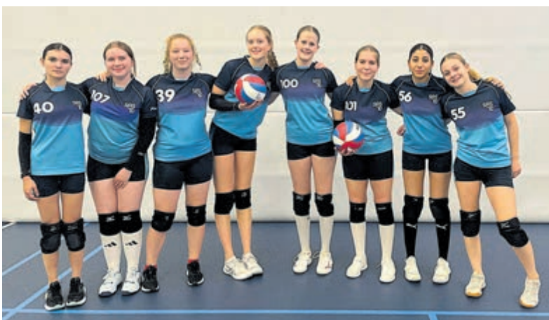
SAS'70 start nieuwe instroomgroep volleybal.

Uithoorn - Volleybalvereniging SAS'70 is een groeiende club. De trainingsgroepen voor jeugd van 12 tot 18 jaar zitten erg vol en met vijf deelnemende jeugdteams in de competitie is er sprake van een actieve jeugd afdeling. In april is gestart met een nieuwe jeugdinstroomgroep. De trainingen zijn op de woensdagen van 17.30 tot 18.30 uur in de Scheg. In deze groep trainen zowel jongens als meiden. Ook kennismaken? Stuur een mailtje naar jeugd-voorzitter@sas70.nl. Bij SAS'70 mag je drie keer meetrainen om te kijken of deze sport bij je past. Voor de jeugd van 6 tot en 12 jaar is ook nog ruimte. Zij trainen op de dinsdagen van 17.00 tot 18.00 uur. De zaaltrainingen gaan door tot en met de maand mei.