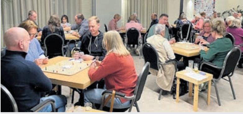
Het Dorpshuis was weer ouderwets drukbezocht voor het jaarlijkse Keeztoernooi.