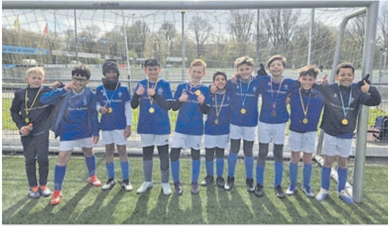
Argon JO11-3 trotse kampioen. Op de foto ontbreekt Jamie Post.