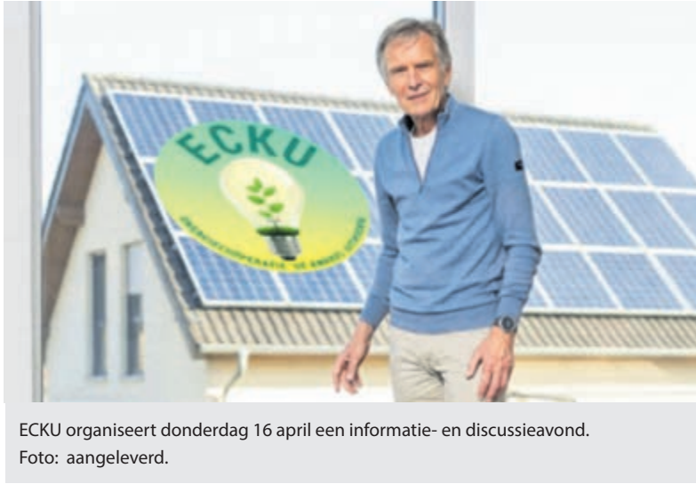
ECKU organiseert donderdag 16 april een informatie- en discussieavond.