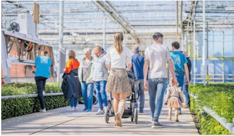
Iedereen is welkom tijdens Kom in de Kas.