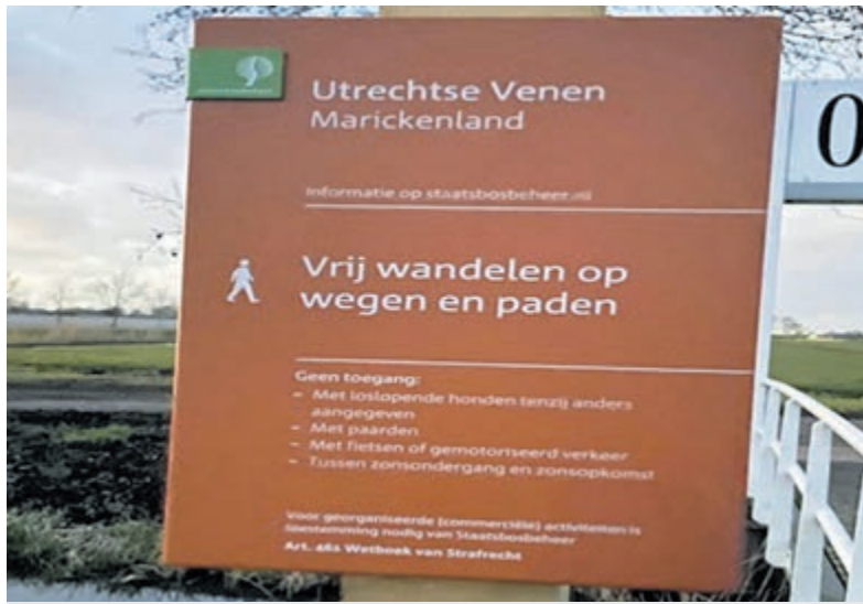
Borden met nieuwe regels zorgen opnieuw voor discussie op historisch wandelpad.