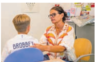
Inlooppreekuur in Uithoorn voor vaccinaties.

laam 30D in Uithoorn. Op deze dagen is het inlooppreekuur: 12 mei van 16.00 tot 16.30 uur, 26 mei van 16.00 tot 16.30 uur, 9 juni van 16.00 tot 16.30 uur, 23 juni van 16.00 tot 16.30 uur en 7 juli van 16.00 tot 16.30 uur. Meer informatie: www.ggd.amsterdam.nl/vaccineren of bel met 020 - 555 5961.