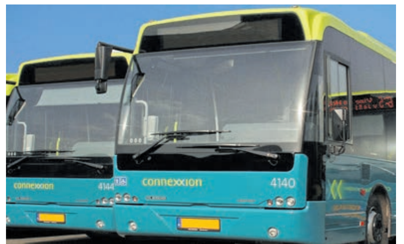
Kinderen tot en met 11 jaar gratis mee in de Connexion-bussen.

het openbaar vervoer te gebruiken. Kinderen die op jonge leeftijd vertrouwd raken met busvervoer, zouden dat later vaker blijven doen. De Vervoerregio financiert de regeling volledig. Vanaf 1 april 2026 kunnen ouders of begeleiders die een geldig vervoerbewijs hebben, in de bus een gratis kinderkartje aanvragen. Per betalende volwassene mogen maximaal vier kinderen van 4 tot en met 11 jaar gratis meereizen. Kinderen onder de 4 jaar reizen al gratis mee. Het kinderkartje is uitsluitend verkrijgbaar bij de buschauffeur. Het gratis kinderkartje is geen permanente regeling. Het is bedoeld als tussenstap richting het landelijke product Kidsvrij, waarmee kinderen in de toekomst in heel Nederland gratis kunnen meereizen met een betalende volwassene. Wanneer Kidsvrij landelijk wordt ingevoerd, vervalt de regionale regeling automatisch.