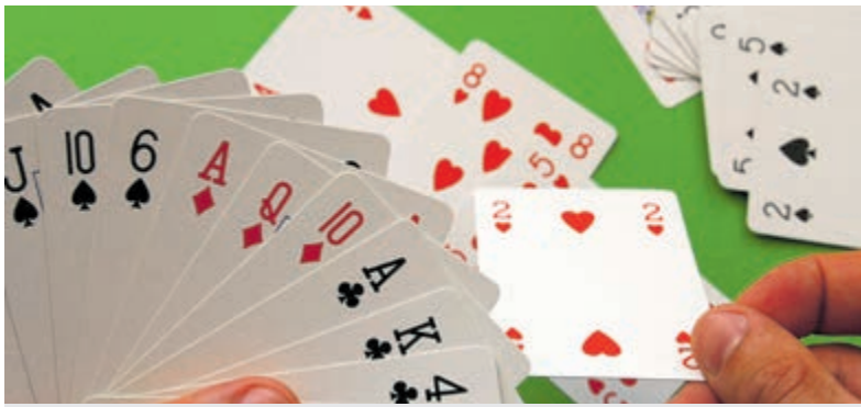
Derde zitting van de vijfde competitieronde in drie lijnen.

Meer informatie over bridgen bij BVU: Kees Visser, 06 - 5317 5165 of kees.visser55@kpnplanet.nl.