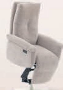
Sta-op stoel Maratea