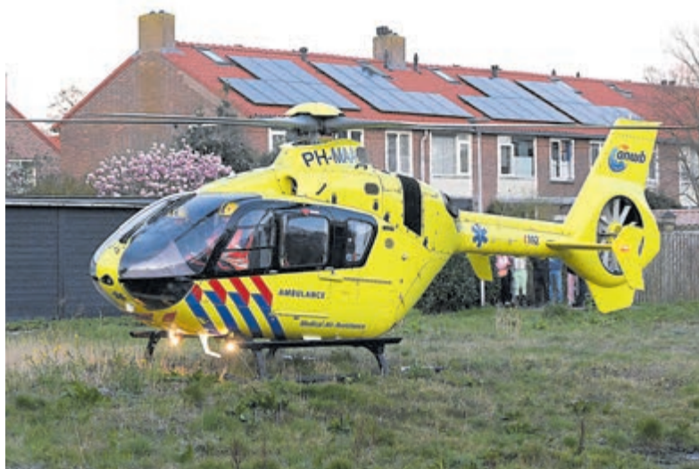
Traumahelicopter landt in woonwijk.

Uithoorn - In verband met een medische noodsituatie in een woning aan de Admiraal de Ruyterlaan in Uithoorn is vrijdagmiddag rond 18.00 uur een traumahelicopter geland op het braakliggende gedeelte aan de Prinses Christinalaan. De politie heeft met zwaailicht en sirene de noodarts en verpleegkundige naar de woning gebracht. Daar waren ook al twee ambulances en de brandweer aanwezig. Waarom de heli werd ingezet wordt vanwege privacy niet bekend gemaakt. Het landen en weer opstijgen van de helikopter trok veel bekijks.