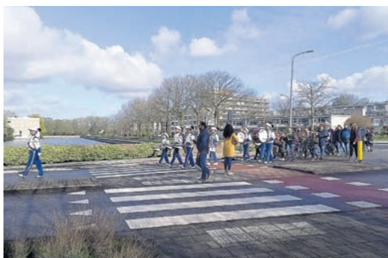
Onder muzikale begeleiding lopen de kinderen in een kleurrijke stoet vanaf de protestantse kerk naar het Karel van Manderhof. Ook mensen zonder palmpaasstok mogen natuurlijk mee.

Optocht Zondagochtend 29 maart start de dag om 09.30 uur in De Schutse, De Mérodelaan 1. Onder muzikale begeleiding lopen de kinderen in een kleurrijke stoet vanaf de protestantse kerk naar het Karel van Manderhof. Ook mensen zonder palmpaasstok mogen natuurlijk mee. Na een half uur lopen, is het tijd voor koffie, thee en natuurlijk limonade in het Karel van Manderhof. Aansluitend is de inwijding van de palmpaasstokken op het plein voor Gerrit en om 11.00 uur een viering met kinderwoorddienst in De Burght. De palmpaasoptocht is een samenwerking tussen de protestantse kerk De Schutse en de katholieke kerk De Burght en wordt al sinds 2004 georganiseerd. Er hangen posters op de basisscholen, want hoe meer kinderen er meelopen hoe leuker het is. Voor de organisatie is het handig om te weten hoeveel kinderen er komen. Aanmelden kan via emmaenus@hotmail.com onder vermelding van Palmzondag.