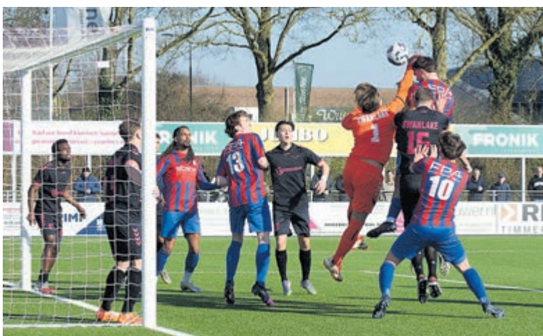
CSW geveld door bekende voetbalwet.