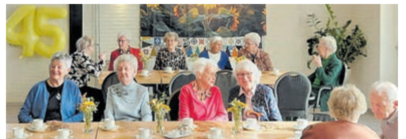
In Dorpshuis De Quakel kwamen gasten, vrijwilligers en oud-bestuursleden samen voor een feestelijke middag.