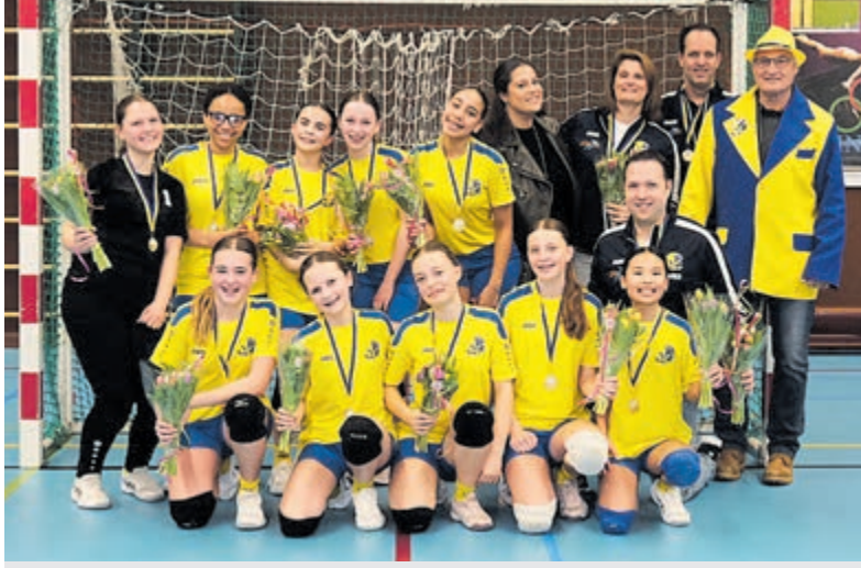
De speelsters van Legmeervogels D1 hebben zaterdag in de Proosdijhal in Kudelstaart het kampioenschap veiliggesteld.