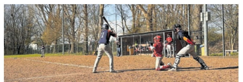
Geslaagd Vuurlijn-toernooi bij Thamen.

samen voor een geslaagde en gezellige toernooidag. Na afloop werd de dag gezamenlijk afgesloten en vond de prijsuitreiking plaats. Urbanus uit Hoorn ging er met de hoofdprijs vandoor. Samen met de Flags, uit Lisse, wisten zij al hun wedstrijden te winnen. Gryphons uit Rosmalen behaalde een knappe derde plaats. De organisatie kijkt terug op een zeer geslaagd toernooi en wil alle teams, coaches en ouders hartelijk bedanken voor hun inzet en enthousiasme. Meer informatie: www.thamen.info .