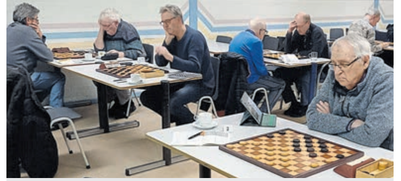
Dammers sporen weer, zege voor K&G.