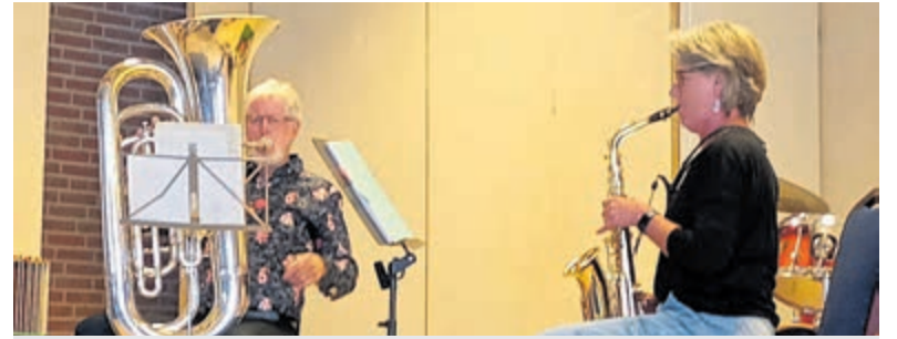
Open podium Tavenu.