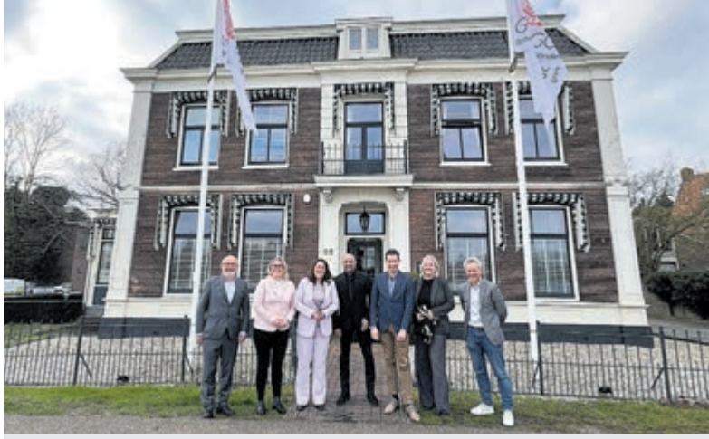
Het college op bezoek bij familiebedrijf Raggers.