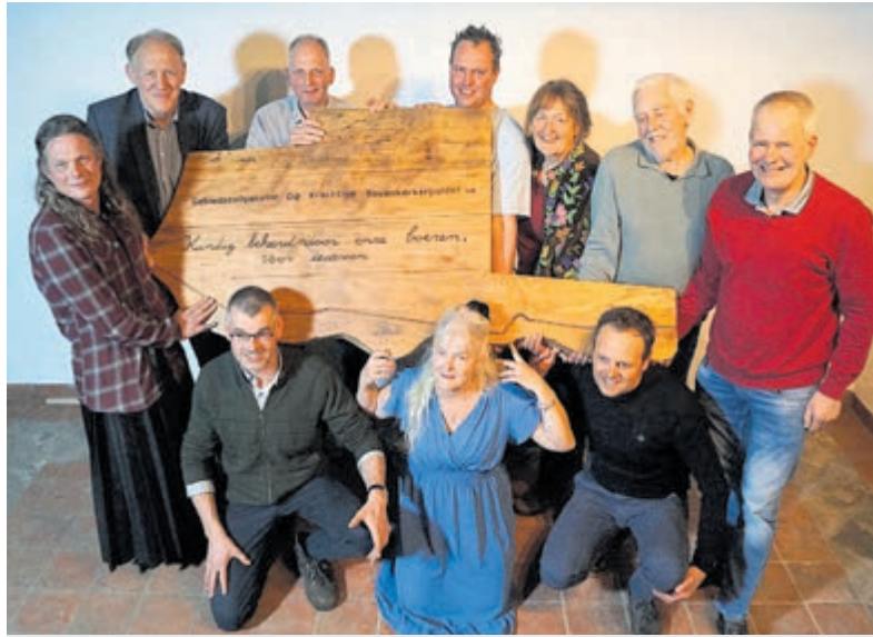
Boeren tussen Amstelveen en Uithoorn bundelen hun krachten.