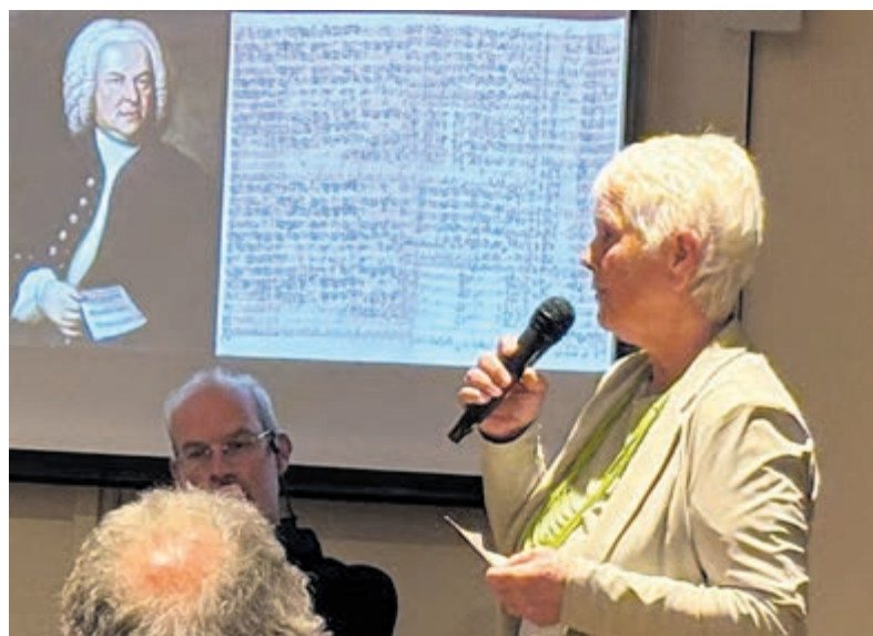
De lezing Matthäuspasion trok veel bezoekers.

gepromoveerd muziekwetenschapper en expert van Johan