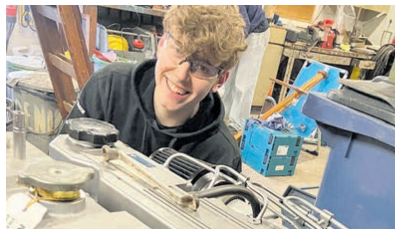
Tijdens de landelijke vrijwilligersactie NLdoet hebben veel vrijwilligers zich ingezet voor Scouting Admiralengroep Uithoorn.