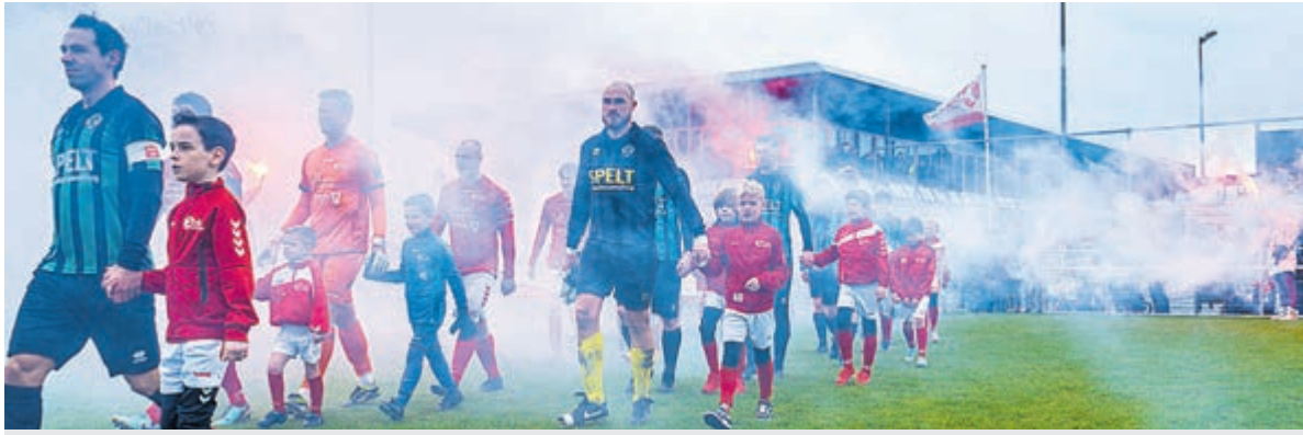
Sport en amusement tijdens de KDO-sponsordag.