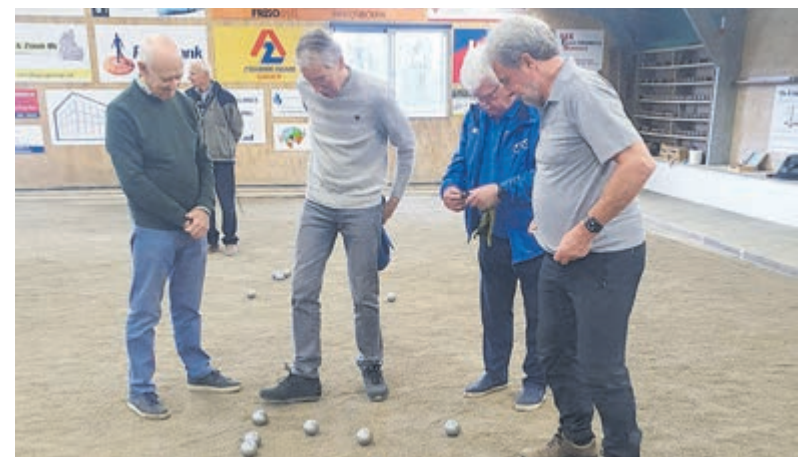
BUT bezoekt zustervereniging OSB.

BUT-leden via carpooling in zo'n dertig minuten naar Bodegraven. Sommige leden kenden de accommodatie al van eerdere ontmoetingen met OSB, voor anderen was het een aangename verrassing om in zo'n ruime en goed uitgeruste hal te spelen. Na een eerste consumptie gingen de BUT'ers enthousiast van start met hun onderlinge wedstrijden en moesten zij wennen aan de andere ondergrond dan op hun eigen banen. Terwijl het buiten stevig regende, was het binnen uitstekend toeven. De laatste speelronde werd gezamenlijk gespeeld met leden van OSB, die eveneens enthousiast reageerden op deze uitwisseling. Mogelijk volgt in de zomer een tegenbezoek, dan op de banen van BUT aan de Vuurlijn.