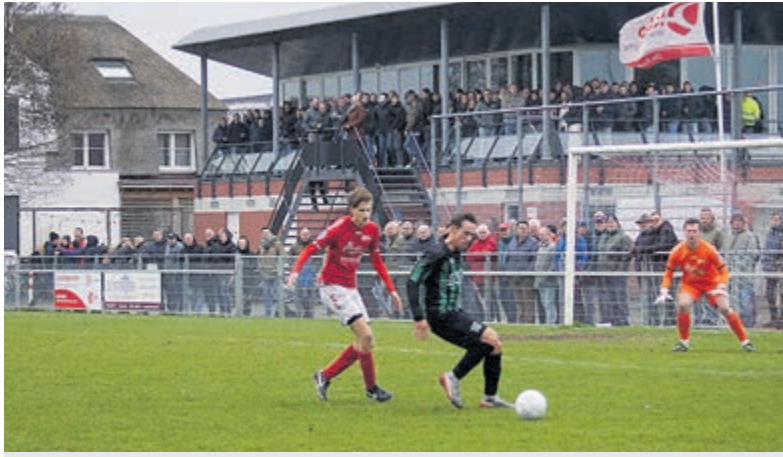
Effectief KDO straft naïef Nicolaas Boys af.