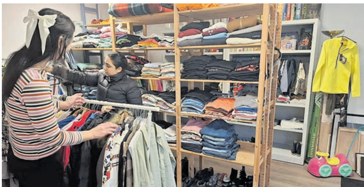
De weggeefwinkel maakt onderdeel uit van de bredere dienstverlening van VluchtelingenWerk Uithoorn.

Integratie zichtbaar Volgens VluchtelingenWerk is de winkel méér dan een distributiepoint voor spullen: het is een plek waar integratie in de praktijk zichtbaar wordt. "Statushouders leren er niet alleen de taal, maar komen ook in contact met inwoners en vrijwilligers uit Uithoorn." De organisatie benadrukt, dat openstaan voor andere culturen en een respectvolle houding belangrijke voorwaarden zijn voor iedereen die zich als vrijwilliger aanmeldt. Deelnemers krijgen daarnaast een korte opleiding en begeleiding vanuit de VluchtelingenWerk Academie.