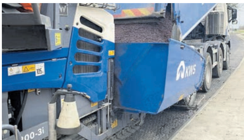
De Provincie Utrecht bouwt van maandag 9 maart tot en met vrijdag 24 april de kruising van de N212 en de N405 in Kamerik om tot rotonde.

Buslijn 123 rijdt normaal tussen Woerden en Mijdrecht via de N405. Tijdens fase 1 volgt de bus een omleiding en worden de haltes in Kamerik niet bediend. Tijdens fase 2 rijdt lijn 123 niet. Buslijn 524 bedient tijdens de werkzaamheden alle haltes die normaal gesproken ook worden bediend.