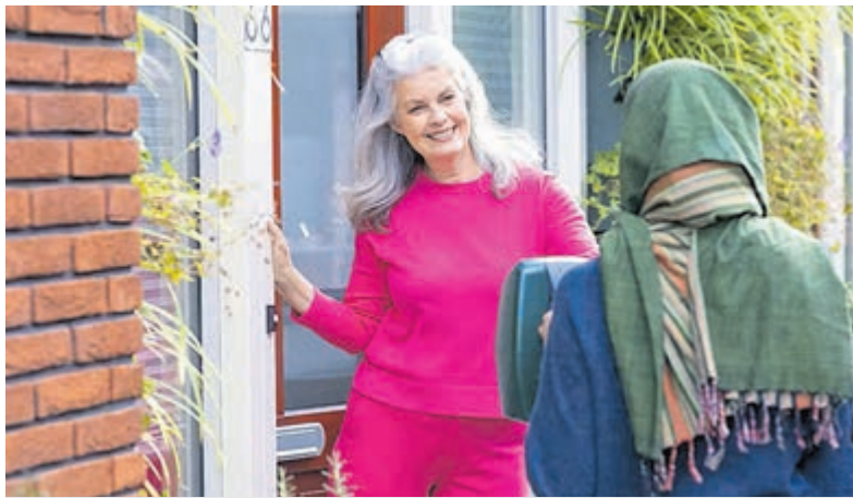
Ook in Uithoorn en De Kwakel zullen collectanten voor Amnesty van 8 tot en met 14 maart langs de deuren gaan.

Uithoorn - De zaterdagse postzegelruilbeurs van filatelistenvereniging Uithoorn wordt gehouden zaterdag 7 maart, van 10.00 tot 13.30 uur. Locatie: Wijksteunpunt Bilderdijk, Bilderdijkhof 1, Uithoorn. Er zijn altijd leden van de verenigingen aanwezig, bij wie informatie kan worden ingewonnen over het verzamelen van postzegels. Ook zijn er de stuiverboeken, dat zijn insteekboeken met postzegels, waar belangstellenden zegels uit mogen nemen voor 1 stuiver per stuk.