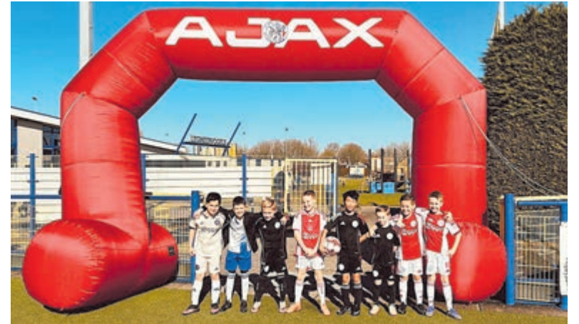
Sportpark De Rondhoorn stond woensdag 25 februari volledig in het teken van plezier, beweging en Ajax-beleving.

De samenwerking tussen Ajax en Legmeervogels krijgt deze zomer een mooi vervolg. In de zomervakantie strijkt namelijk het Ajax Camps & Clinics neer op Sportpark De Rondhoorn. Van maandag 6 tot en met vrijdag 10 juli kunnen jongens en meiden van 6 tot en met 16 jaar deelnemen aan het Ajax Camp bij Legmeervogels. Tijdens dit kamp trainen de deelnemers een week lang onder begeleiding van gecertificeerde trainers, waarbij het aanvullende Ajax-spel centraal staat. De inschrijving voor het Ajax Camp is nog geopend en zowel leden als niet-leden van Legmeervogels zijn van harte welkom om zich aan te melden.