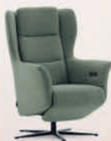
Sta-op stoel Riale