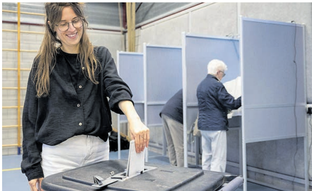
Het maakt voor stemgerechtigde burgers echt uit voor welk beleid er uiteindelijk wordt gekozen.