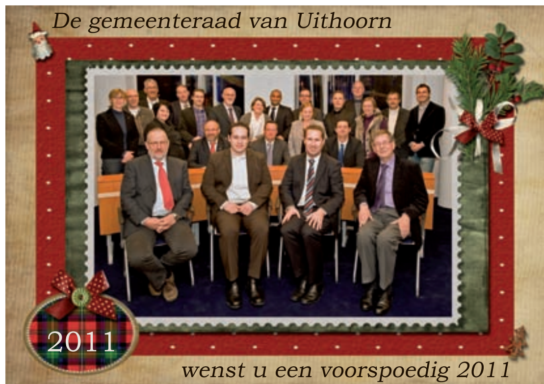
De gemeenteraad van Uithoorn