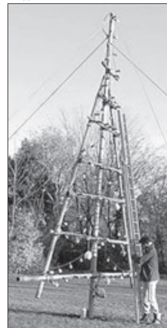
De boom in aanbouw

De komende week zullen de kerststukjes bezorgd worden.