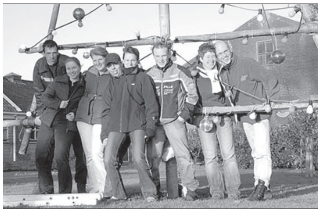
De bouwers van het kerstproject