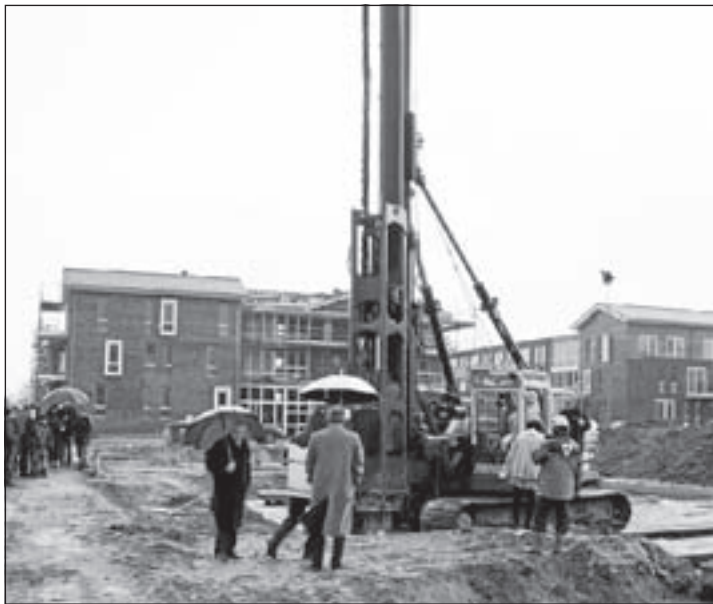
Het slaan van de eerste paal door Sint Nicolaas voor de 8 twee-onder-een-kap woningen tegenover het torengedouw