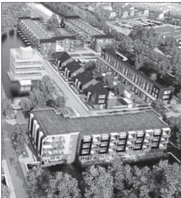
Het centrum van Park Krayenhoff rondom de voormalige IBM-toren zoals dit er straks gaat uitzien. Op de voorgrond het appartementencomplex De Stellinghof

Als klap op de vuurpijl werd het officiële gedeelte door Zwarte Piet afgesloten met het hijsen van de vlag voor het bereiken van het hoogste punt bij de 28 koopappartementen. Het complex 'De Stellinghof' staat parallel aan de Watsonweg en is gelegen op de plaats wat straks de nieuwe entree van de wijk wordt. De bewoners hebben vrij uitzicht op water en groen. In de parkeergarage van De Stellinghof werden geïnteresseerden aan de hand van beeldmateriaal en een driedimensionale presentatie uitgebreid