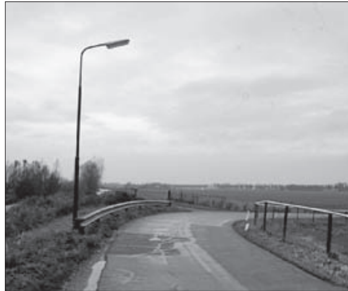
In de bocht van de schemerige Hoofdweg brandde de openbare verlichting 's avonds 14 november (nog) niet

Toegegeven, in een aantal gevallen is de storing (in Wilnis) na de melding een paar dagen later verholpen. En nu maar hopen dat wat u heeft gemeld er ook actie op wordt ondernomen. Veel meer mogelijkheden om uw (terechte) zorg en ergernis kenbaar te maken zijn er jammer genoeg niet.