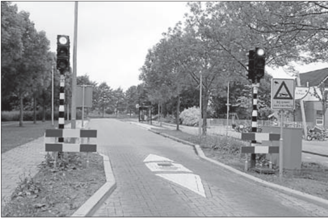
De bussluis verdwijnt en wordt heringericht als een doorgaande weg voor alle verkeer