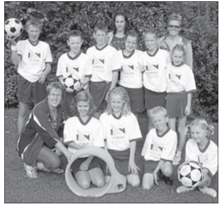
Atlantis D2 wint met ruime cijfers van Tempo

Onze tweede aanval wist ook drie maal te scoren waardoor de ruststand 6-0 voor Atlantis was. In de tweede helft leek het wel of Roebeson D2 vleugels had gekregen. Tempo kon geen ballen meer overgooien of een speler van Atlantis pakte deze weer af. De verdediging had weinig te doen behalve juichen als er weer eens was gescoord. En gescoord werd er. Uiteindelijk was de einduitslag 13-0. Uit het applaus van de vele ouders en opa's en oma's op de tribune bleek wel dat ook zij hadden genoten van deze geweldige wedstrijd.