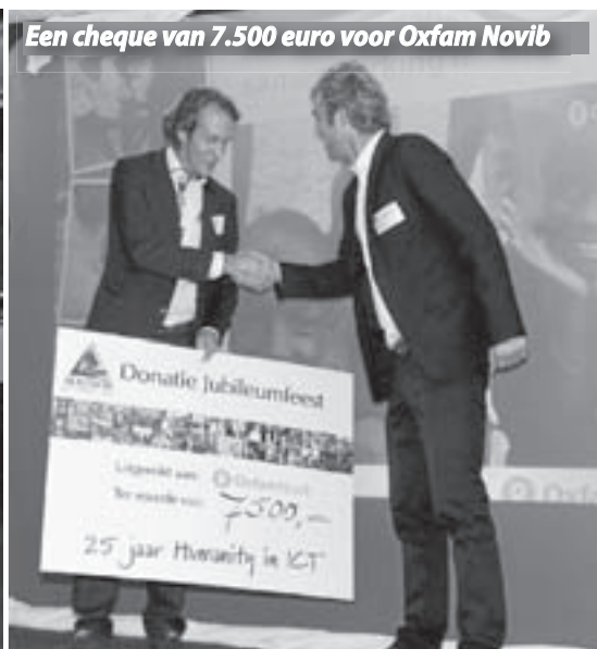
Een cheque van 7.500 euro voor Oxfam Novib