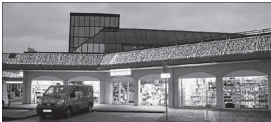
Fraaie nieuwe feestverlichting siert de gevelrand van het winkelcentrum

Uithoorn - Het is beslist de moeite waard om de komende weken boodschappen te gaan doen in Winkelcentrum Zijdelwaard op het Zijdelwaardplein. Dat geldt ook voor bewoners uit De Ronde Venen! Iedereen krijgt bij het winkelcentrum de kans om een splinternieuwe Audi A1 - waarde 23.000 euro - te winnen die in de hal van het winkelcentrum te bewonderen is. De auto is beschikbaar gesteld door Auto Maas in Uithoorn als hoofdprijs in het prijzenfestijn dat door de winkeliersvereniging wordt georganiseerd. Maar dat is niet het enige. Er zijn nog veel meer prachtige prijzen te winnen. Die worden mede door de deelnemende winkeliers in het winkelcentrum beschikbaar gesteld. Wat te denken van een elektrische fiets ter waarde van 1.200 euro als tweede prijs en een reischeque van 1.000 euro die als derde prijs op ie-