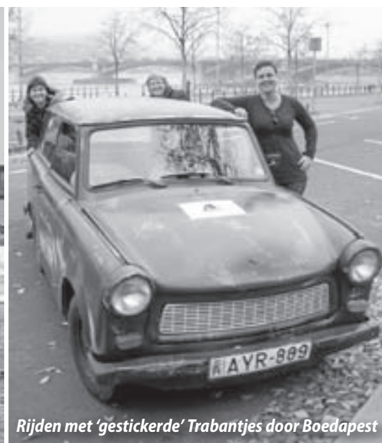
Rijden met 'gestickerde' Trabantjes door Boedapest