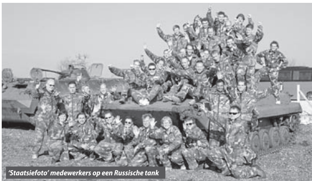
'Staatsiefoto' medewerkers op een Russische tank