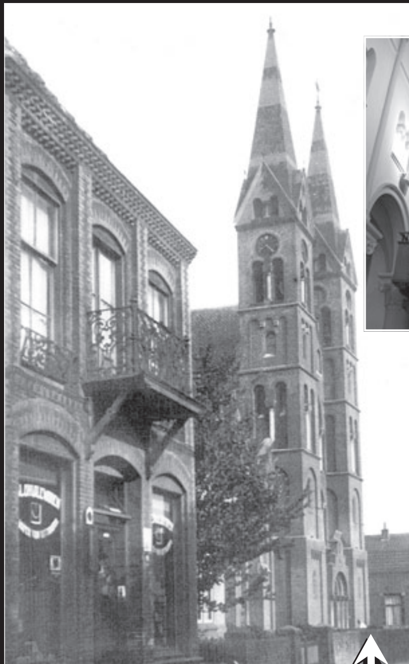
• De R. K. kerk aan de Schans