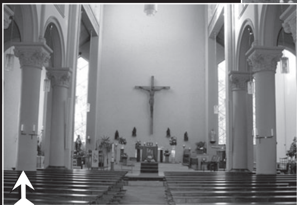
• Het interieur van de kerk