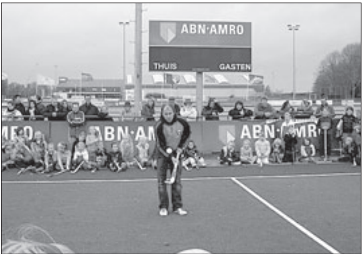
Foto met Teun de Nooijer