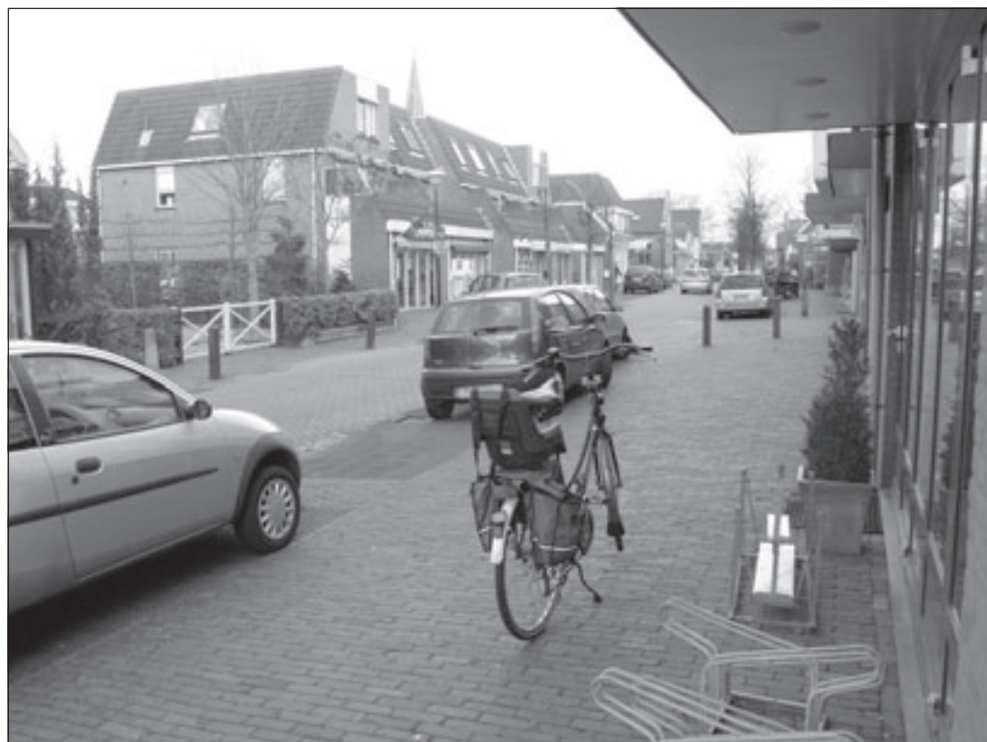
Gaat dit winkelgebiedje in Wilnis verdwijnen?