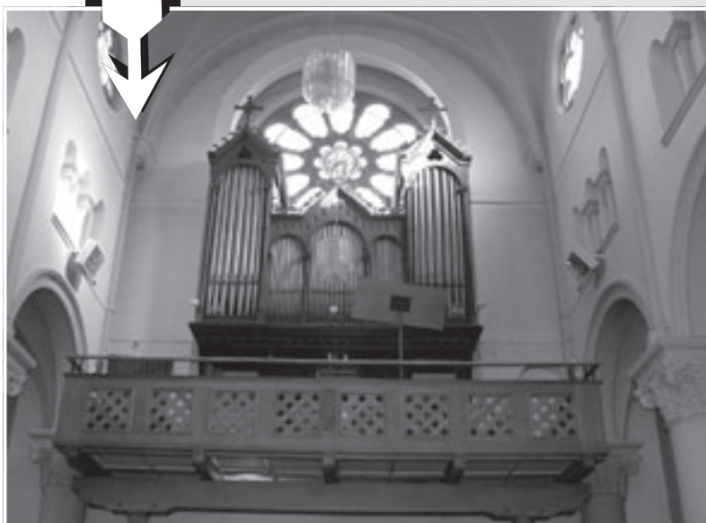
• Het kerkorgel in de R. K. kerk aan de Schans