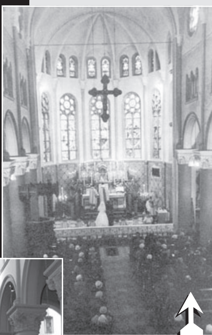
• Een van de laatste huwelijksluitingen in de kerk vóór de verbouwing.