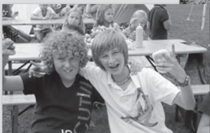
In augustus is het eerste jeugdkamp van Veldzijde gehouden met tenten op de drivingrange, een nachtspel over de donkere golfbaan en een ouder/kind wedstrijd als slot.