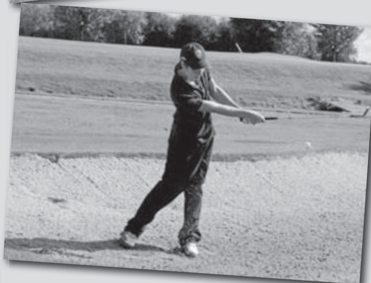
De lustrumweek opende met het inmiddels welbekende Veldzijde jeugd open, een wedstrijd voor jeugdspelers uit het hele land. Een prachtige prijzentafel met Ipod's, golftassen en veel golfballen lokte ruim 100 jeugdspelers van beginners tot zeer ervaren spelers. Niet alleen de jeugd had een goede dag, ook kansarme kinderen in Kasigau in Kenia worden ondersteund uit de opbrengst van deze dag. Meer hierover op www.veldzijdejeugdopen.nl