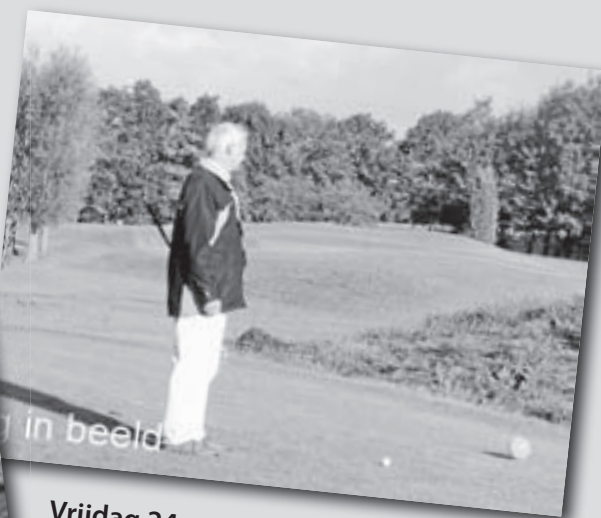
Vrijdag 24 september werd een bijzondere dag voor Veldzijde. Voor de eerste keer mochten de business leden van Veldzijde genieten van een 18 holes baan.