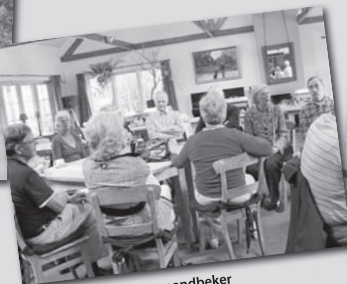
Bijeenkomst over de maandbeker