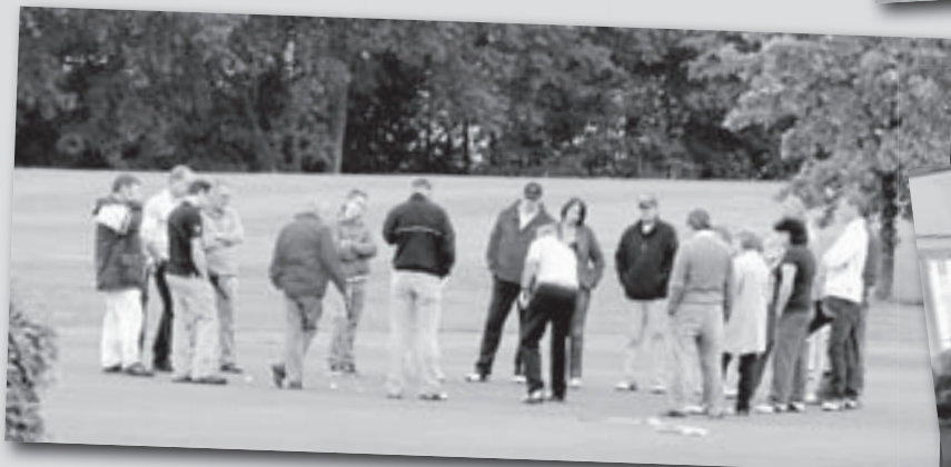
Praktijkles GVB kandidaten op Veldzijde