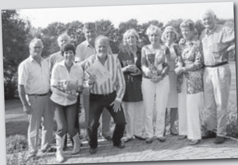
Maandag stond weer de deur open, deze keer voor oud-leden en genodigden. De oudleden speelden een wedstrijd over 11 holes, twee holes van de uitbreiding mochten speciaal voor deze dag open om deze oudleden een kijkje te geven op de nieuwe baan. De genodigden van de gemeente, zuster golfbanen en de golf federatie kwamen eind van de middag voor een geanimeerde receptie.