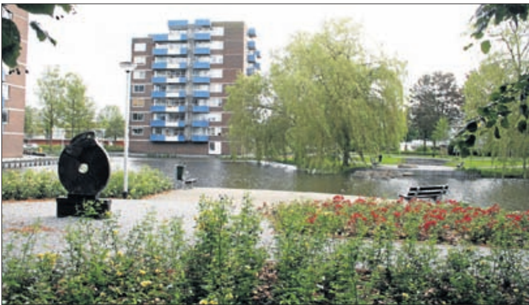
Park, vijver en verzorgd openbaar groen naast de flat Madelief (In het Rond)

De toename van het verkeer op de Zijdeweg, de Arthur van Schendellaan, de Wiegerbruinlaan en de aangrenzende woonwijken, kwam eveneens ter sprake. De doorgaande wegen zullen worden verbreed en er komen meer opstelbanen voor afslaand en doorgaand verkeer. Een bij de plannen behorende verkeersstudie heeft uitgewezen dat op het traject vanaf de kruising met de Arthur van Schendellaan richting noordelijke gemeentegrens (N201) de verkeersstroom in 2015 met 23 procent zal zijn opgelopen. Ook dat rotondes geen voorkeur hebben omdat de verkeersdruk te hoog is. Bovendien blijken rotondes met meer rijstroken onveilig te zijn voor fietsers en voetgangers. Zoals het er nu naar uitziet komen er met verkeerslichten geregelde kruispunten bij de Arthur van Schendellaan