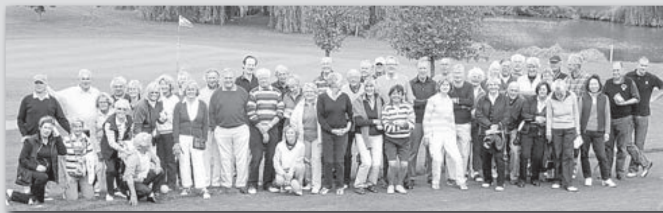
De woensdag was gereserveerd voor de senioren van de club. In gemixte flights werd genoten van het prachtige najaarsweer. Spontaan werd bij de inschrijving een goed doel aangewezen: een weeshuis in India. Toch weer een opbrengst van 165 euro.