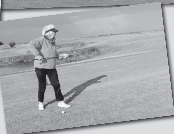
Een eerste Pro-Am (professionals met amateur golfspelers) werd gespeeld voor KiKa (kinderen kankervrij) en haalde 2500,- euro op.