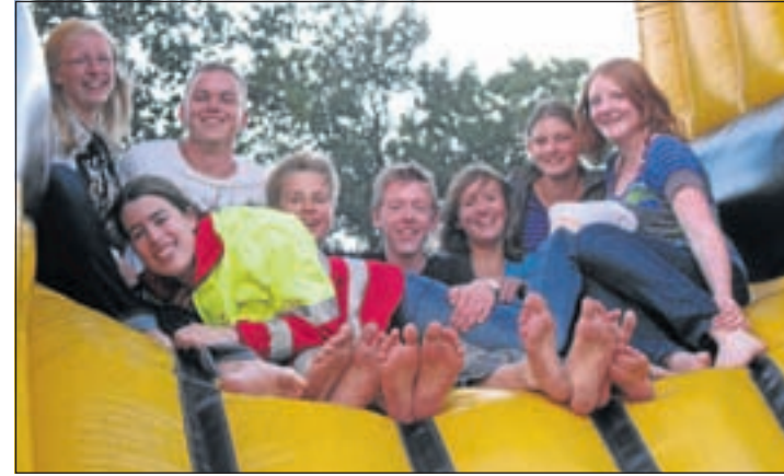
Tienerleden op de stormbaan

lesgegeven voor de Zwemvaardigheidsdiploma's, waaronder snorkelen, balzwemmen, survival, wereldswemslagen, plankspringen en aquasportief voor kids.