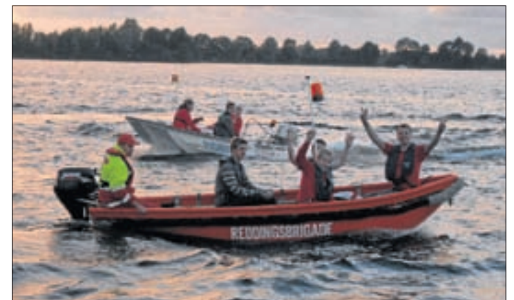
Rondvaart in de 2 Reddingsbrigadeboten

ABC zwemlessen. Deze lessen worden met name gericht op leerlingen die in grotere groepen moeilijker meekomen. Verder wordt er