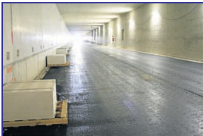
In één van de tunnelbuizen is de onderlaag voor de rijweg al aangebracht. Links pallets met brandwerende tegels