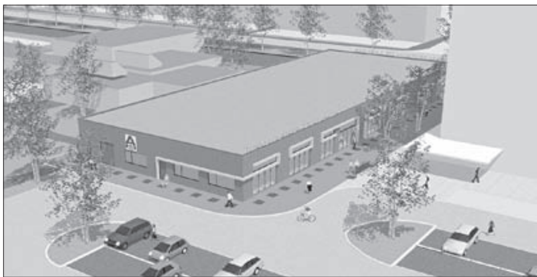
Zo zal het nieuwe eruit gaan zien (Artistieke impressie: Architectenbureau H.W. van der Laan, Wilnis)