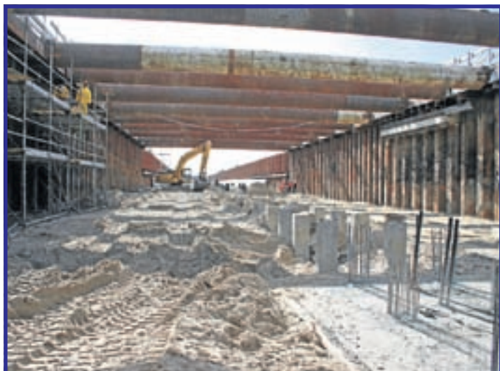
Werkzaamheden aan het open bak gedeelte, gezien in de richting Aalsmeerderweg