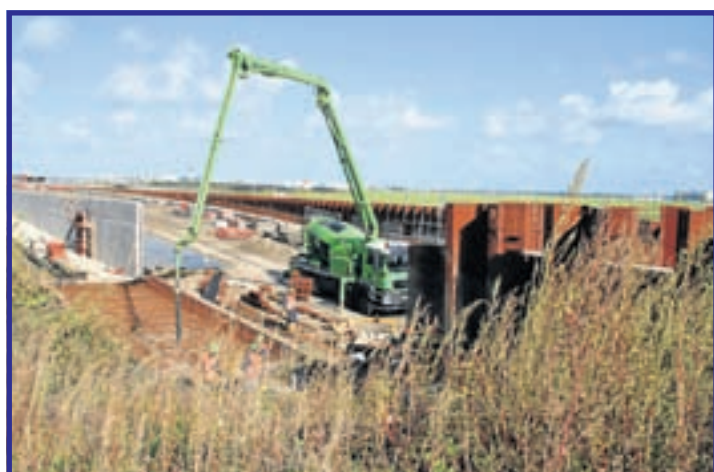
Werkzaamheden aan de toerit naar de tunnel bij Schiphol-Rijk