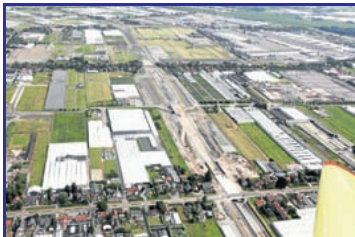
De N201 gezien in de richting van Uithoorn. Van beneden naar boven de kruisingen met de Aalsmeerderweg, Middenweg en Hornweg met de toe- en afritten. Aan de bovenrand van de foto de Legmeerdijk met rechts de Bloemenveiling