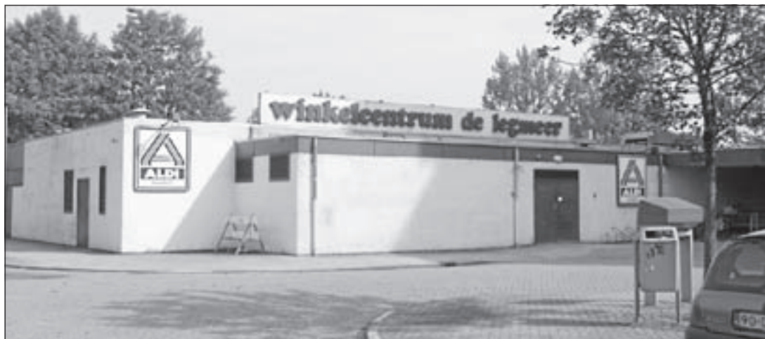
Het oude winkelcentrum wordt binnenkort gesloopt

Het KNA-gebouw komt geheel vrij te staan. Die hebben eveneens plannen voor uitbreiding. "Wellicht dat wij te zijner tijd daar een ruimte voor ons Steunpunt Buurtbeheer Legmeer kunnen huren. Van daaruit kunnen wij onze activiteiten dan weer volop ter hand nemen, zoals vergaderen, bewonersoverleg organiseren, spreekuur houden en zo meer. Dat doen we nu in een noodvoorziening, die overigens niet minder welkom is. Wij hebben hier namelijk geen buurtcentrum zoals andere wijken dat wel hebben. Een vaste stek als kantoor voor ons Buurtbeheer is natuurlijk meer dan wenselijk. Maar dat zal best goed komen."