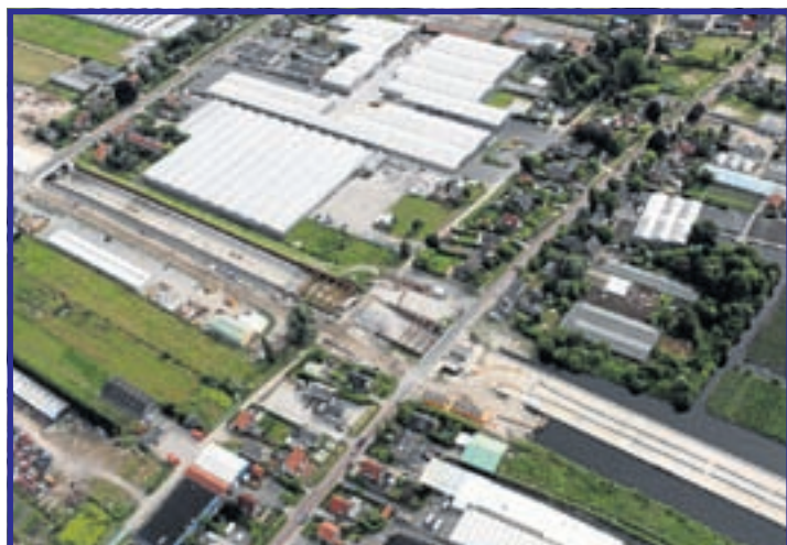
De Waterwolftunnel in de N201 met het midden de Oosteinderweg en de Hoge dijk. Rechts beneden het gesloten tunneldeel, links het open gedeelte. Geheel links de Aalsmeerderweg