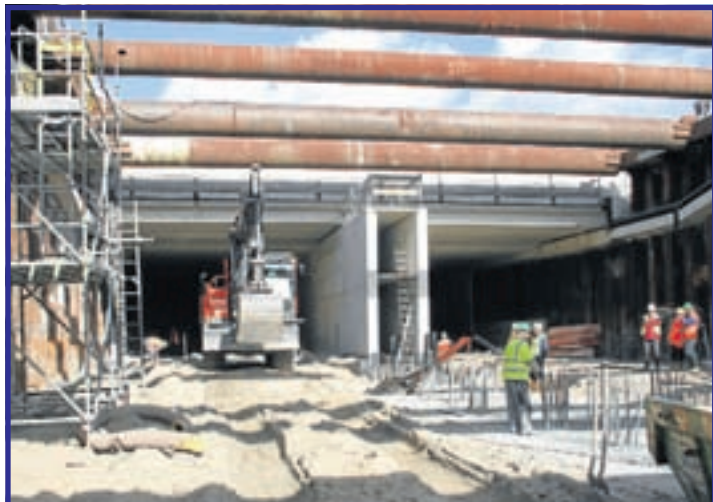
Tunnelbuis ingang Aalsmeerszijde. Het middentunnelkanaal moet nog worden verlengd. Boven de graafmachine kruist de Oosteinderweg