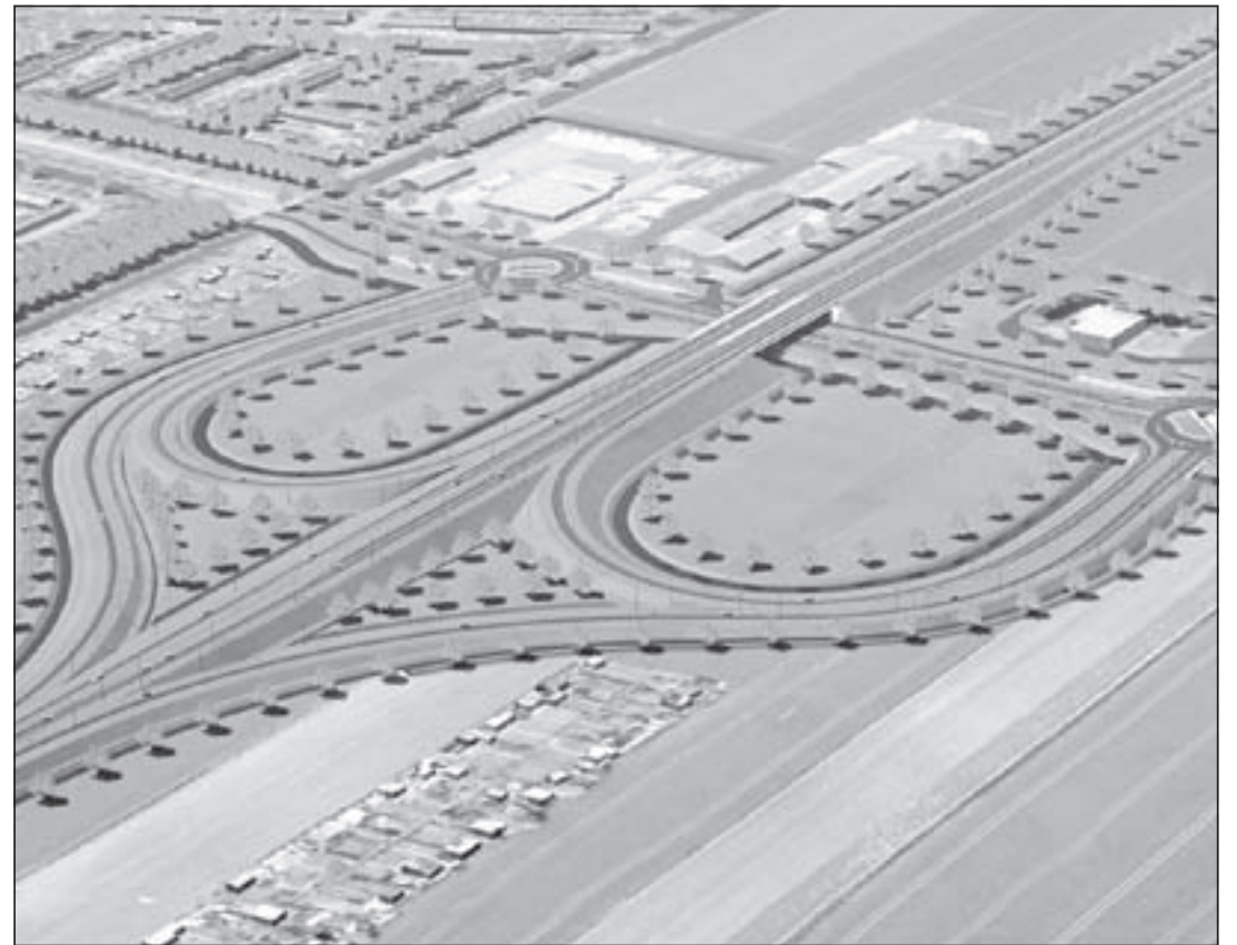
Toekomstig ingericht kruispunt Zijdelweg

van (delen van) de weg zullen wij steeds in relatie tot de afwikkeling van het verkeer op de totale route bekijken. Levert het in gebruik nemen van een nieuw gedeelte een te hoge verkeersdruk elders in Uithoorn op, dan kan dat wegdeel, wat Uithoorn betreft, nog niet opengesteld worden."