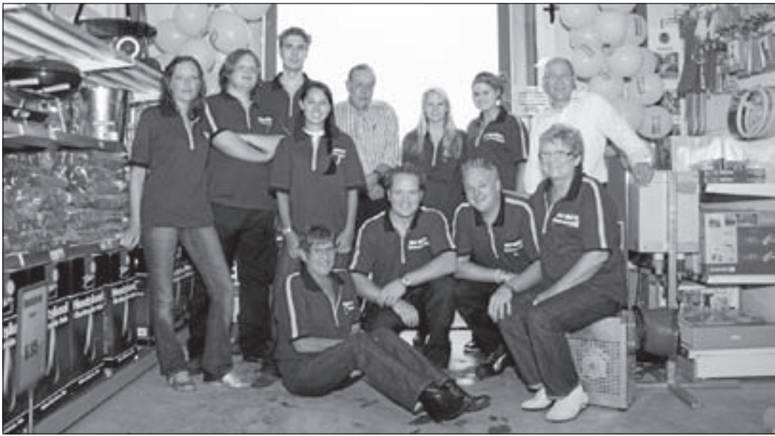
Het team van Multimate staat graag tot uw dienst