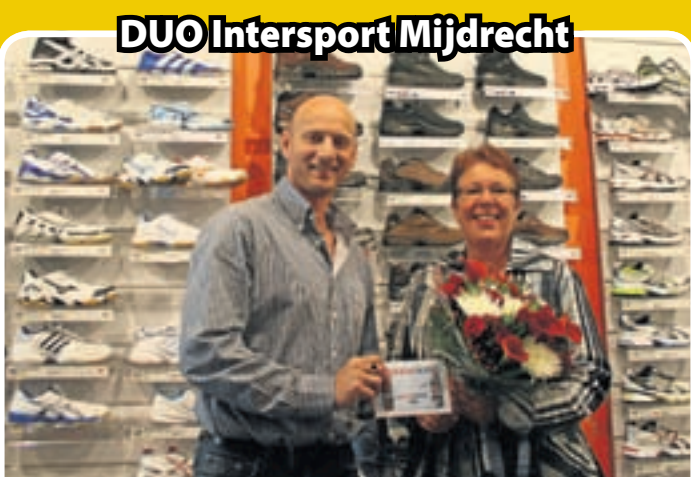
DUO Intersport Mijdrecht De waardebon ter waarde van 50 euro, aangeboden door DUO Intersport in Mijdrecht, werd gewonnen door de familie Oudshoorn uit Wilnis. Zij waren echter niet in de gelegenheid om de prijs in ontvangst te nemen, dus deed hun schoondochter dat.