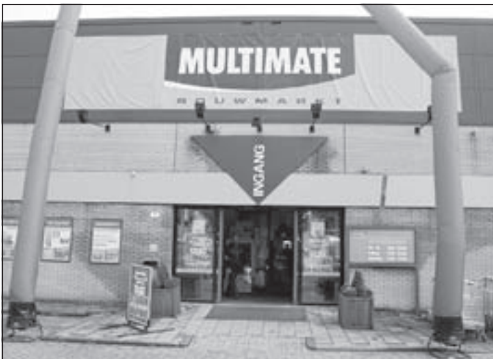
Big Boss is Multimate geworden

Voor de kinderlessen is er geen open huis. Zij mogen gewoon een proefles komen doen! Op deze manier worden zij in de gelegenheid gesteld om kosteloos te ontdekken of de betreffende cursus hen aanspreekt. Danscentrum Colijn gaat voor kwaliteit, dit heeft ook consequenties voor het aantal leerlingen per groep. Sommige groepen zijn al behoorlijk bezet, dus het danscentrum kan helaas geen garantie geven dat uw zoon/dochter na de proefles ook werkelijk geplaatst kan worden. De balletlessen en breakdanclessen starten vanaf 20 september a.s..Meer info? www.colijndancemasters.nl of 06-53559450.