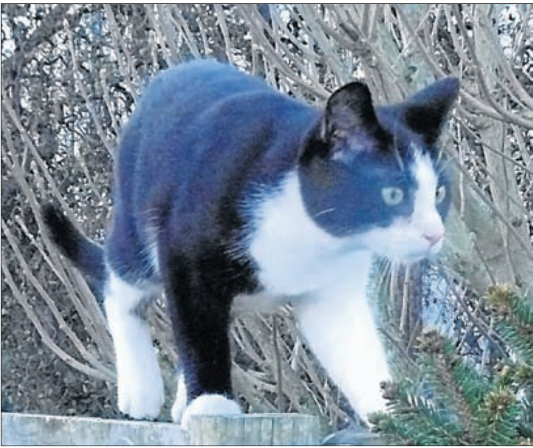
In leven was Summer een nieuwsgierige en aanhankelijke kat met een 'zonnig' humeur