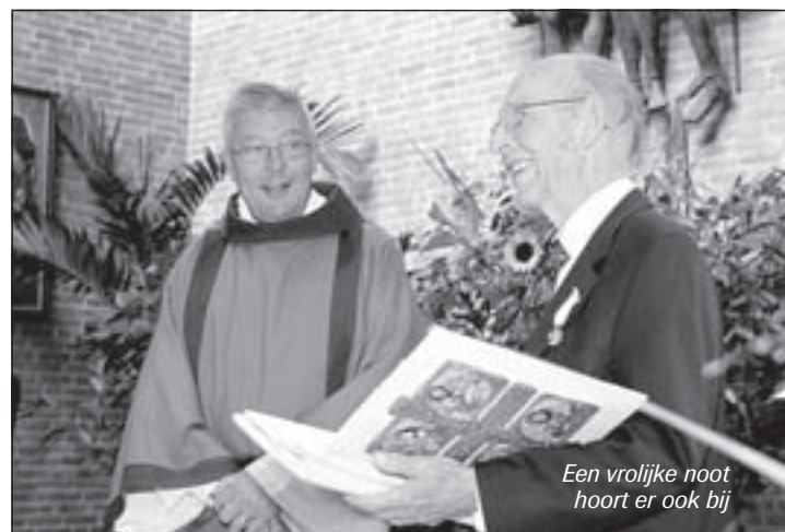
Een vrolijke noot hoort er ook bij