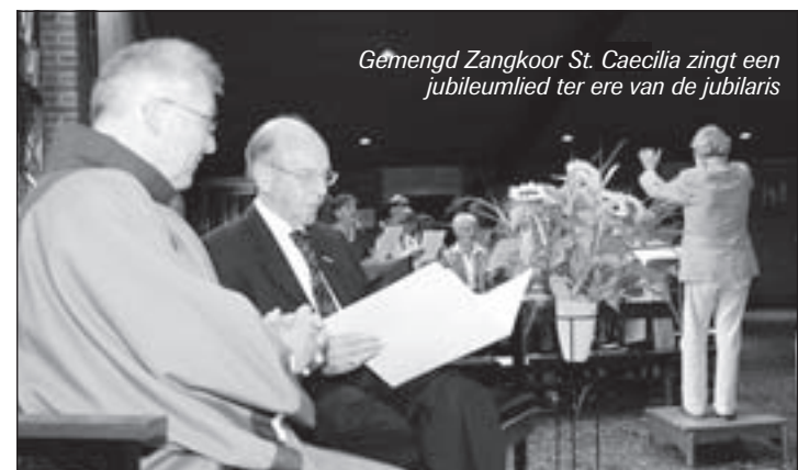
Gemengd Zangkoor St. Caecilia zingt een jubileumlied ter ere van de jubilaris

tober 1928 geboren in Amsterdam en groeide op in de Watergraafsmeer. Al spoedig ontwikkelde hij zijn talenten op het gebied van muziek (orgel) en combineerde dat met zijn werk als onderwijzer. Dat is nu