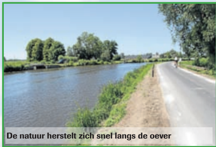
De natuur herstelt zich snel langs de oever

In het voorjaar van 2011 wordt begonnen met de uitvoering van de dijkverbetering de Hoef Westzijde. Met de meeste bewoners aan de dijk zijn inmiddels ook individuele afspraken gemaakt. Zij worden van het project op de hoogte gehouden via brieven en nieuwsbulletins. Wie meer wil weten over het dijkverbeteringsplan wordt verwezen naar www.agv.nl/dehoef of www.waternet.nl/dehoef .