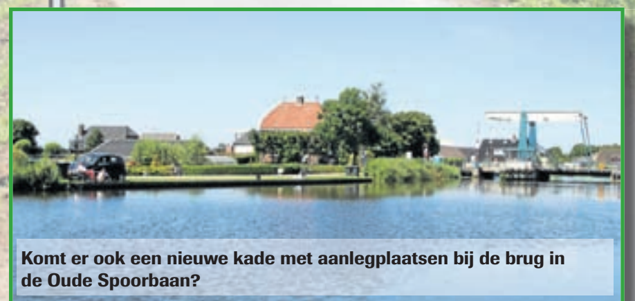
Komt er ook een nieuwe kade met aanlegplaatsen bij de brug in de Oude Spoorbaan?