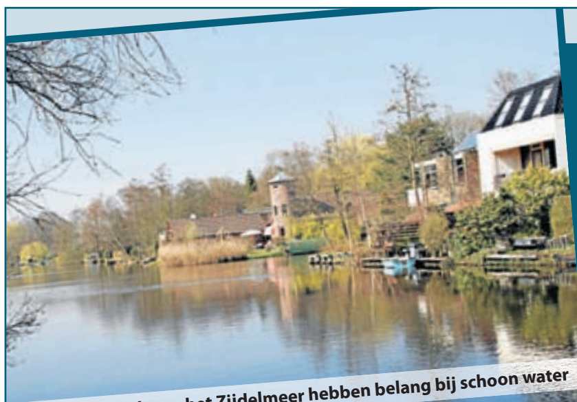
Alle bewoners langs het Zijdelmeer hebben belang bij schoon water