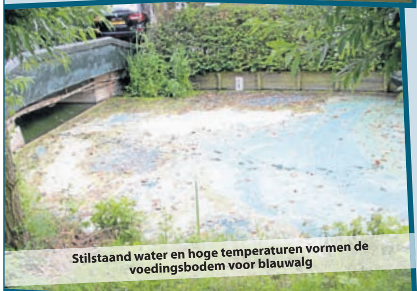
Stilstaand water en hoge temperaturen vormen de voedingsbodem voor blauwalg