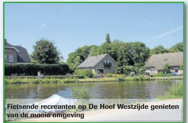
Fietsende recreanten op De Hoef Westzijde genieten van de mooie omgeving