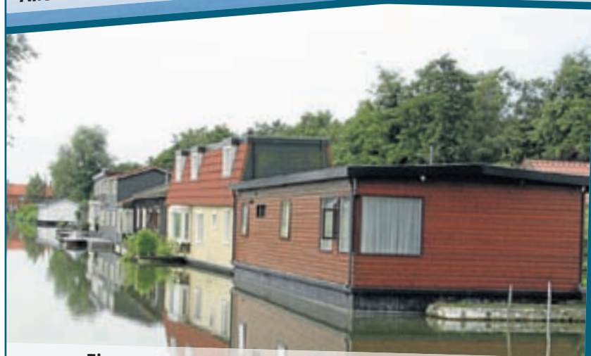
Eigenaren van woonarken zijn bang voor peilverlaging in het Zijdelmeer