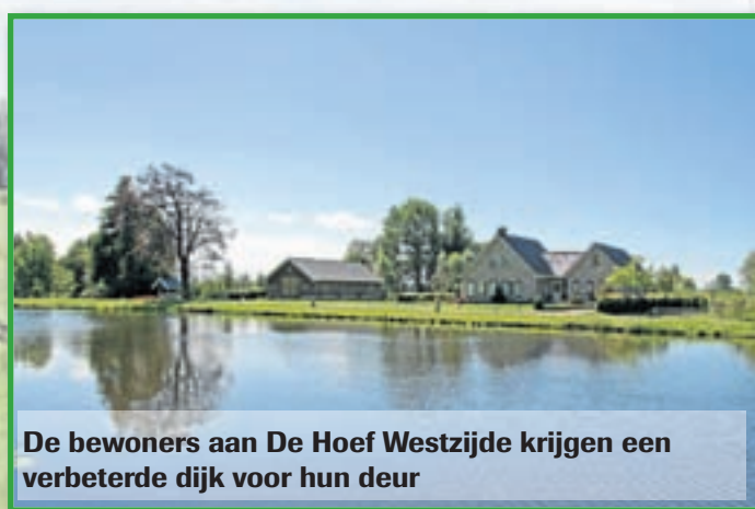
De bewoners aan De Hoef Westzijde krijgen een verbeterde dijk voor hun deur