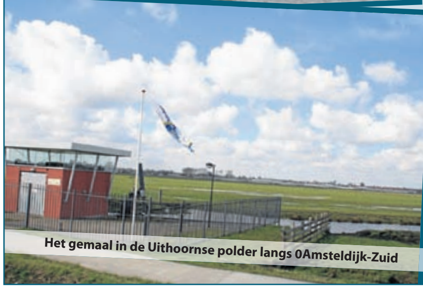
Het gemaal in de Uithoornse polder langs OAmstedijk-Zuid