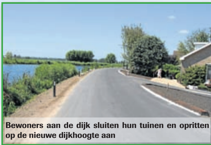
Bewoners aan de dijk sluiten hun tuinen en opritten op de nieuwe dijkhoogte aan