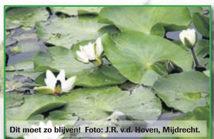
Dit moet zo blijven!