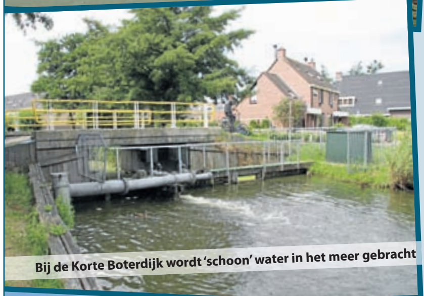
Bij de Korte Boterdijk wordt 'schoon' water in het meer gebracht