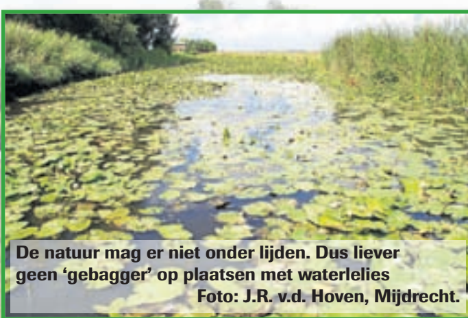
De natuur mag er niet onder lijden. Dus liever geen 'gebagger' op plaatsen met waterlelies