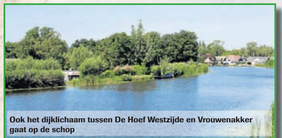
Ook het dijklichaam tussen De Hoef Westzijde en Vrouwenakker gaat op de schop