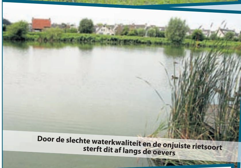
Door de slechte waterkwaliteit en de onjuiste rietsoort sterft dit af langs de oevers