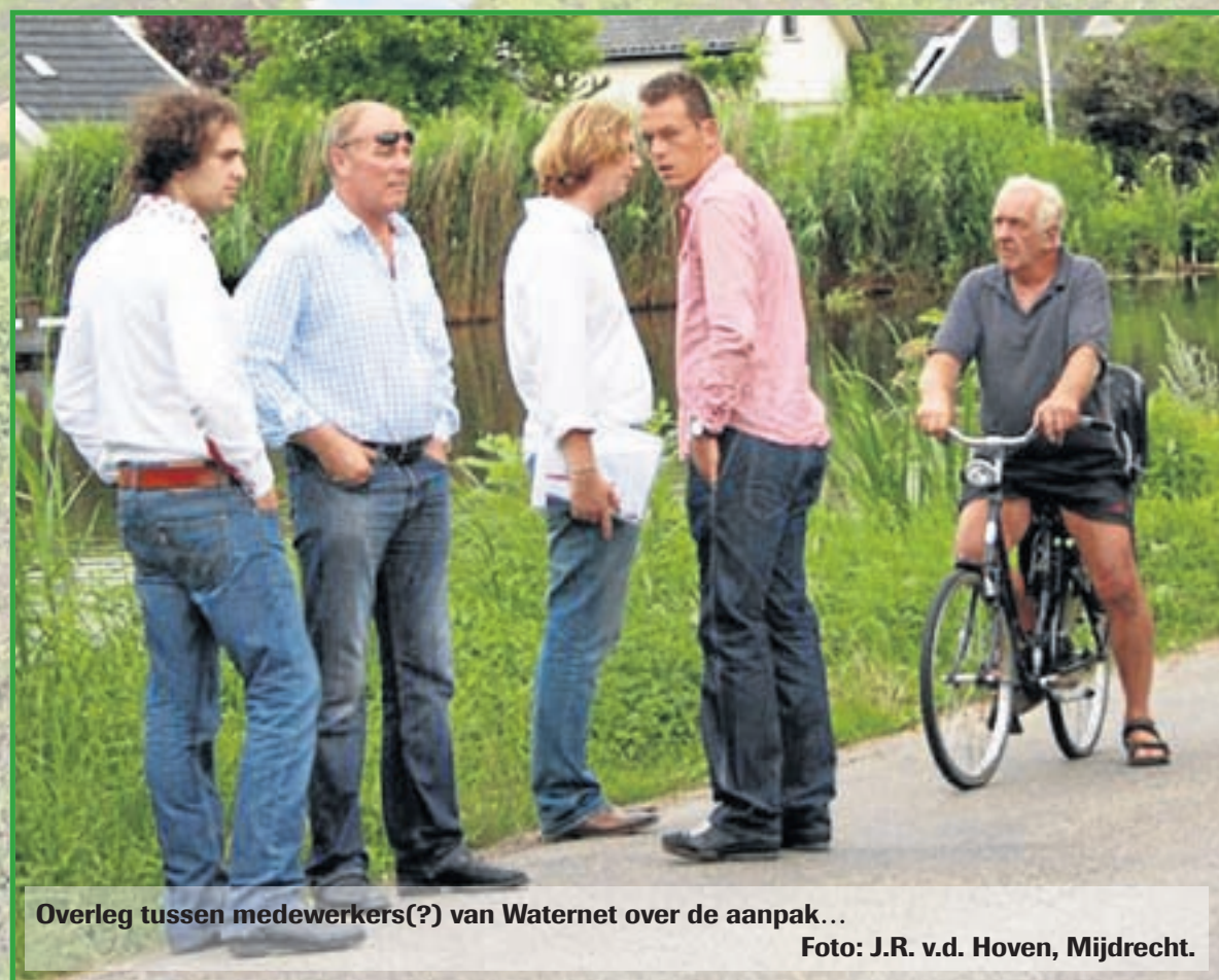
Overleg tussen medewerkers(?) van Waternet over de aanpak...