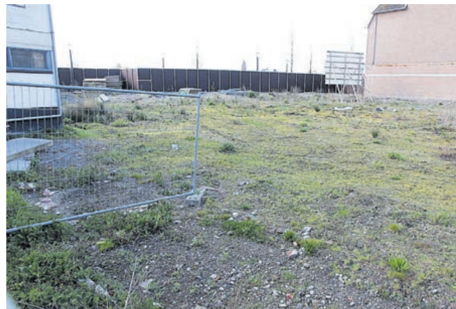
De bouwplaats van de toekomstige 'De Rede' blijft nog twee jaar braak liggen

hoeft niet te worden aangepast) en kan medio 2019 de bouw van start gaan als er geen bezwaarschriften worden ingediend. Eind 2020(!) kan het nieuwe gebouw dan worden opgeleverd en geopend. Een en ander houdt wel in dat de bibliotheek nog twee jaar in het huidige winkelpand in de Dorpsstraat zal moeten bivakkeren en dat daarvoor overleg nodig is met de eigenaar van het pand. Volgens de wethouder heeft die aangekondigd dat de