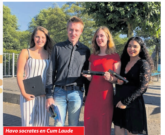
Havo socrates en Cum Laude