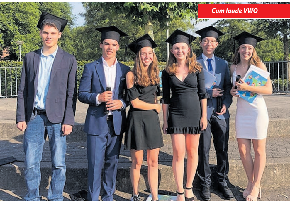
Cum laude VWO