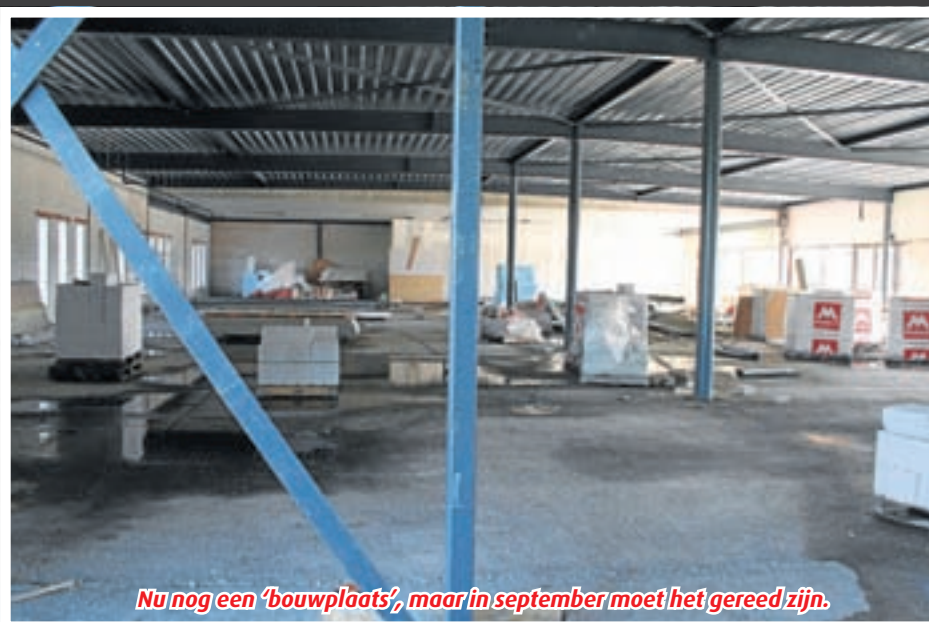
Nu nog een 'bouwplaats', maar in september moet het gereed zijn.