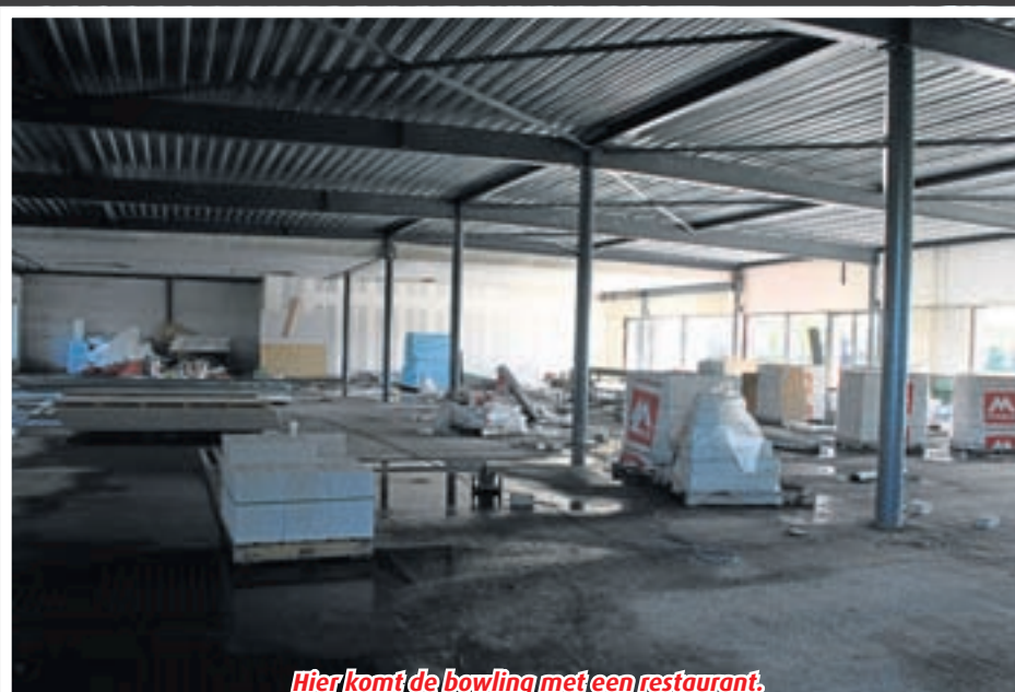
Hier komt de bowling met een restaurant.