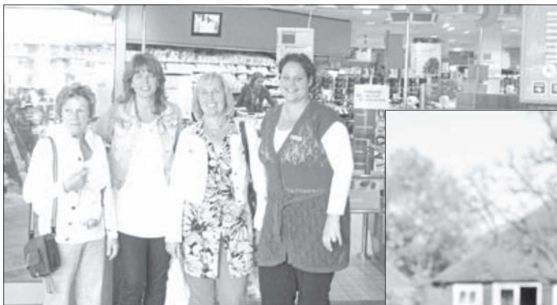
De drie gelukkige winnaars met een medewerkster van AH Jos van den Berg

Uithoorn - De drie gelukkige prijswinnaars van de geweldige moederdagactie van AH Jos van den Berg zijn bekend. Drie moeders kunnen - wanneer het hen uitkomt - een middagje heerlijk gaan genieten bij Madelin Beauty Home in Nieuwveen. AH Jos van den Berg heeft deze moederdagactie dan ook samen met Madelin georganiseerd. De klanten van AH hoefde alleen bij aankoop van minimaal 10 euro, je naam, adres en telefoonnummer op de kassabon te zetten en in de daarvoor bestemde ton te deponeren. Drie kassabonnen werden er