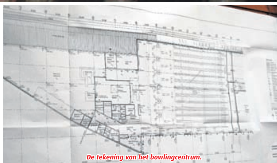
De tekening van het bowlingcentrum.