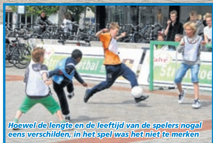
Hoewel de lengte en de leeftijd van de spelers nogal eens verschilden, in het spel was het niet te merken