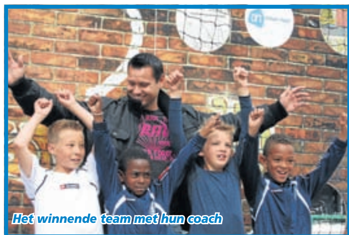
Het winnende team met hun coach