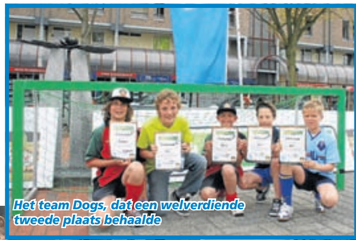
Het team Dogs, dat een welverdiende tweede plaats behaalde