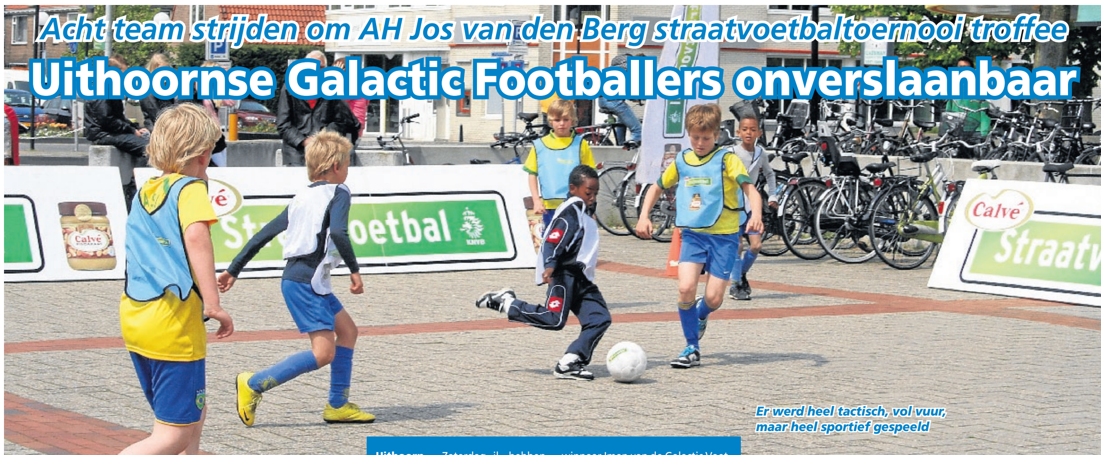
Er werd heel tactisch, vol vuur, maar heel sportief gespeeld