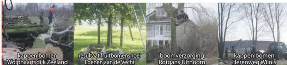
kappen bomen Wolphaartsdijk Zeeland