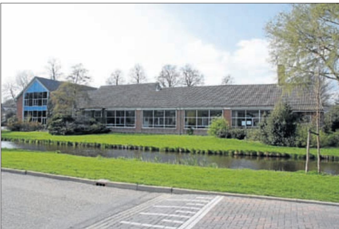
Het voormalige pand van de basisschool De Dolfin past prachtig in de plannen om er een vorm van Montessori onderwijs aan te bieden

ling. Degene die het mooiste sprookjesboom-theater heeft gemaakt wint de prijs. Alle deelnemende kinderen kregen verder een Efteling button en wie dat wilde kon zijn hoofd door een gat in een naast de kraam opgezette Sprookjesboomplaat steken. Dat leverde niet zelden de nodige hilariteit op. Afgelopen maandag is de prijswinnaar bekend geworden. Die zal ongetwijfeld blij zijn met de gewonnen tickets voor het themapark!