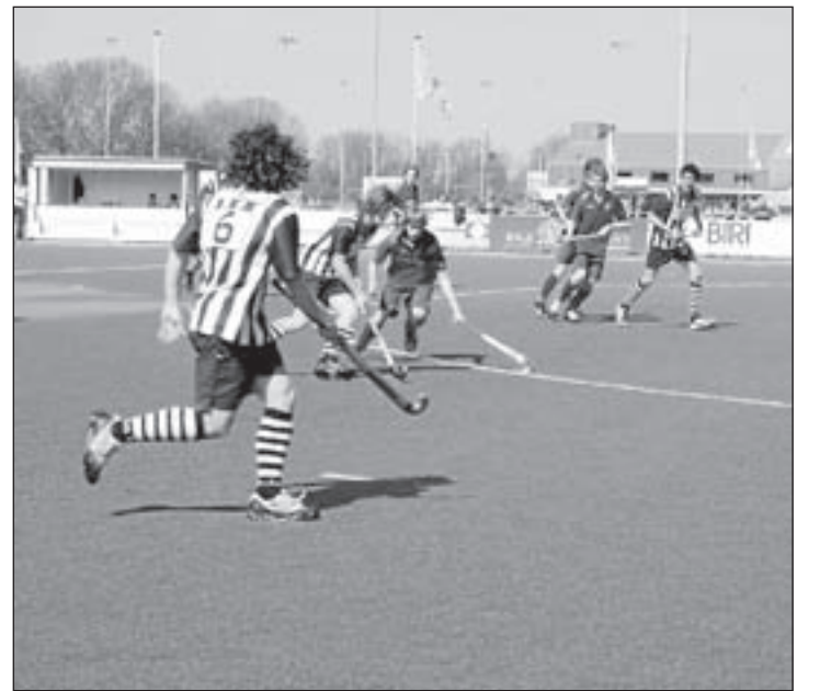
Foto: Een stug verdedigend Qui Vive A1 bleef driekwart van de wedstrijd op voorsprong tegen HDM

JA1 gaat daarom ook volgende week voor de kansen, met hopelijk een van blessures hersteld team en vertrouwend op de mogelijkheden van de individuele spelers en vooral het collectief.