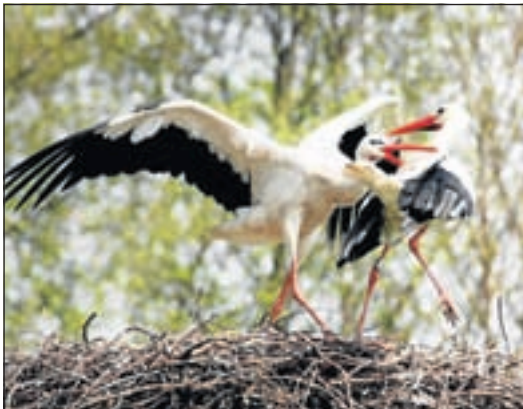
Petra Hoogendoorn, Uithoorn

Het echtpaar ooievaar (Boterdijk ) werd zaterdagmiddag gestoord door drie andere ooievaars. Het mondde uit in een heftige strijd. Het mannetje was bezig in de lucht, zodat de andere ooievaars het nest niet zouden kunnen bereiken. Maar helaas moest het vrouwtje zich ook verdedigen. De ganzen voelden ook al aan dat er onraad zou komen. Deze "renden" met hun kleine grut naar een veilige plek. Na een half uurtje was het schouwspel voorbij en nam het gekrijs en geklepper weer af. Ook kwamen de ganzen met hun kleintje weer te voorschijn. De rust was wedergekeerd. Er kwam een aantal bezoekers langs en we vroegen ons af hoe dit zou kunnen. Er werd een suggestie gedaan, dat het misschien wel de jongen van verleden jaar zouden kunnen zijn en deze jongen het nest weer tot hun beschikking wilden nemen.