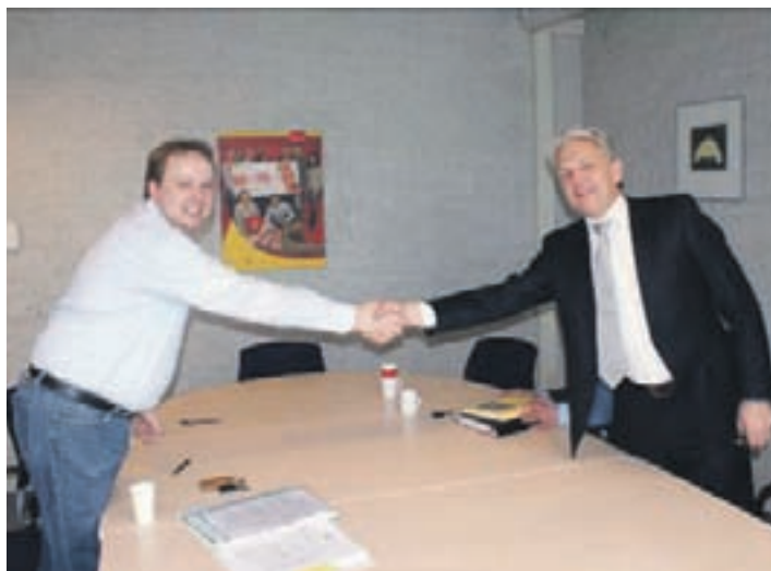
Ondertekening contract INTOP

Met dagtekening 28 februari 2010, zijn de aanslagbiljetten gemeentelijke belastingen 2010 verzonden. De eerste betaaltermijn is op 31 maart 2010 vervallen. Vóór deze datum had de helft van de verschuldigde belasting betaald moeten zijn. Op 30 april 2010 vervalt de laatste termijn van deze aanslagen. Spoedig daarna worden aanmaningen verzonden, waarbij aanmaningskosten in rekening gebracht worden. Wilt u geen risico lopen om een aanmaning te krijgen, maak dan gebruik van de mogelijkheid van automatische incasso. Een machtigingsformulier is al bij uw aanslag toegezonden. Voor nadere inlichtingen kunt u bellen met Cannon Chase, tel. 0487-518517.