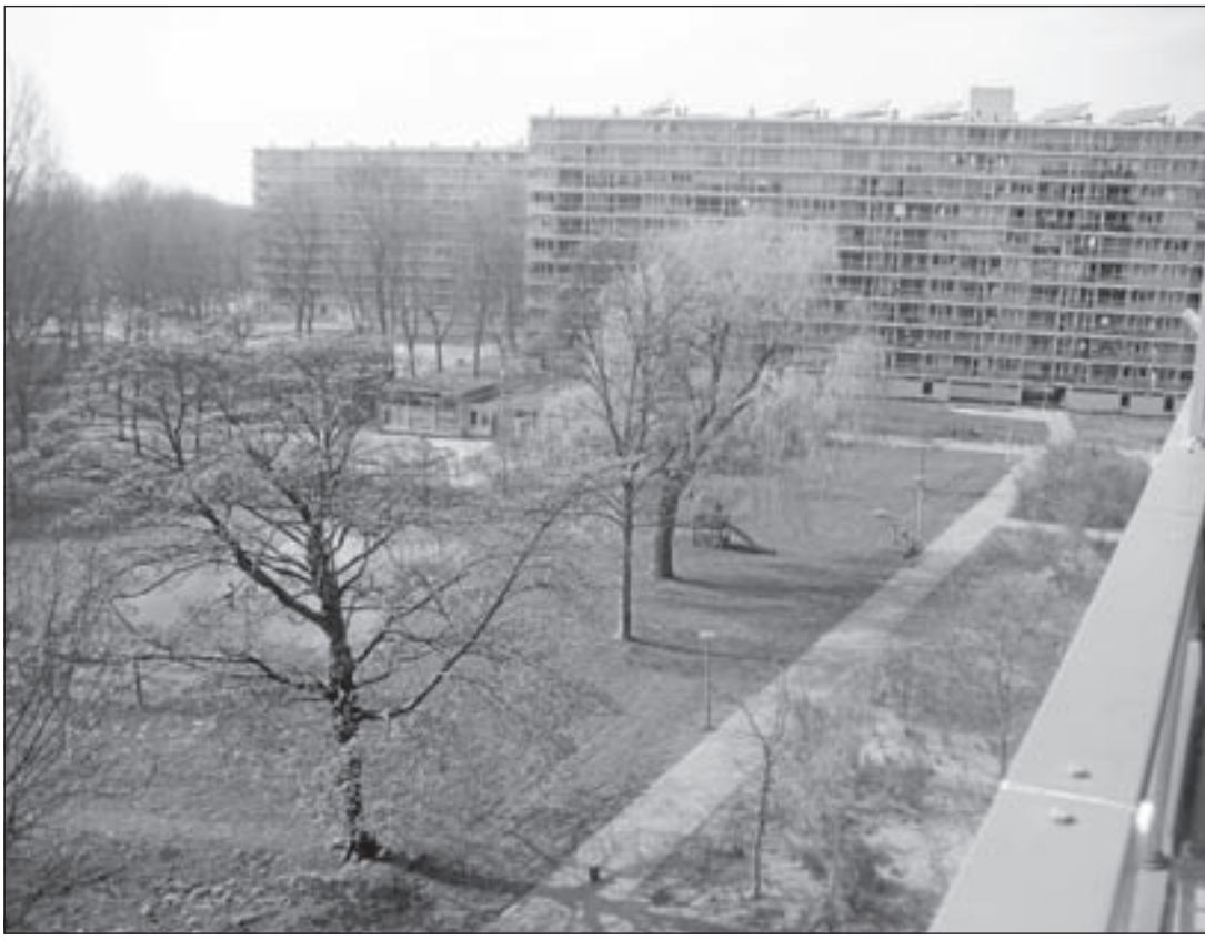
Nu nog leeg, maar dit terrein zal 30 april bol staan van de activiteiten