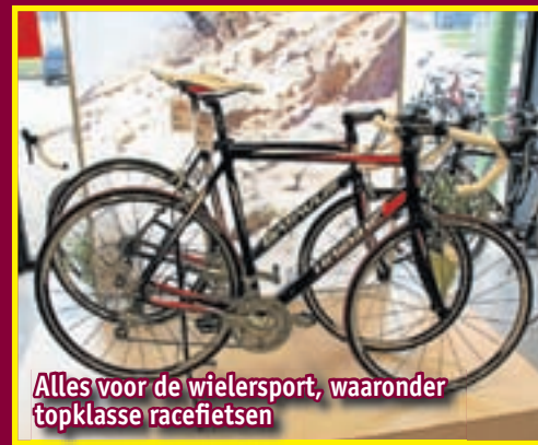
Alles voor de wielersport, waaronder topklasse racefietsen