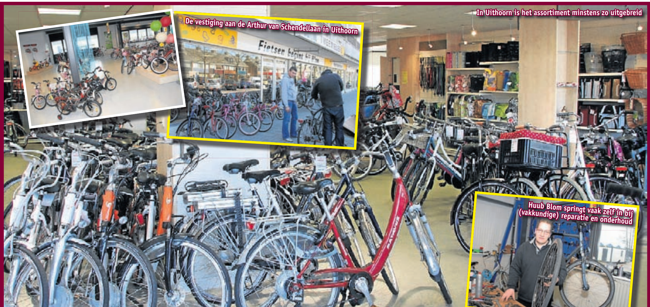
In Uithoorn is het assortiment minstens zo uitgebreid