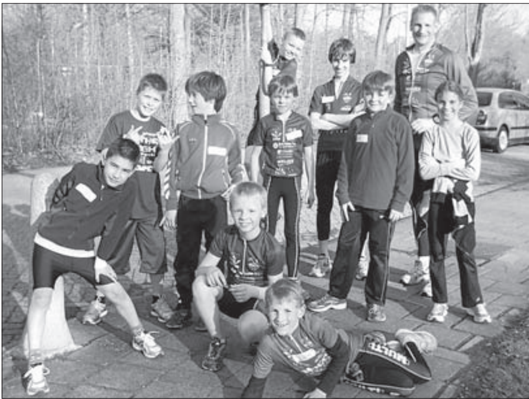
Kinderen van de Jeugdsportpas samen met jeugdleden van het Multi Triathlon Team