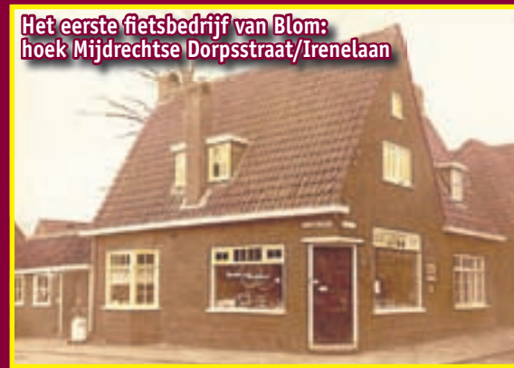
Het eerste fietsbedrijf van Blom: hoek Mijdrechtse Dorpsstraat/Irenelaan

"In de loop van de jaren daarna is het woonhuis in fasen helemaal verbouwd. Er kwam een winkel, een showroom en een werkplaats. De in-