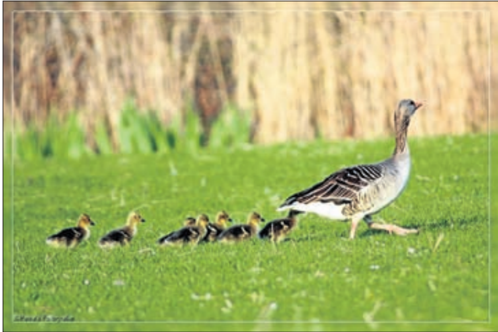
Uithoorn - Ik zag gisteren bij het ooievaarsnest de eerste jonge grauwe gansjes. Er zijn nog drie 'echtparen' met kleintjes. Wel vroeg dit jaar. Maar het is heerlijk om te zien dat er weer jong leven rondzwemt in Uithoorn.