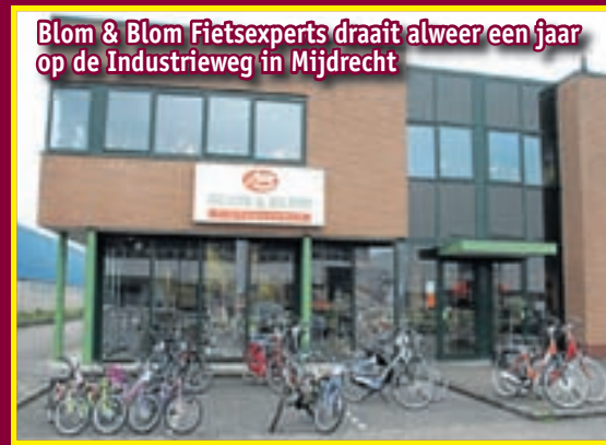
Blom & Blom Fietsexperts draait alweer een jaar op de Industrieweg in Mijdrecht