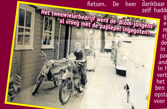
Het tweewielerbedrijf werd de 'Blom-jongens' al vroeg met de papepel ingegoten...

De komende maanden gaat Blom & Blom Fietsexperts een aantal actiematige aanbiedingen doen die stuk voor stuk in het teken staan van het 50-jarig jubileum. Tegen die tijd worden ze aangekondigd in deze krant.