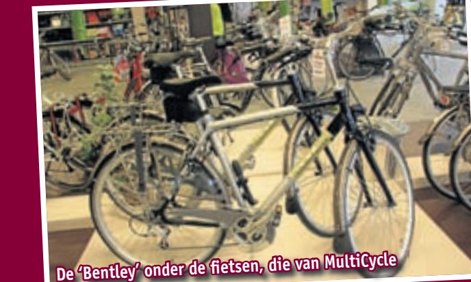
De 'Bentley' onder de fietsen, die van MultiCycle