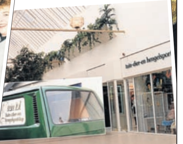
Zojuist geopend: de tuin- dier- en hengelsportshop van Van Tol in het splinternieuwe winkelcentrum Zijdelwaardplein