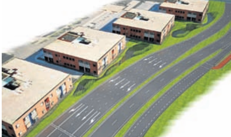
De Fokkerweg krijgt 2 x 2 rijstroken. Rechts daarvan op de foto is de parallelweg te zien voor ontsluiting van de bedrijven aan de oostkant van de Fokkerweg