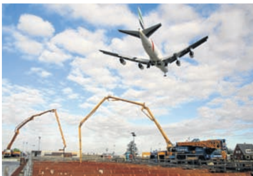
Storten van beton bij de westelijke tunneluitgang op het Bovenland. De kraanhoogte moet vanwege het vliegverkeer beperkt blijven