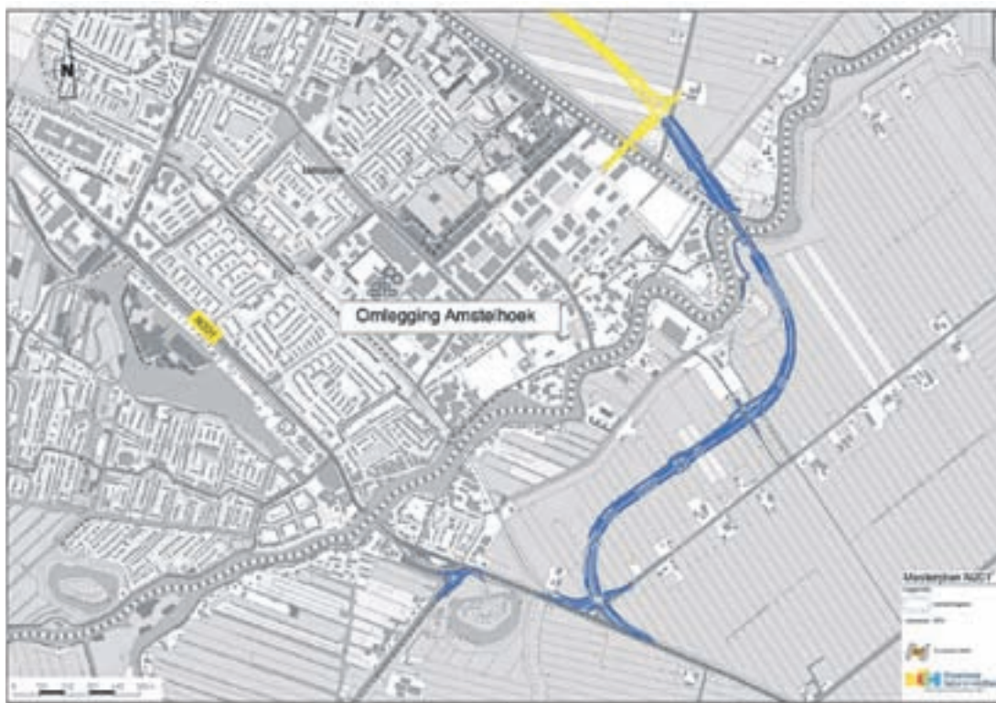
De omlegging van de N201 bij Amstelhoek. Let bij de kruising van de Amstel op de overgang van 2 x 2 rijstroken naar een 2 x 1 rijweg die bij de kruising ter hoogte van de Tienboerenweg weer aantakt op de bestaande N201. Beneden in het midden de contouren van het Fort Amstelhoek