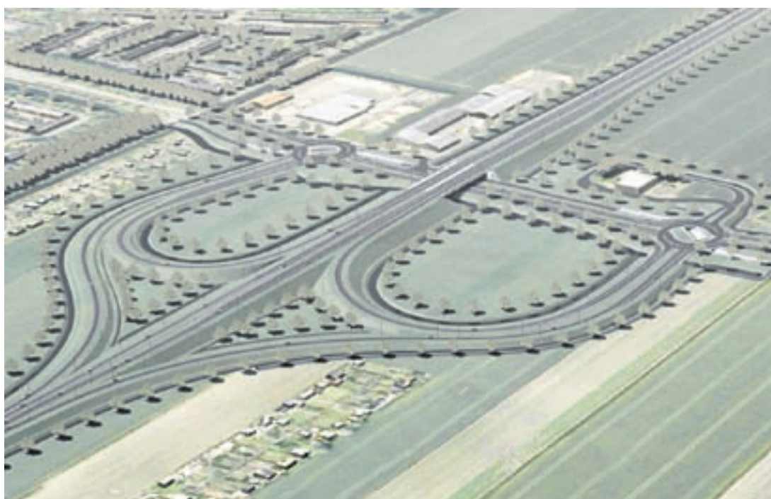
Impressie van de nieuwe ongelijkvloerse kruising bij de Zijdelweg ter hoogte van het Shell tankstation. Rechts van het midden de Zijdelweg richting Amstelveen en links intrede bij de Randweg in Uithoorn. De N201 komt rechtsboven vanuit de richting Aalsmeer en gaat naar Amstelhoek links beneden. Let op de toe- en afritten in de vorm van een half klaverblad