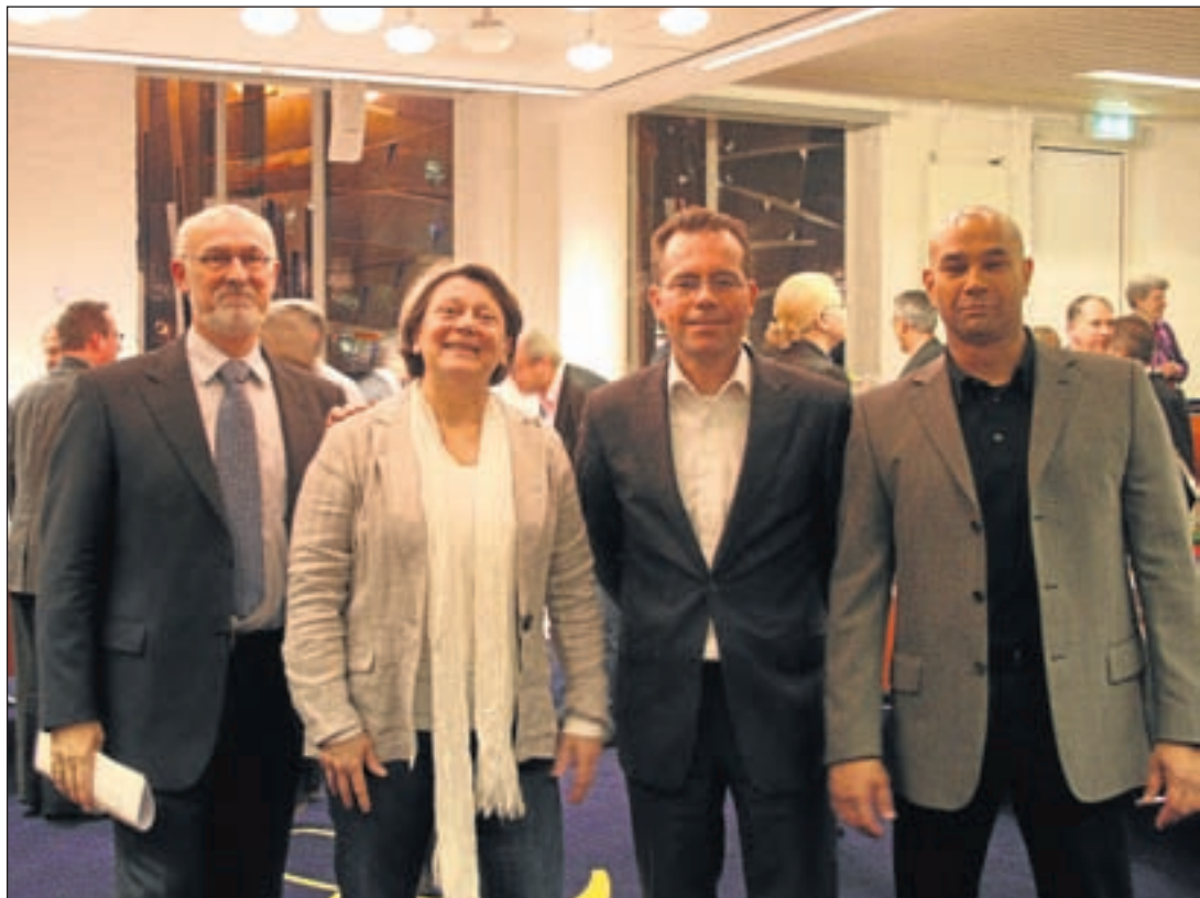
De geheel nieuwe fractie van de nieuwe partij DUS (combi van GL en D66)