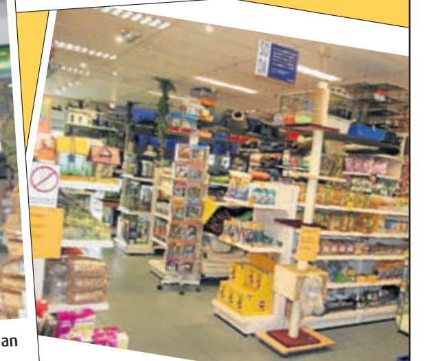
Tallose prettig geprijsde artikelen in de schappen