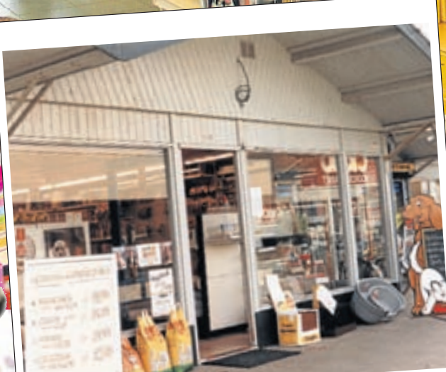
De noodwinkel van dierspeciaalzaak Van Tol in 1985 nabij het Zijdelwaardplein