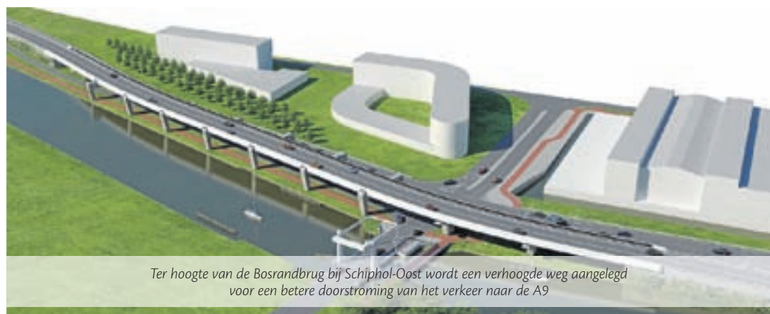
Ter hoogte van de Bosrandbrug bij Schiphol-Oost wordt een verhoogde weg aangelegd voor een betere doorstroming van het verkeer naar de A9