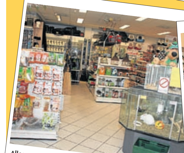
Alles voor de kleine huisdieren vindt u bij Van Tol