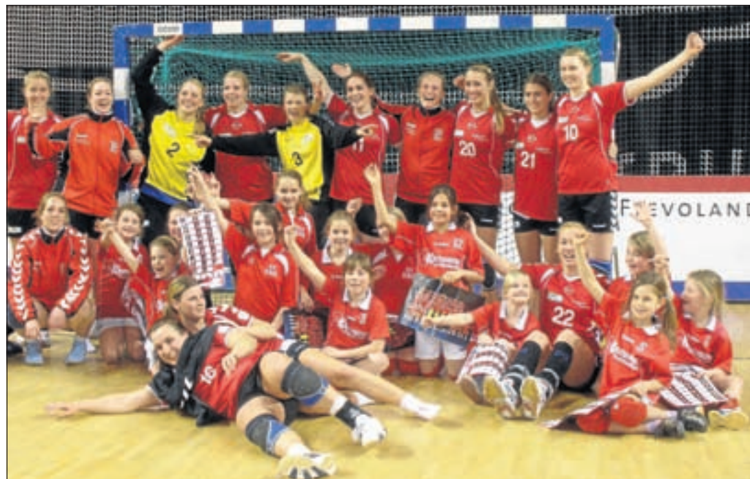
De oplooptkinderen van KDO met het Handbalacademie-team na de wedstrijd; uitzinnig vanwege de leuke avond en de overwinning!

Kom eens kijken tijdens een training op dinsdag van 17.00 tot 17.45 uur (D-jeugd) of op donderdag van 17.00 tot 18.00 uur (D-jeugd en E-jeugd) op sportpark KDO. Mailen voor meer informatie naar handbal@kdo.nl kan ook.