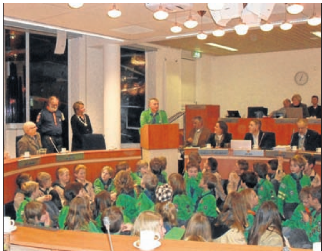
Enkele weken geleden bracht de scouting een taart

Het stimuleren hiervan betekent investeren in de kracht van de samenleving.