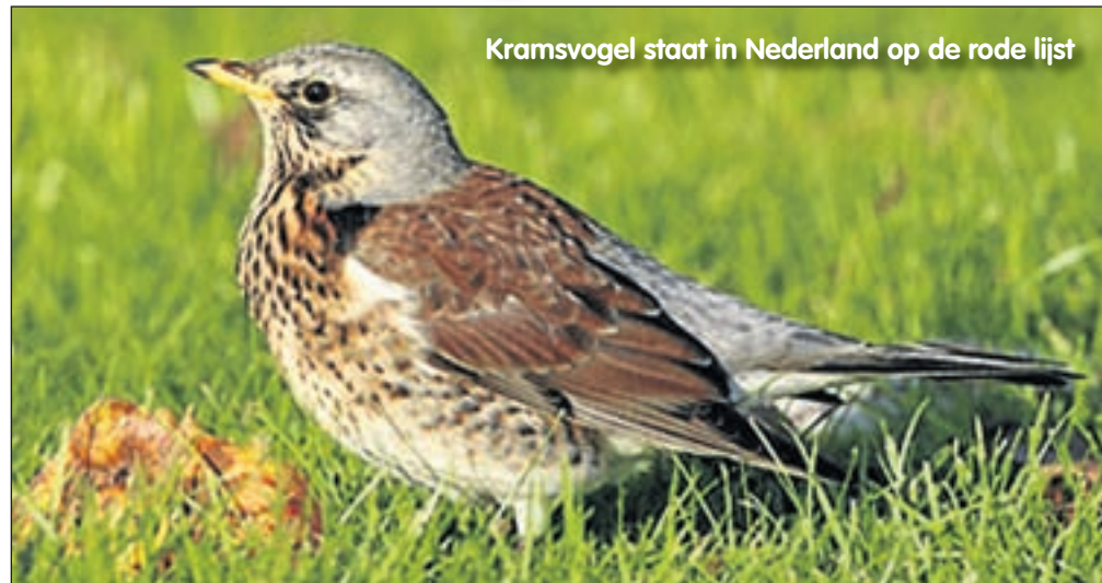
Kramsvogel staat in Nederland op de rode lijst

Om extra veel tuinvogels te lokken heb ik deze winter een voedersilo in de appelboom gehangen. In een doe-het-zelf-winkel heb ik een voederbakje gekocht en volgens de handleiding eenvoudig bevestigd aan een plastic fles.