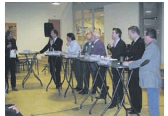
Lijsttrekkersdebat op 17 februari in basisschool De Zon in De Kwakel.

Via www.uithoorn.nl kunt u onder de knop gemeenteraadsverkiezing ook een kijkje nemen op de websites van de afzonderlijke partijen. Daar vindt u uitvoerige informatie over hun kandidaten, programma's en andere wetenswaardigheden.