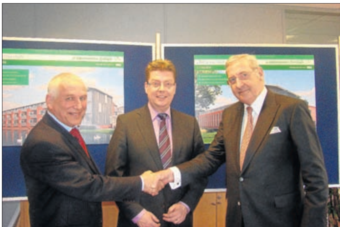
Officiële start voor huurwoningen en appartementen Park Krayenhoff