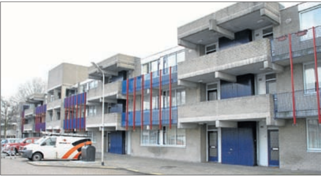
Hoogbejaarde bewoners in de zorgwoningen aan het Zijdelaardplein zijn al meer dan een week verstoken van hun lift