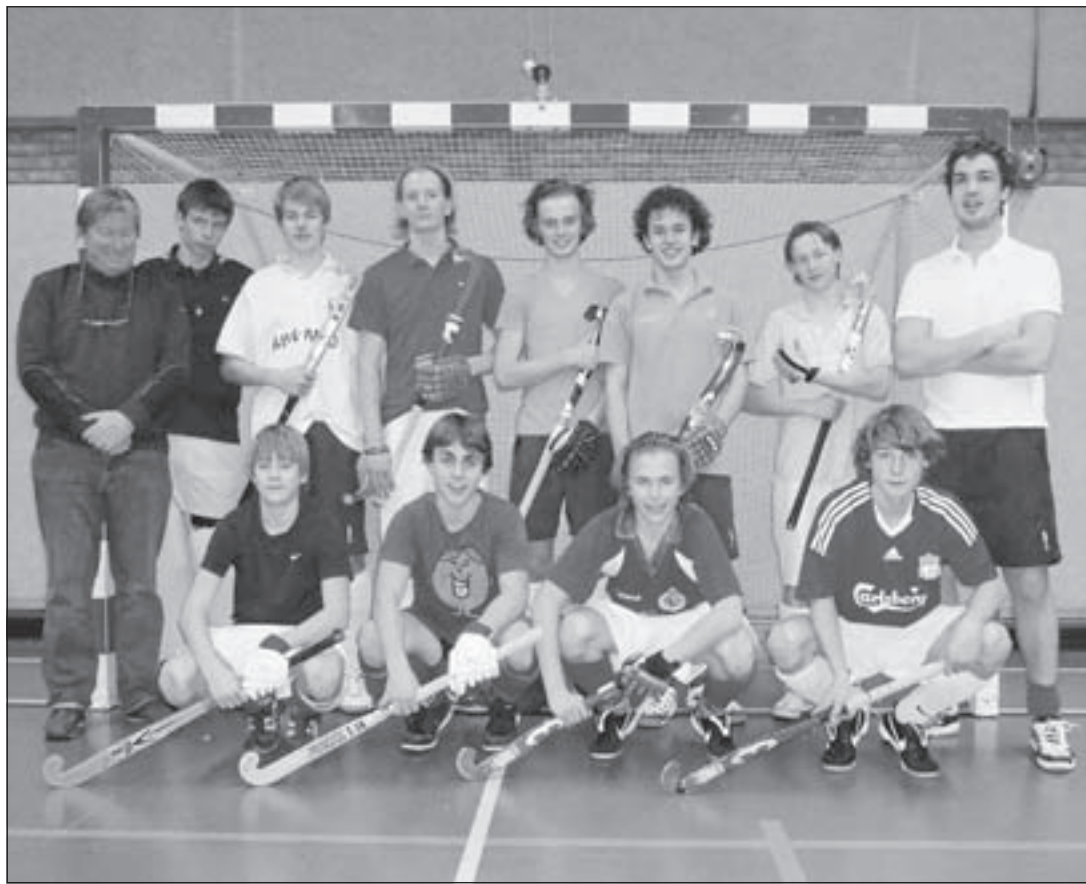
Qui Vive Jongens A1 eindigde in de Topklasse zaalhockeycompetitie op een mooie derde plaats