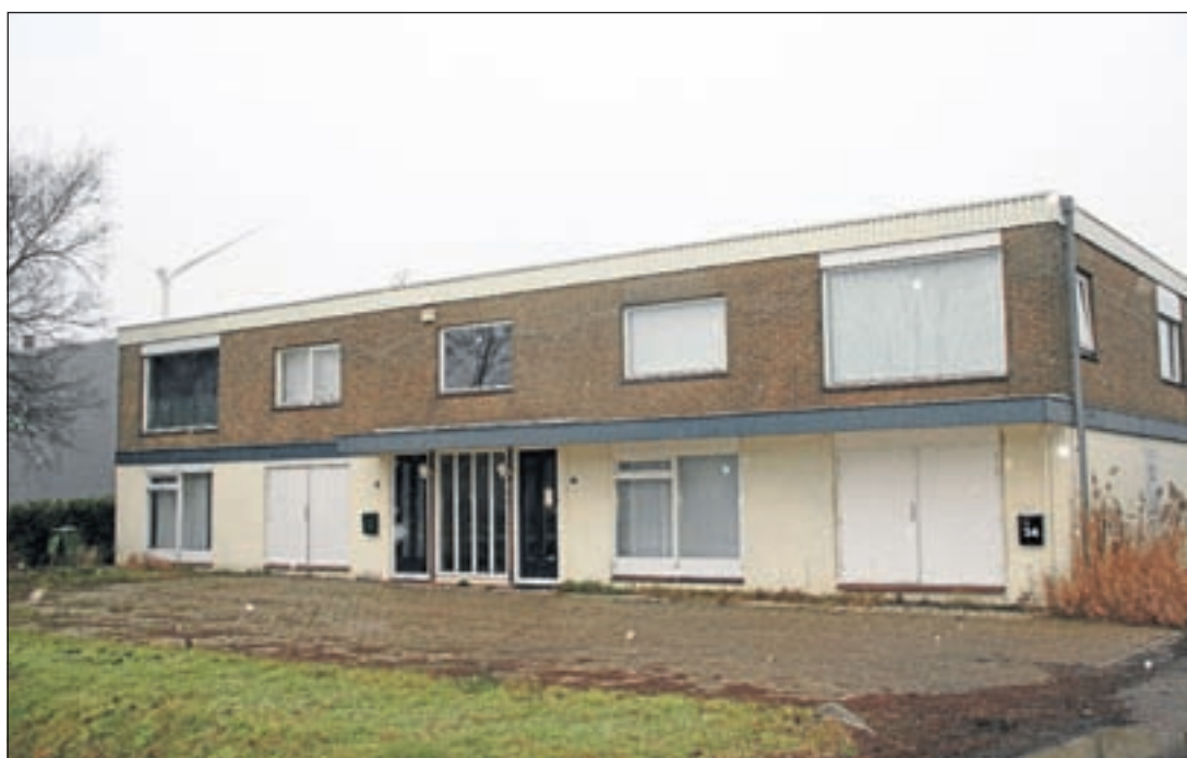
Over deze 'bedrijfswoning' gaat het, ziet er niet echt bewoond uit