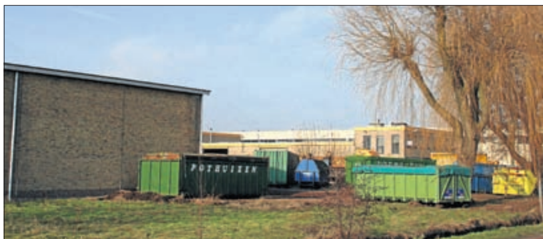
Het toekomstige terrein van Pothuizen in Mijdrecht

Is de bedrijfswoning nu bewoond of niet?