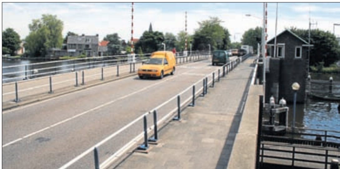
Het hele plan valt of staat bij de Irenebrug over de Amstel

Garagebrug en masterplan Oude Dorp worden bijeen gevoegd