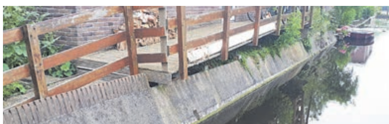
Opbrengst bestemd voor vervanging van de beschoeiing.

Dit jaar kunnen naast de appelbeignets, vier soorten oliebolletjes worden besteld. Lekker gevulde oliebolletjes, geheel blanke oliebolletjes en oliebolletjes met alleen stukjes appel erin. Speciaal voor mensen met allergie zijn er (alleen op bestelling via de website) op 30 december ook lactosevrije oliebolletjes te koop – goed gevuld maar zonder lactose. Voor bestellingen ga je naar oliebollenvinkeveen.nl .