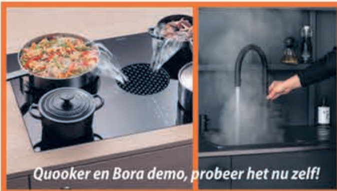
Quooker en Bora demo, probeer het nu zelf!