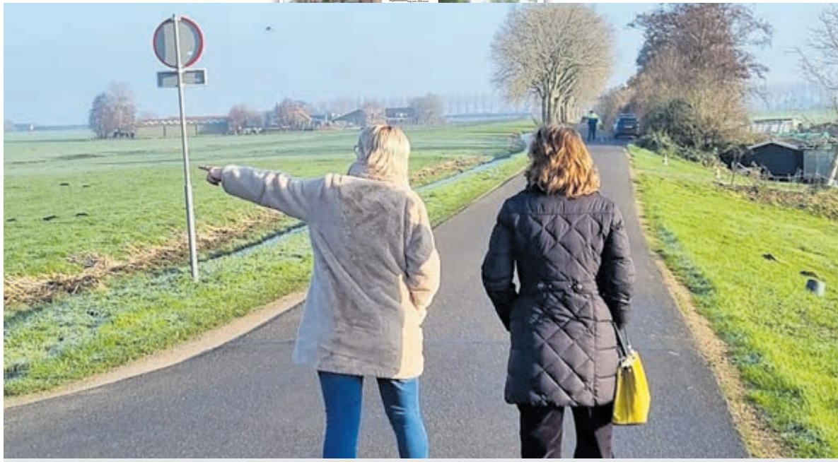
Statenlid Bikker van het CDA ging terplaatsen kijken