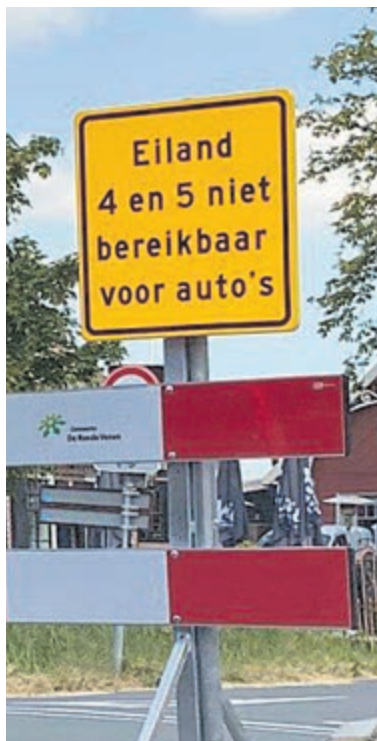
Zandeiland 4 is snel vol en parkeren langs de weg op de

Baambrugse Zuwe mag niet en ook op de Botholsedijk is het een probleem aan het worden.