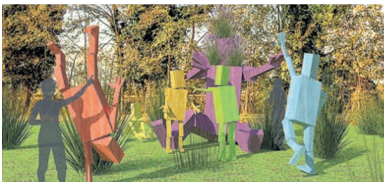
Het winnende ontwerp 'De Familie Scheg' van ontwerpstudio Pro Arts Design.

stemmen nu definitief geteld. Met slechts een kleine meerderheid van stemmen kwam ontwerpstudio Pro Arts Design als winnaar uit de bus.