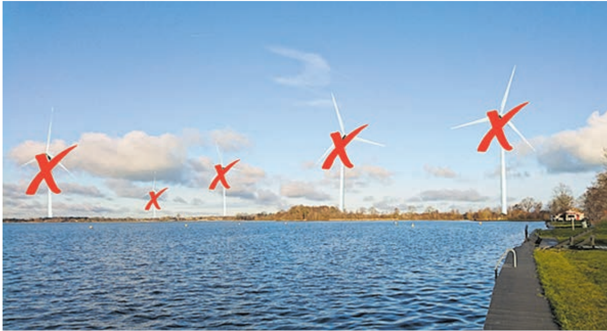
Dit wil je toch niet aan de rand van Vinkeveen?