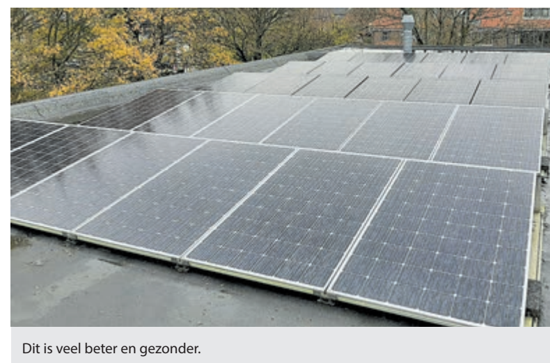
Dit is veel beter en gezonder.

Voor windturbines bestond jarenlang een harde geluidsgrens die niet mocht worden overschreden. Totdat het ministerie van Ministerie van Volkshuisvesting, Ruimtelijke Ordening en Milieubeheer (VROM) in 2009 besloot dat er nieuwe regels moesten komen. Daarin werd bepaald dat geluidsgrenzen voortaan jaargemiddelden moesten zijn.