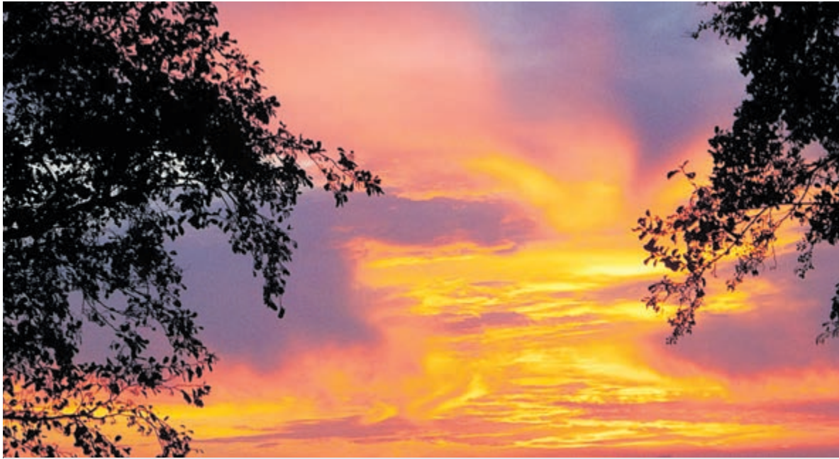
Prachtig gekleurde zonsopkomst.