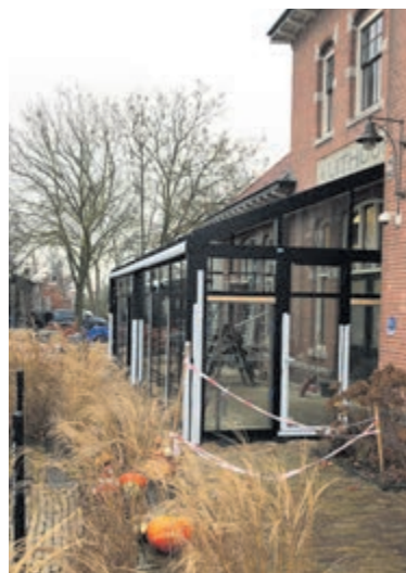
Nu de zaak toch weer gesloten is door de lock-down start direct de verbouwing

cheftables waar gasten de koks aan het werk kunnen zien. "In die zaal komt ook meer ruimte. Er konden zo'n 55 gasten in en dan kunnen we ruim zeventig mensen ontvangen voor een feest." In de compleet nieuwe keuken wordt gekookt op inductie, dus geen gas meer. Ook zal de warmte worden hergebruikt. De oude keuken wordt dan de spoelkeuken. Naast deze grote verbouwing zal ook het terras een update gaan krijgen, ter voorbereiding op de nieuwe Uithoornlijn. "We zijn een stationsgebouw uit 1912 en we zijn blij dat we straks weer een station zullen worden." In januari gaat de aanleg van de Uithoornlijn officieel van start. In die maand hopen Irene en Michel ook weer open te gaan voor hun gasten.