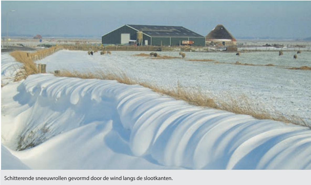
Schitterende sneeuwrollen gevormd door de wind langs de slootkanten.