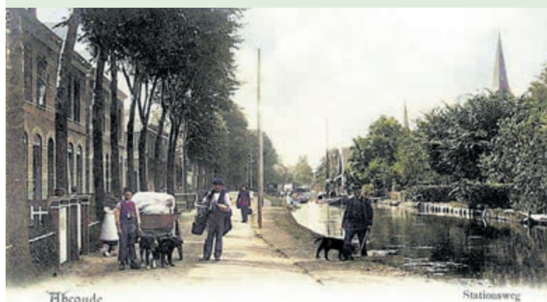
Hondenkar Stationsweg Abcoude 1900 (Rijksarchief Utrecht, nr 6811- ingekleurd).

Mijdrecht - Dinsdag 12 december 2023 is er weer de maandelijkse bingo. Deze Buurtbingo is elke tweede dinsdag van de maand. De bingo start om 14.00 uur. De kaartjes kosten € 0,50 per stuk. De bingo is in gebouw De Rank, Prins Bernhardlaan 2, tegenover gebouw De Veenstaete en de Vijver in Mijdrecht.