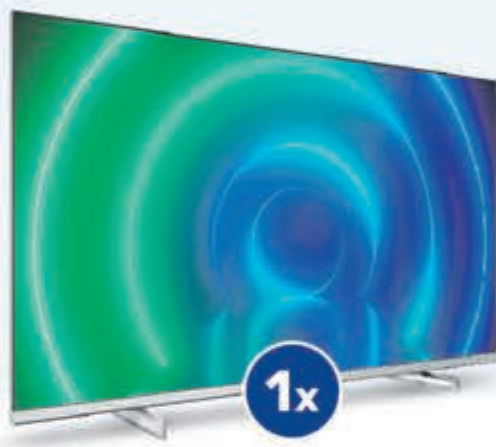
Philips Smart 4K Ultra HD Led TV t.w.v. € 449,-

Of één van de andere fantastische prijzen!