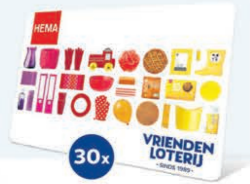
Hema Cadeaukaart t.w.v. € 25,-