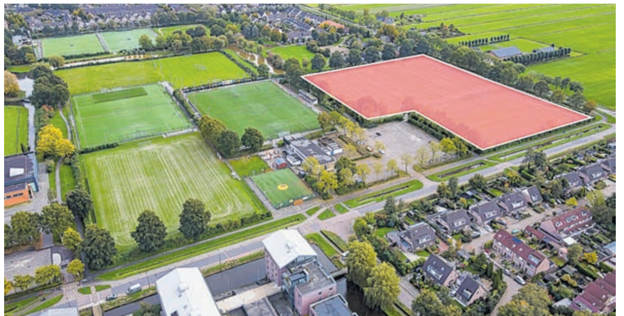
Velden die Argon inlevert voor woningbouw, opbrengst gebruikt voor alle buitensportverenigingen.

Buitensportverenigingen die ook gebruik willen maken van de subsidie van de gemeente, kunnen zich aanmelden via sport@derondevenen.nl . De regeling voor de ledveldverlichting loopt in 2022 en 2023. De regeling voor de overige energiebesparende maatregelen heeft een looptijd van vijf jaar.