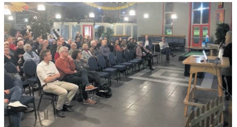
Vorig jaar kwamen ruim honderd inwoners naar de informatieavond van PUSH.