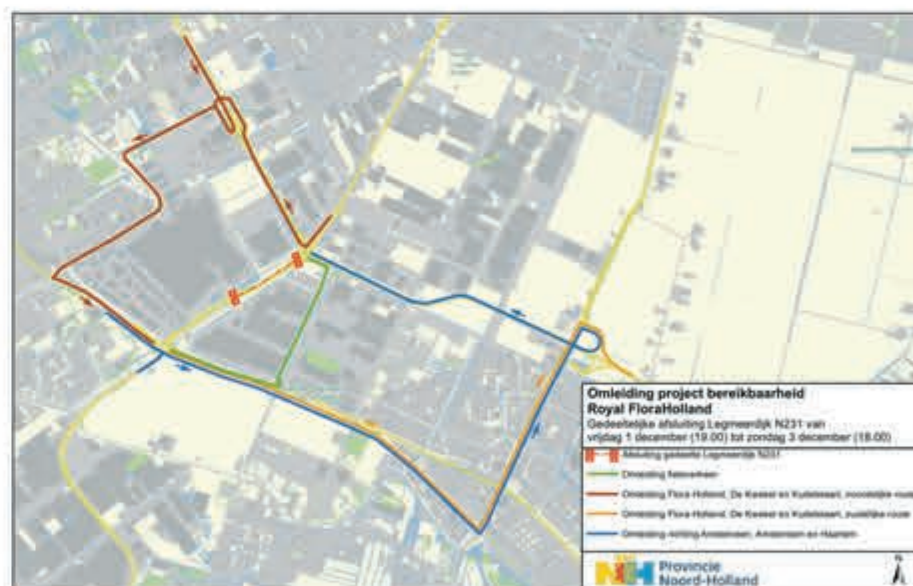
Omleiding weg en fietsverkeer

-Amstelveen, Amsterdam en Haarlem zijn te bereiken via: Koningin Maximalaan, Zijdelweg en N201