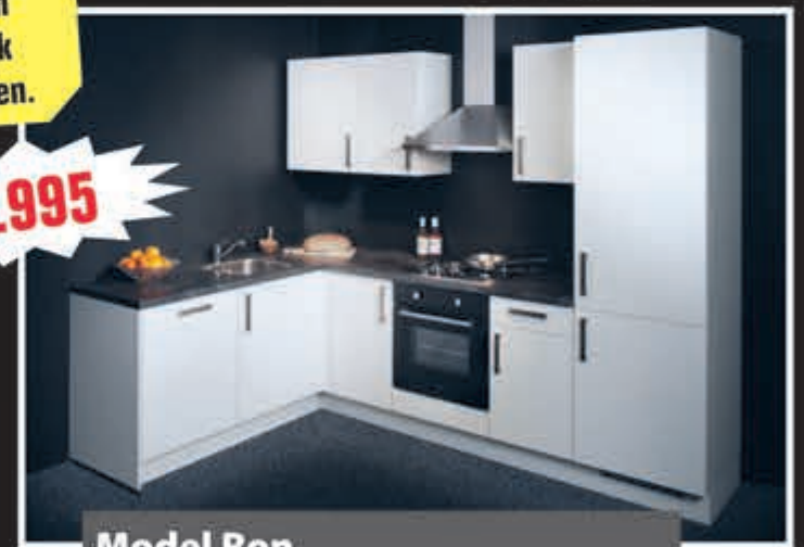
Model Ron softmat witte keuken uit voorraad, 187 x 275 cm.

De rechte keuken heeft een combimagnetron terwijl de hoekkeuken een oven heeft. Beide modellen hebben een kookplaat, vaatwasser, brede blokschouw, koelkast, aanrechtblad, spoelbak en kraan, met 5 jaar garantie. Aanpassingen mogelijk!