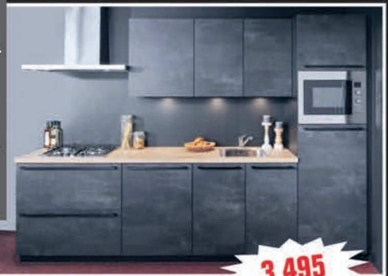
Model Levi Speed Beton uit voorraad, 300 cm.

Supercompleet met combimagnetron, kookplaat, vaatwasser, brede blokschouw, koelkast, aanrechtblad, spoelbak en kraan, met 5 jaar garantie. Aanpassingen mogelijk!