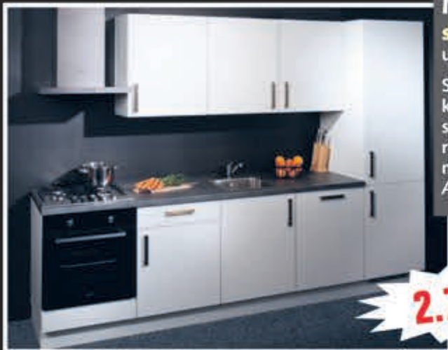
Model Jack softmat witte keuken uit voorraad, 270 cm.

Supercompleet met oven, kookplaat, vaatwasser, brede blokschouw, koelkast/vriezer, aanrechtblad, spoelbak en kraan, met 5 jaar garantie. Aanpassingen mogelijk!