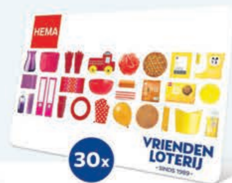
Hoofdprijs € 2.500,-