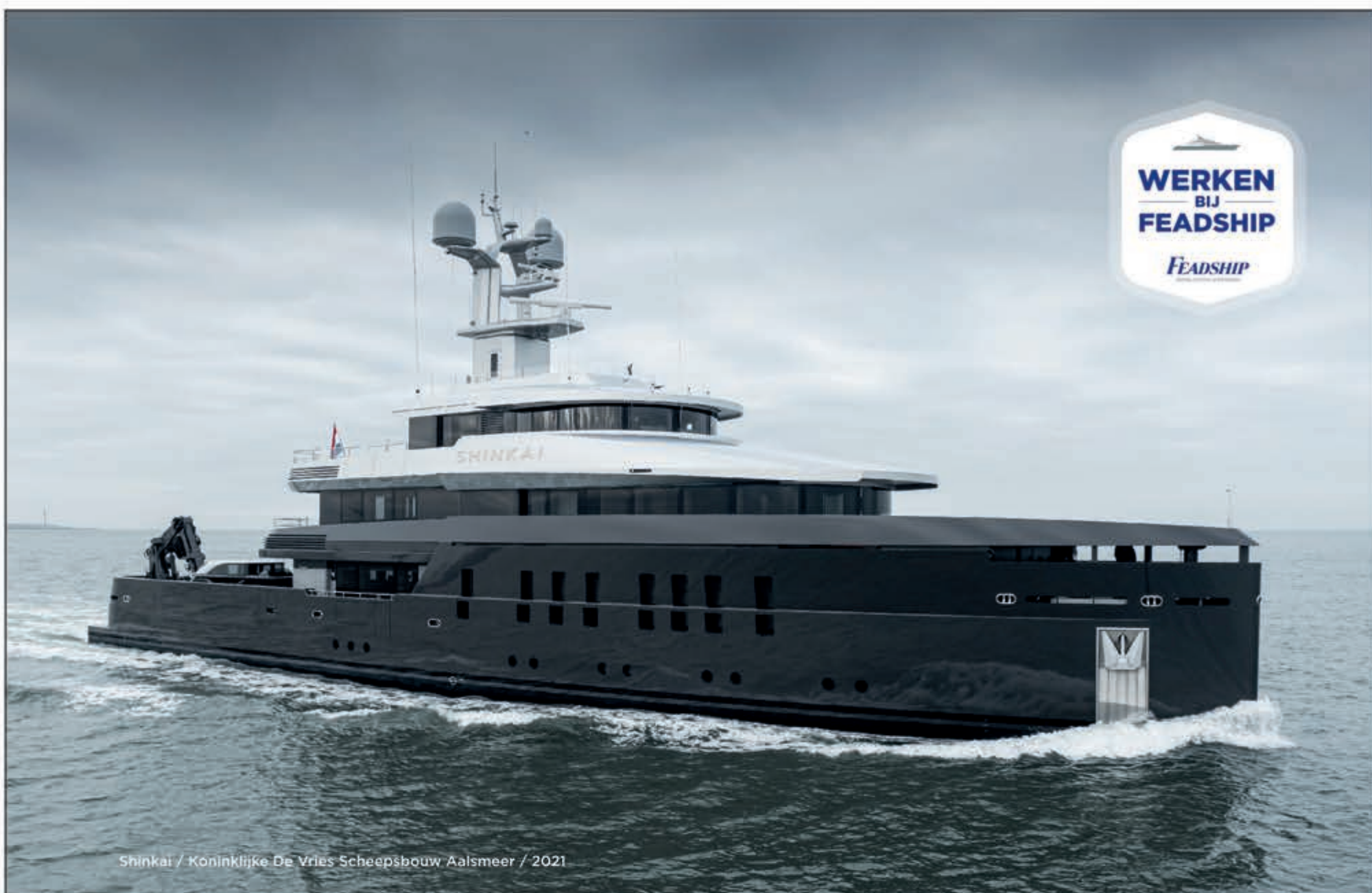
Shinkai / Koninklijke De Vries Scheepsbouw Aalsmeer / 2021