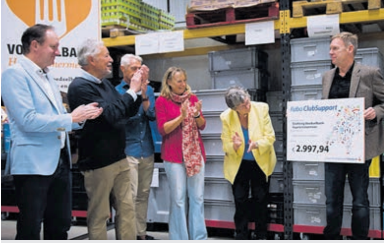
Vrijwilligers Stichting Voedselbank Haarlemmermeer en medewerkers/ledenraad Rabobank regio Schiphol.