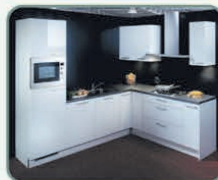
Kenmerkend voor de Lyon zijn de supersterke hoogglans lak-laminaat fronten.