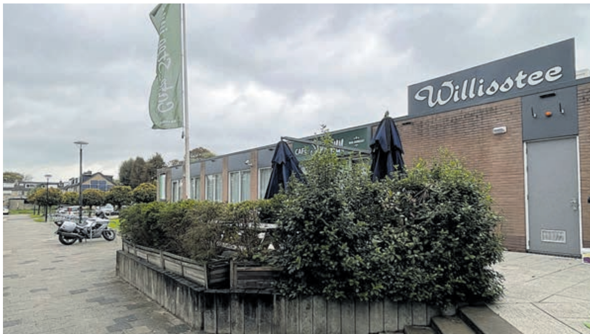
Er gaat heel wat gebeuren in en om het dorps huis.