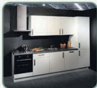
Het entree-model Speed heeft oerdegelijke mat witte fronten en heeft een mooie kantafwerking.