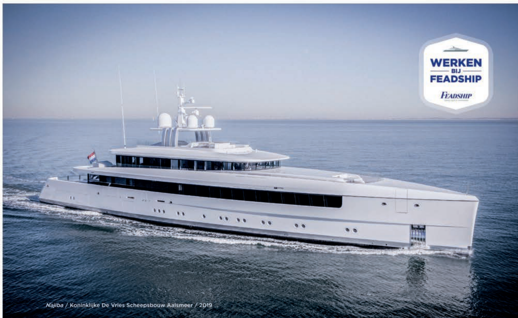
Najiba / Koninklijke De Vries Scheepsbouw Aalsmeer / 2019