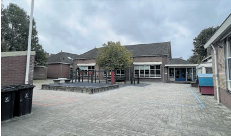
Het huidige schoolgebouw aan de Stationsweg, midden in de oude dorpskern, wordt ingeruild voor nieuwbouw bij het dorpscentrum 'De Willisstee'.