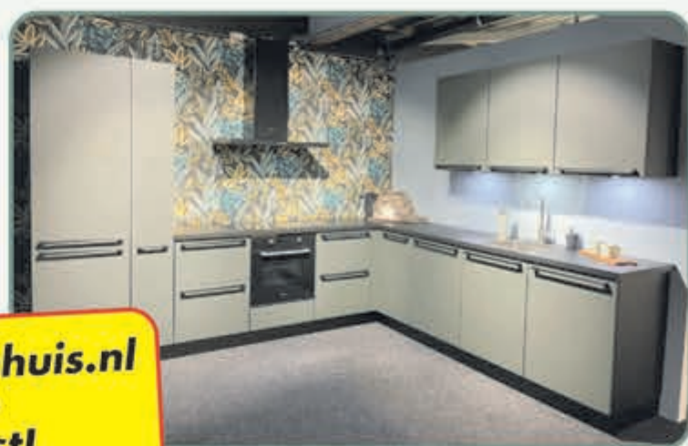
De Easy Touch groen is een tijdloze kleur, voorzien van anti-vinger print.