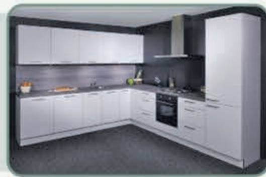
De fraaie Florenz heeft fluweelzachte fronten in een trendy matwitte kleur.