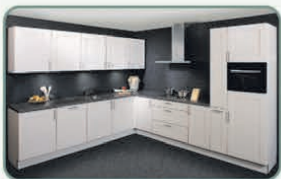
Luxe kaderkeuken model Valencia in de veel gevraagde kleur magnolia.