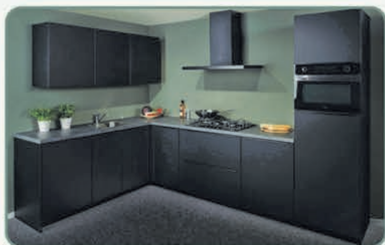
De Soft Touch Black is semi-greeploos en heeft satijnzachte fronten.