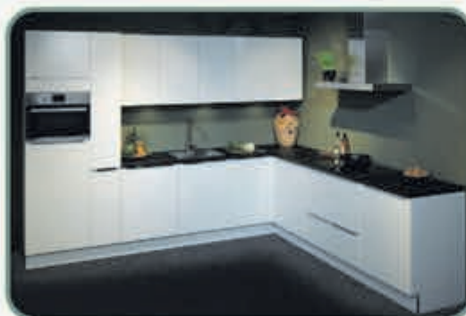
De Nolte Lux valt op door de sterke hoogglans lak-laminaat fronten en is (semi-) greeploos.