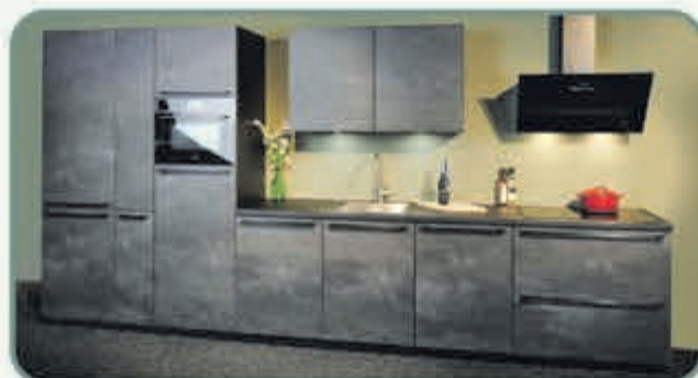
De Speed Beton is oerdegelijk en voorzien van brede gave zwarte grepen.