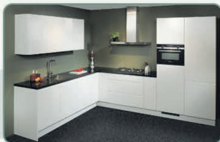
De luxe Nolte Alpha Lack heeft hoogglans witte fronten in een luxe greeploos design.