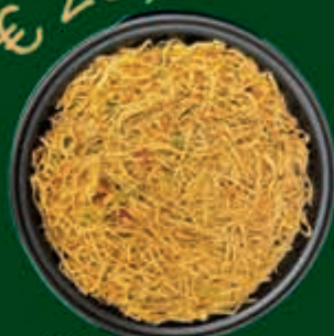
Bami met kip