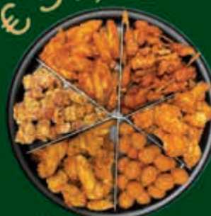
Van het huis