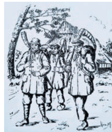
'Hannekemaaiers op weg naar Holland'

De Ronde Venen - De werkgroep Genealogie van de Historische Vereniging De Proosdijlanden werkt aan project om via stambomen te reconstrueren waar de families vandaan kwamen die de droogmakerijen in deze omgeving bevolkten. Vanaf ca. het jaar 1800 werden respectievelijk de polders: Eerste Bedijking, Tweede Bedijking, Derde Bedijking, Groot-Mijdrecht en tenslotte de Wilnise Polder drooggemalen en verkaveld. Vanuit de naamlijsten van de Burgerlijke Bestanden van de vroegere gemeenten Mijdrecht, Wilnis en Vinkeveen & Waverveen weten wij dat de polders een aanzuigende werking hadden op werkzoekenden. Uit Holland, Friesland en Zeeland kwamen landbouwers, veeboeren en landarbeiders naar deze gemeenten. En omdat in de Vinkeveense en Proosdij polders nog tot na de Tweede Wereldoorlog turf werd geproduceerd kwamen hier ook Duitse Hollandgänger en zogenaamde Hannekemaaiers. Wilt u weten waar de fundamenten van uw familie zijn gelegd en weet u niet, WAAR EN HOE te beginnen aan de zoektocht daarnaar? Op woensdag 18 oktober, vanaf 13.30 uur tot ca. 16.00 uur, kunt u